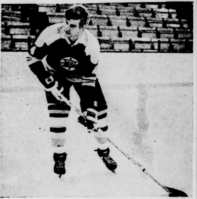
(Tête haute et corps incliné en direction du lancer)