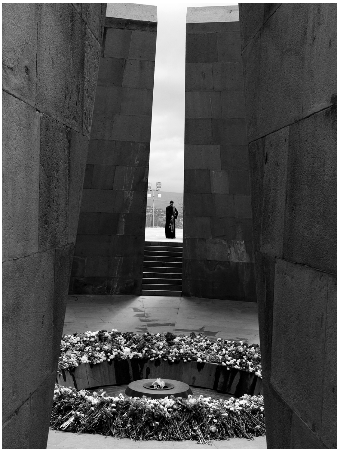
Des fleurs ont été déposées vendredi au Mémorial du génocide arménien à Erevan.