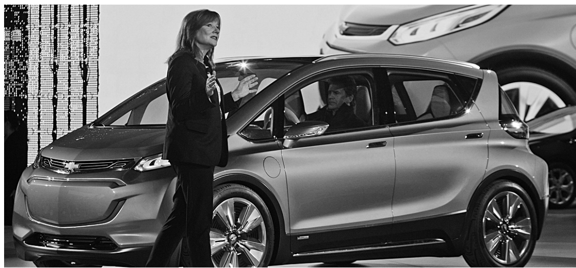
Mary Barra, présidente et chef de la direction de GM, au Salon de l'auto de Detroit en janvier 2015