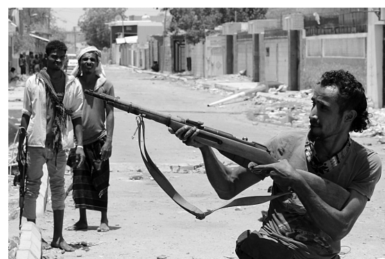
Un milicien combat les rebelles houthis à Aden.