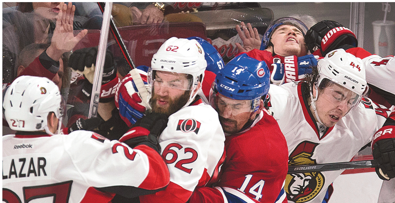
Quelques échauffourées ont éclaté pendant le match, sans toutefois dégénérer en bagarres.

Tout cela ne nous rajeunit pas une miette, misère.