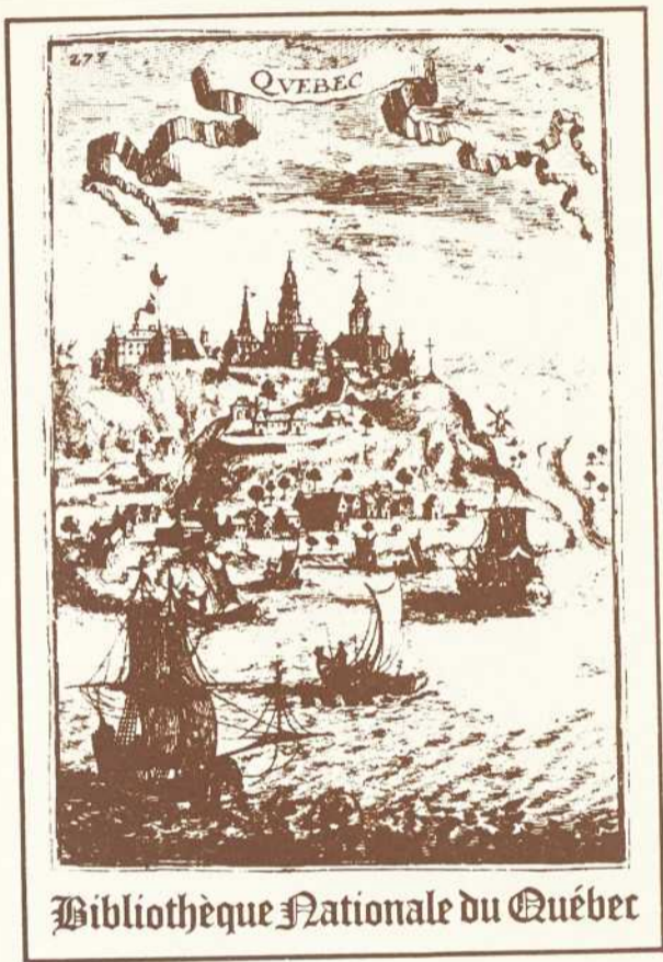
Bibliothèque Nationale du Québec