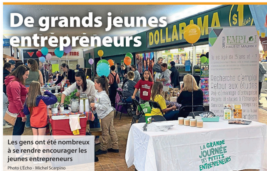
De grands jeunes entrepreneurs Les gens ont été nombreux à se rendre encourager les jeunes entrepreneurs

«Vieillir, c'est très ennuyeux, mais c'est la meilleure façon de vivre vieux», termine-t-il, non sans une pointe d'humour.