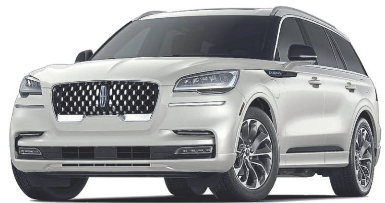
Aviator Grand Touring 2022

LINCOLN DE TROIS-RIVIÈRES 7100, boul. Gene-H.-Kruger 819 370-3315