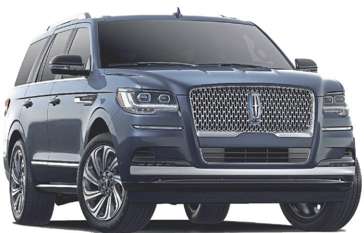
Navigator Ultra 2022

Être propriétaire comporte des privilèges.