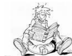
Shilpi Somaya Gowda La fille secrète

Vous avez des suggestions de lecture, de films, de documentaires et/ou d'activités, envoyez-nous les coordonnées par courrier électronique au : cfortin@mouvement-retrouvailles.qc.ca et nous en prendrons bonne note.