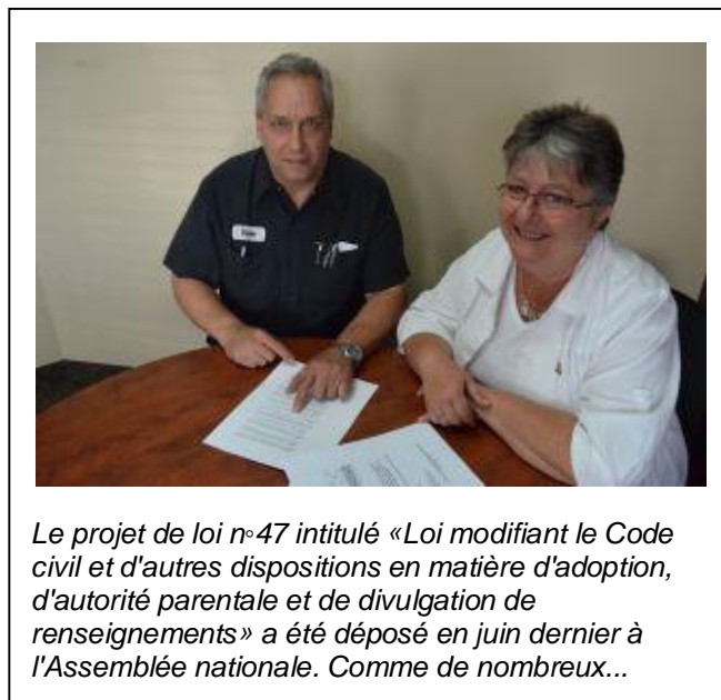
Le projet de loi n°47 intitulé «Loi modifiant le Code civil et d'autres dispositions en matière d'adoption, d'autorité parentale et de divulgation de renseignements» a été déposé en juin dernier à l'Assemblée nationale. Comme de nombreux...