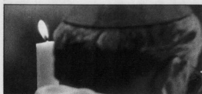
PAOLO COCCO AGENCE FRANCE-PRESSE

Les «papabili» arrivent à Rome et s'enfermeront bientôt dans le silence du conclave