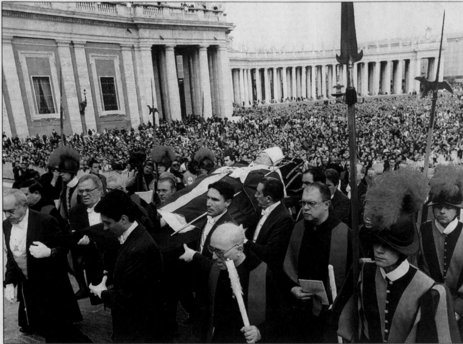
Le corps du pape Jean-Paul II a été transporté hier jusqu'à la basilique Saint-Pierre, traversant une foule immense massée place Saint-Pierre, à Rome.