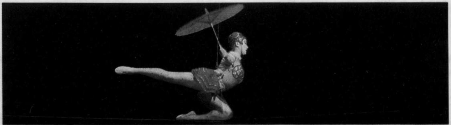
Une funambule du Cirque du Soleil lors d'une représentation de Saltimbanco à Séville, en janvier 2004. Certains déplorent que le Cirque arrive maintenant à Paris avec ce spectacle déjà vieux de 11 ans.