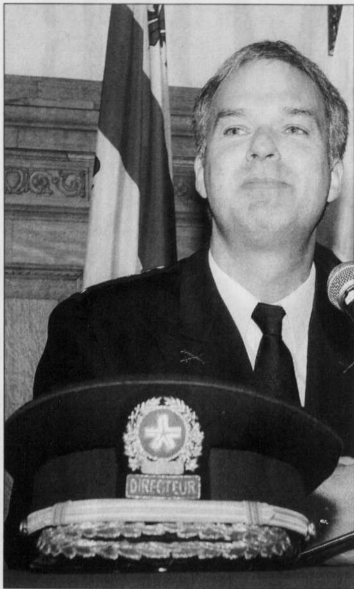
Yvan Delorme, le nouveau chef du SPVM, est âgé de seulement 42 ans.

Prudent, Yvan Delorme a refusé hier de se prononcer sur l'intégration possible des agents de