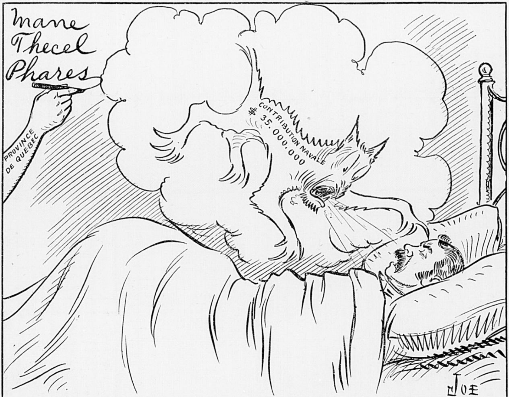
Au lendemain de l'assemblée de St-Gabriel la question navale donne le cauchemar à M. Borden, Enfin ! la Province de Québec se réveille !!