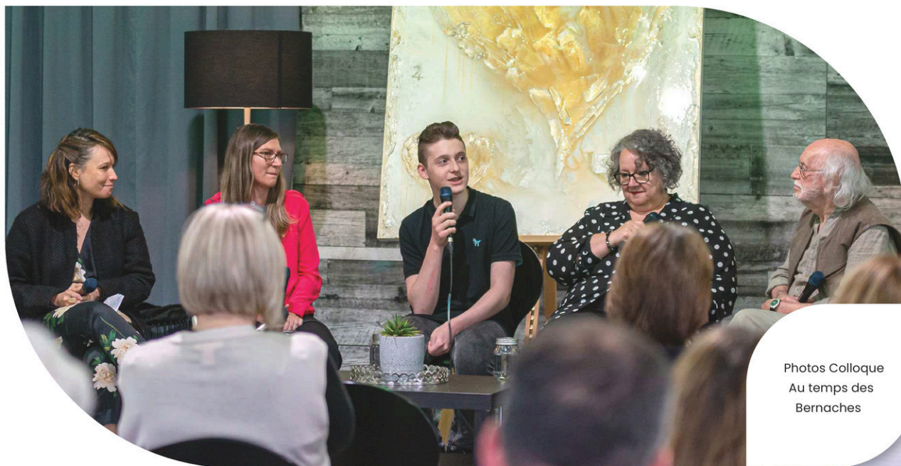
Photos Colloque Au temps des Bernaches

Réaliser les enjeux qui interpellent la qualité de vie des proches aidants et qui font écho aux besoins de soutien, réconcilier la population à la proche aidance et à la reconnaissance de ses réalités et de ses besoins sont essentiels, si l'on veut co-construire des solutions communautaires et de proximité dans le contexte de vieillissement accéléré de la population québécoise.