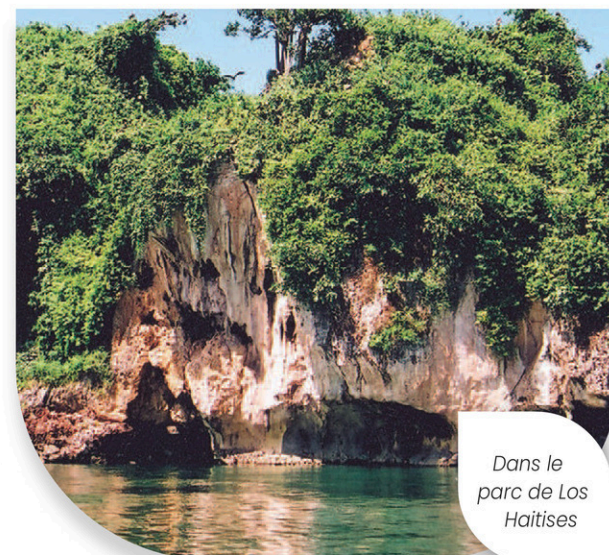
Dans le parc de Los Haitises