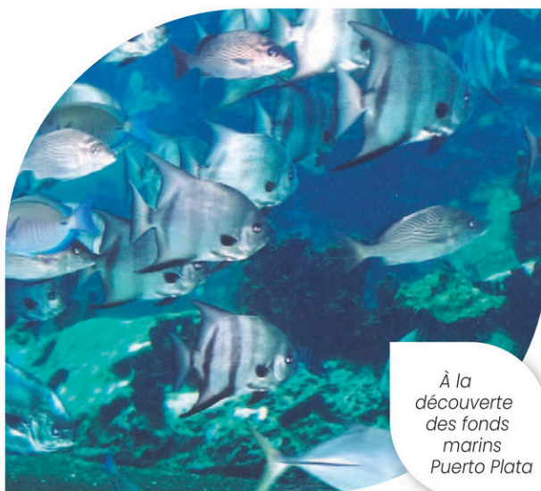
À la découverte des fonds marins Puerto Plata