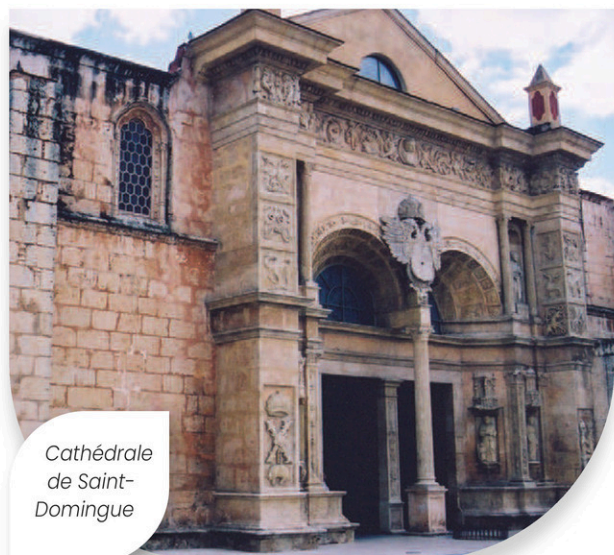
Cathédrale de Saint-Domingue

Si la République dominicaine compte parmi les plus beaux terrains de golf des Antilles, celui de Playa Grande est un site exceptionnel. Situé à une heure de route à l'est de Puerto Plata, il a été aménagé en bordure de mer, au sommet de falaises. Il offre une vue imprenable sur Playa Grande.