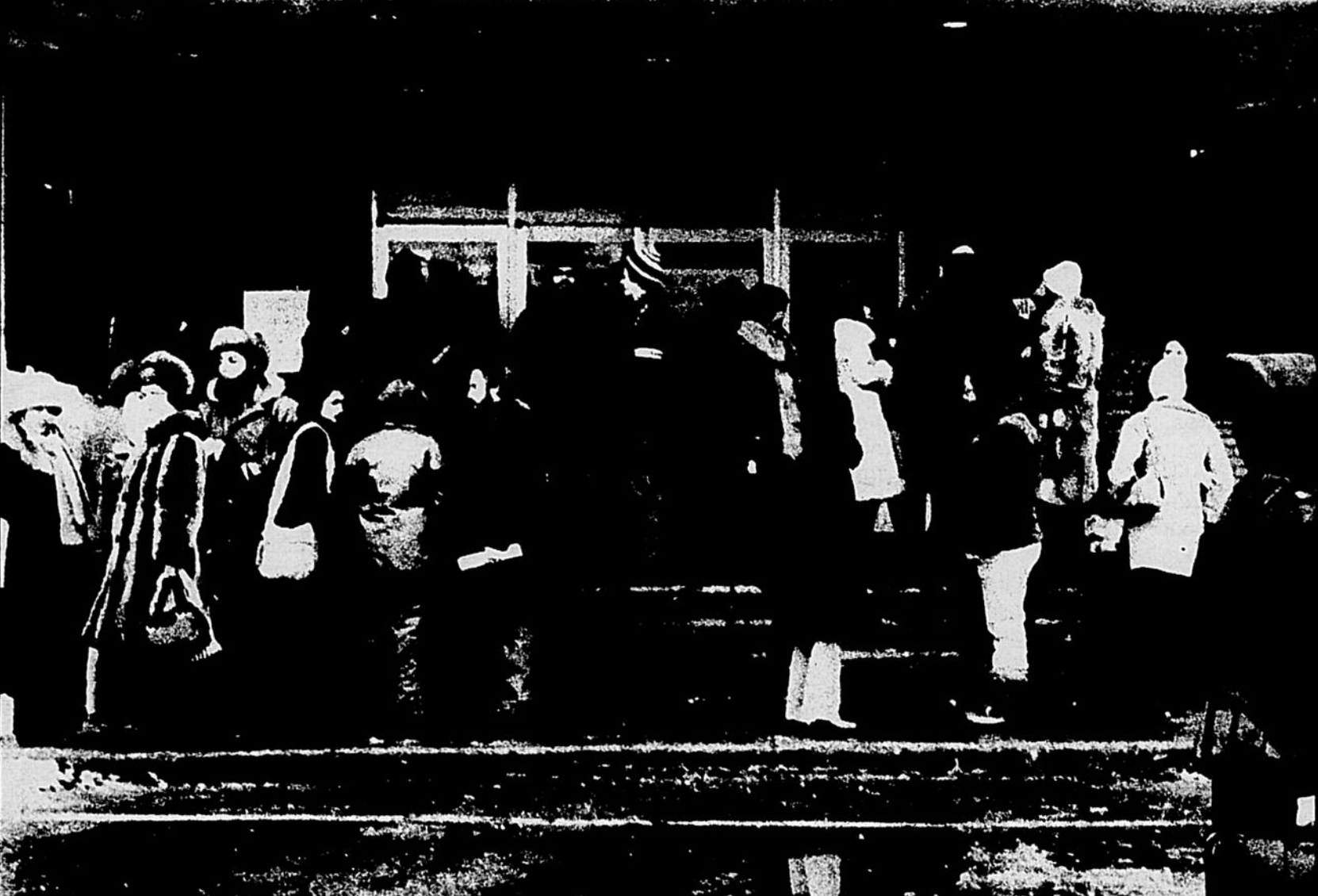
LE CAMPUS A L'HEURE DES NEGOCIATIONS.