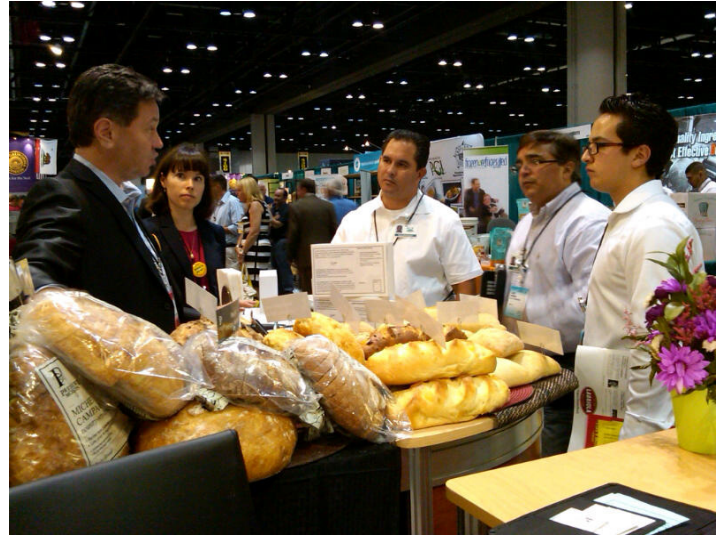
Salon de l'International Dairy Deli Bakery Association (IDDBA) à Orlando, Juin 2013