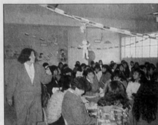
SOURCE UQO Au Pérou, des groupes de femmes s'organisent collectivement pour assurer la survie de leurs familles.

Avec le temps et le soutien d'ONG, un certain nombre de ces cuisines collectives ont élargi leur activité économique. Ce qui a alors donné naissance à de véritables entreprises de quartier et à des services de proximité fort divers. Des cuisines servent des repas qu'elles vendent dans leur milieu immédiat. Mais d'autres vont aller jusqu'à ouvrir des boulangeries, pendant que d'autres gèrent des centres d'approvisionnement