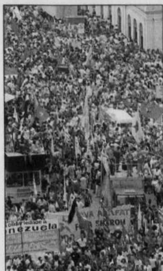
SERGIO MORAES REUTERS Le 3 e Forum social de Porto Alegre, en janvier dernier.

L'expérience de Porto Alegre nous permet de signaler quatre principales phases de réalisation de cette nouvelle dynamique de régulation économique et sociale à l'échelle d'une grande agglomération urbaine comparable à Montréal. Par exemple, la première phase qui commence en 1989 est caractérisée par une profonde frustration liée au manque de ressources financières par rapport aux demandes sociales exprimées. Mais, dans un deuxième temps (1990-1991), une réforme définissant, entre autres, l'origine des ressources pour faire face aux demandes populaires de même que la création d'une structure de soutien administratif à son implantation a permis d'engager le processus. En 1993-1994, une troisième phase s'ouvre avec l'introduction du processus d'identification de priorités thématiques (éducation, santé, développement local, habitat), de même que la reconnaissance, par les autorités locales, d'un Conseil de budget participatif en tant qu'instance suprême de représentation populaire. C'est pendant cette période que cette politique a commencé à être reconnue par les mouvements so-