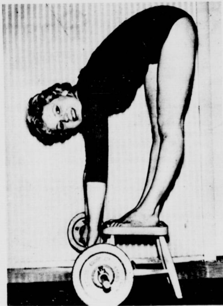
Voici un excellent exercice, Madame, qui vous permettra de garder la ligne à tout âge. Regardez comme il est facile. Il est vrai que la belle jeune femme qui le pratique avec tant d'aisance est mantrice de culture physique dans un collège de jeunes filles de Sheffield.

Vous vous sentez si fraîche, si propre avec Tampax