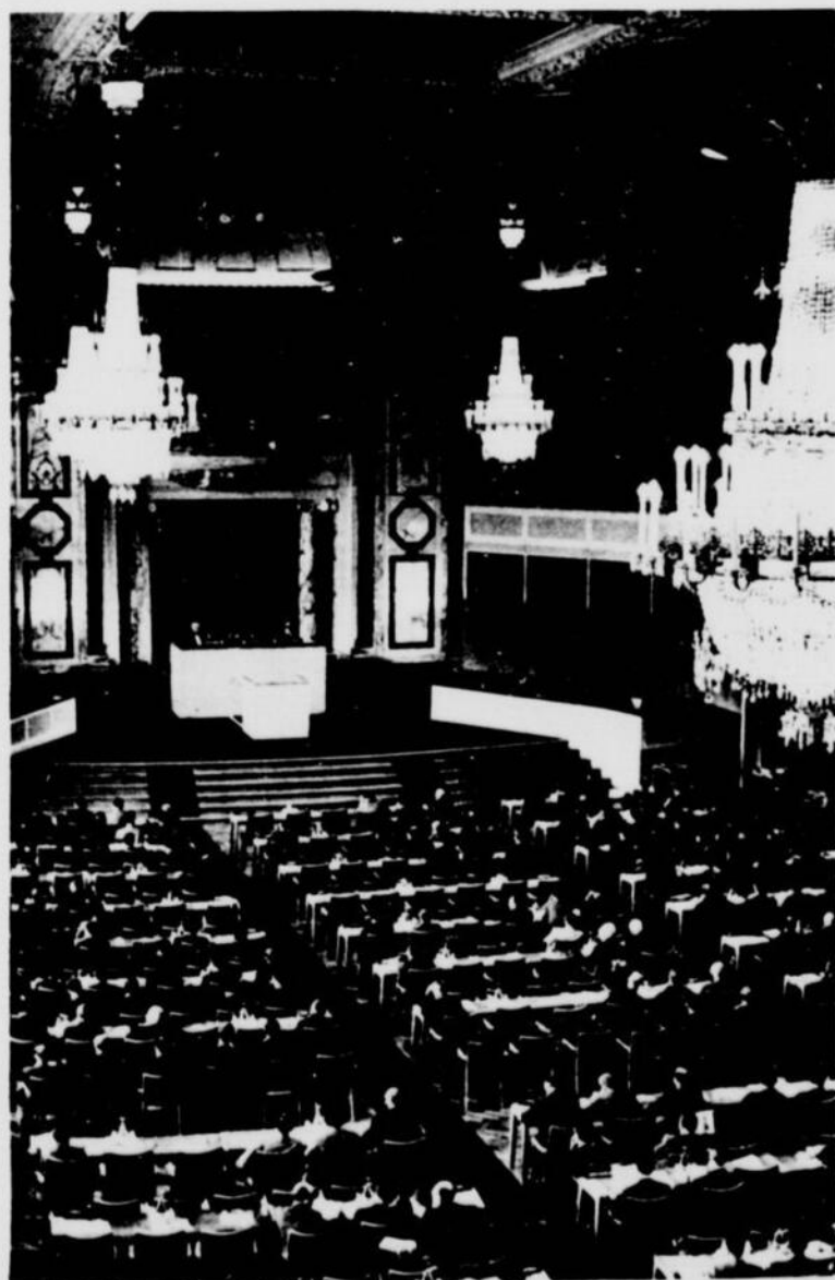
Cette photo de la Galerie Impériale du château de Hofburg, jadis le palais des empereurs, maintenant habitée par le Président Adolphe Schœfer, fut prise au cours d'une séance de la conférence au sujet de l'énergie atomique. Vienne, rendez-vous des Grands comme au temps de François-Joseph, deviendrait la future capitale des États-Unis d'Europe, comme elle fut le bastion de l'Europe contre l'invasion des Turcs aux 16e et 17e siècles.

"Le pied de Talleyrand eût-il été plus long, le destin des peuples eût changé," a écrit M. Paul Léon dans la préface des Mémoires de celui qui avait trahi successivement son ordre, son Eglise et son roi, et dont Napoléon, qui l'avait comblé, disait: "Vous êtes de la . . . dans un bas de soie". À ses détracteurs l'évêque d'Autun pouvait répondre, s'adressant à Lamartine: "On me croit immoral et machiavélique. Je n'ai jamais donné un conseil pervers à un gouvernement et aux princes, mais je ne m'accroche pas avec eux après les naufrages. Il faut des pilotes pour recueillir les naufragés. J'ai du sang-froid et je les mène à un port quelconque. Peu importe le port pourvu qu'il abrite. Que deviendrait l'équipage si tout le monde se noyait avec le pilote?" L'apostat eut une fin édifiante.