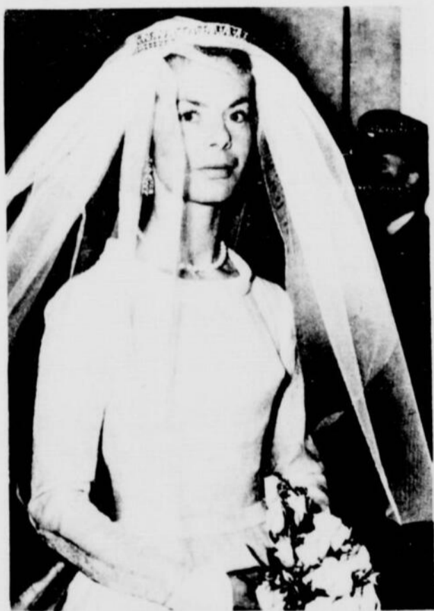
La mariée, Katharine Worsley, photographiée quelques instants avant son mariage au duc de Kent.

Les futurs mariés font la révérence devant la reine avant de venir se prosterner aux pieds de l'officiant.