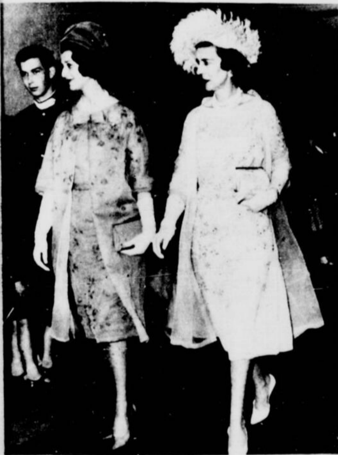
La famille du duc de Kent: de g. à d.: le prince Michel, son frère; la princesse Alexandra, sa sœur; et la princesse Marina, sa mère. Cette dernière a renoncé à son titre de duchesse de Kent. Princesse Marina de Grèce au moment de son mariage avec le feu duc, en 1934, elle a choisi de reprendre son ancien nom de Princesse Marina plutôt que de porter le titre de duchesse douairière de Kent. Le prince Michel fut le témoin de son frère.

À la suite de l'émouvante cérémonie, les nouveaux époux quittent l'église et saluent la foule de la limousine Rolls Royce mise à leur disposition par la reine. La réception est lieu à Hovingham, village natal de la mariée.