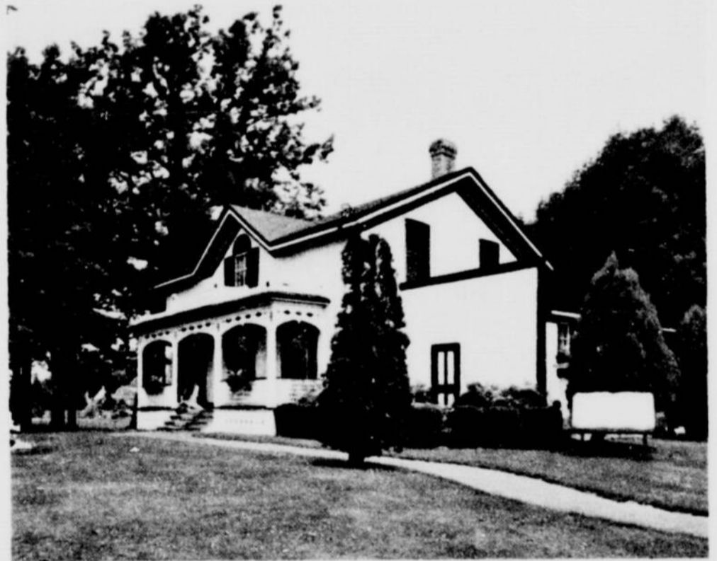
La maison de Graham Bell à Brantford. C'est là que l'inventeur du téléphone imagina les principes du plus grand système de communications au monde. Le homestead est devenu un musée. ▷

D'Ottawa, appelée à devenir l'une des plus belles capitales au monde, et où un hôtel porte le nom d'un de nos plus grands hommes politiques, jusqu'au terminus des Grands Lacs vous foulerez des terres arrosées du sang et des sueurs de pionniers. A Orillia, centre admirable de villégiatures, un parc et une statue rappellent le nom de Champlain. Sault Ste-Marie, le parc Goulais, sont autant d'évocations historiques. Si le théâtre vous intéresse vous ferez escale à Stratford où le festival Shakespeare bat son plein dans un décor naturel d'une grande beauté. Si la pêche vous attire vous trouverez au nord de Chapleau un paradis halieutique où tout se prêtera à votre plaisir et à votre confort.