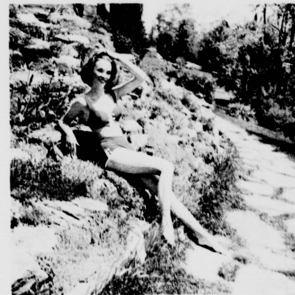
Le Bikini ou le deux-pièces a encore des amateurs. La petite culotte est très serrée aux hanches et le haut bain-de-soleil moule agréablement le buste. Création Peter Pan.

Le soleil et l'eau semblent se combiner sur cet adorable costume de bain blanc et jaune. Fait de tissu élastique, il est agréable à porter. Création Sea Nymph.