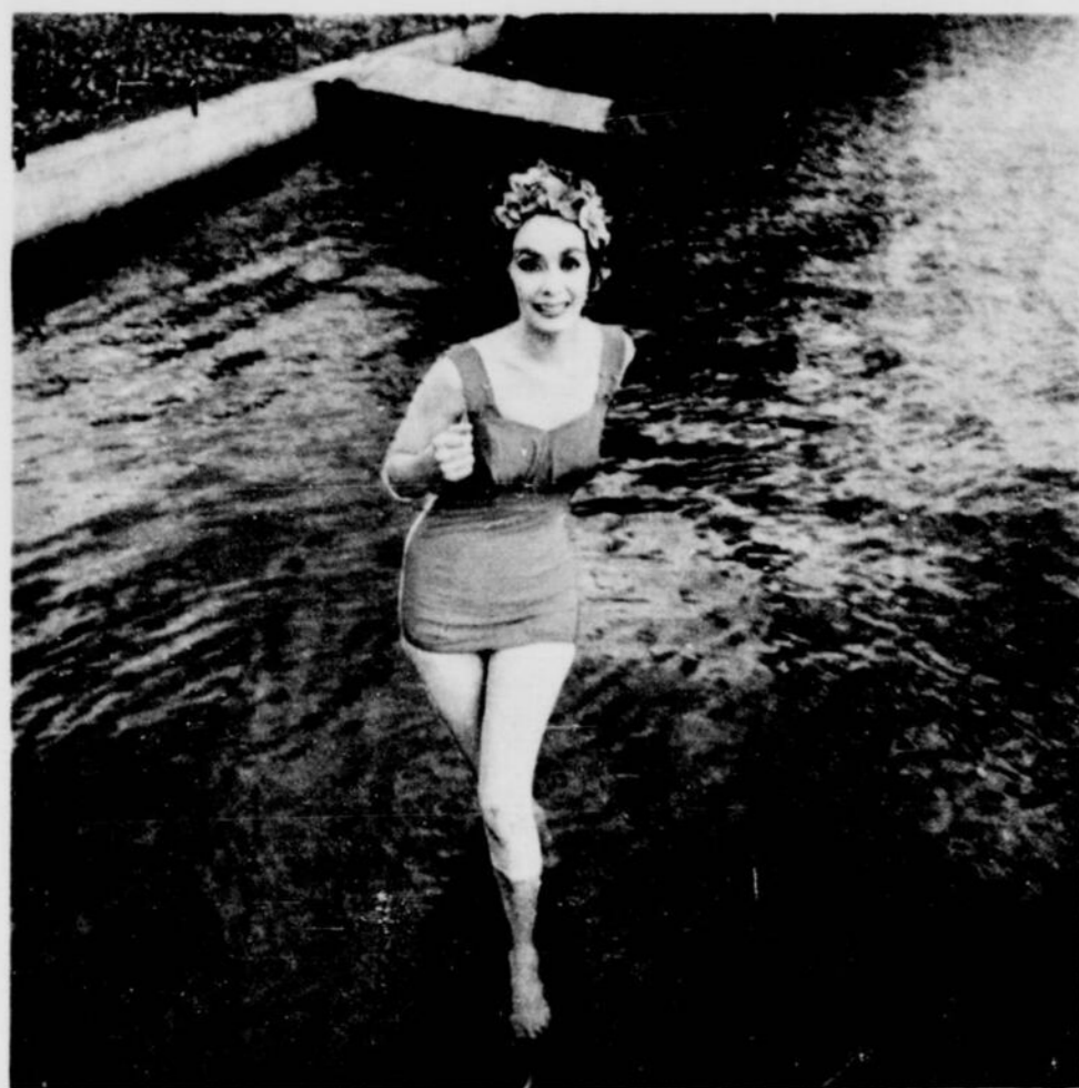
Le costume de bain des vraies sportives. Une pièce, fait de tricot extensible d'un ton ravissant. Un costume de championne ... Modèle Pedigree.

Les nageuses qui aiment le sport de compétition trouvent pratique le costume sans épaulettes. Celui-ci a des détails exquis. Modèle Pedigree.