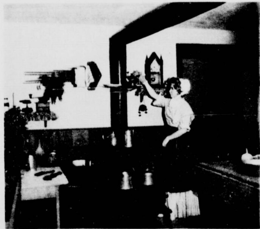
Intérieur d'une des maisons du village de 1784 reconstitué près de Morrisburg, sur les bords du Saint-Laurent. Le premier ministre Leslie M. Frost a présidé à son inauguration le 24 juin. ▷