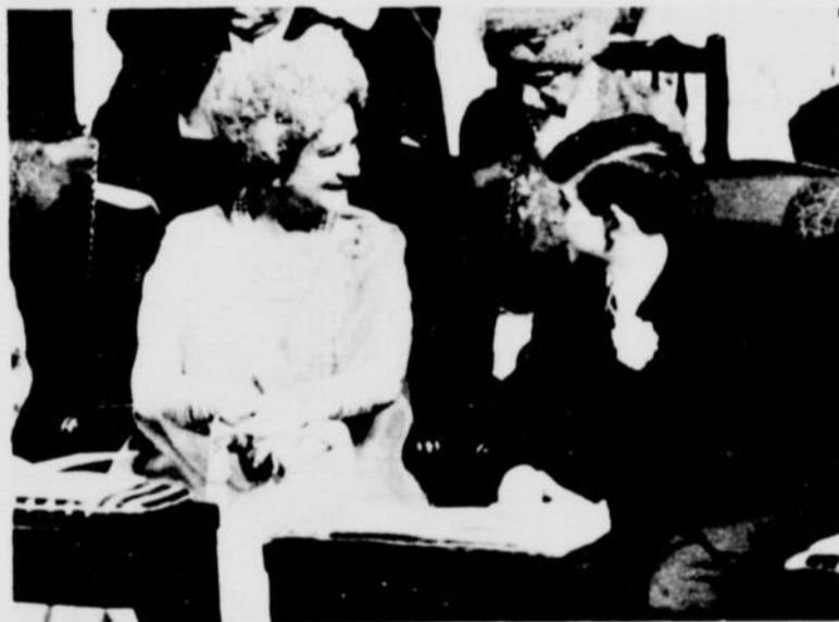
La boutonnière fleurie, le prince Charles, 12 ans, cause avec sa grand-mère, la reine-mère Élisabeth, avant la cérémonie.