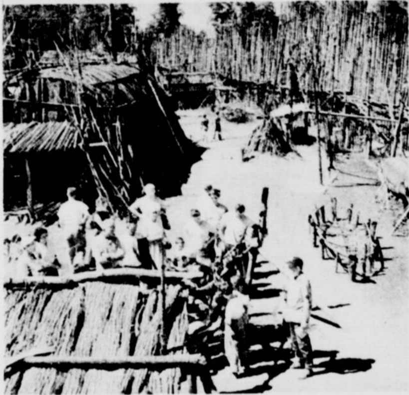
La Huronie, près de Midland, sur la baie Georgienne, contient un grand nombre de sites historiques comme ce village huron de 1640, reconstitué, et le sanctuaire des Saints Martyrs canadiens.