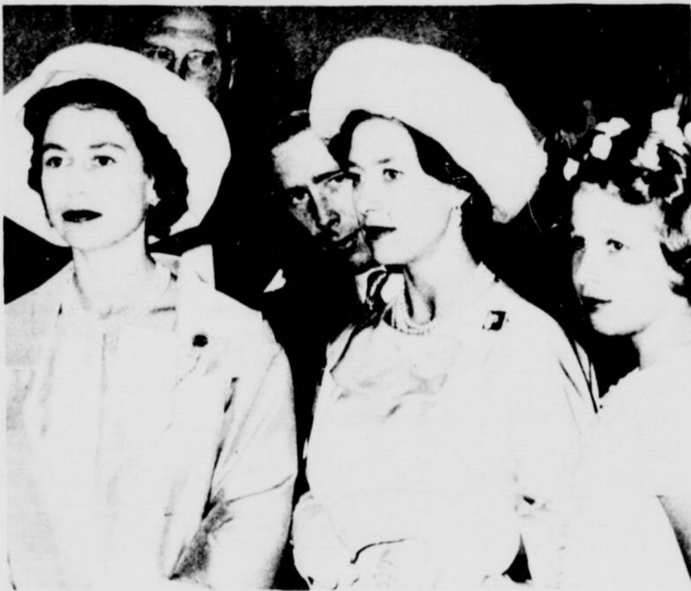
Sa Majesté la reine, la princesse Margaret et la princesse Anne occupent la banquette royale. À l'arrière de la princesse Margaret on aperçoit la figure penchée de son époux, Antony Armstrong-Jones.

Une autre Hainaut, Jacqueline, se sépara de son mari pour épouser le duc de Gloucester, ce qui provoqua l'intervention du duc de Bourgogne, Philippe le Bon, qui battit les troupes de Jacqueline et lui imposa enfin le protectorat bourguignon.