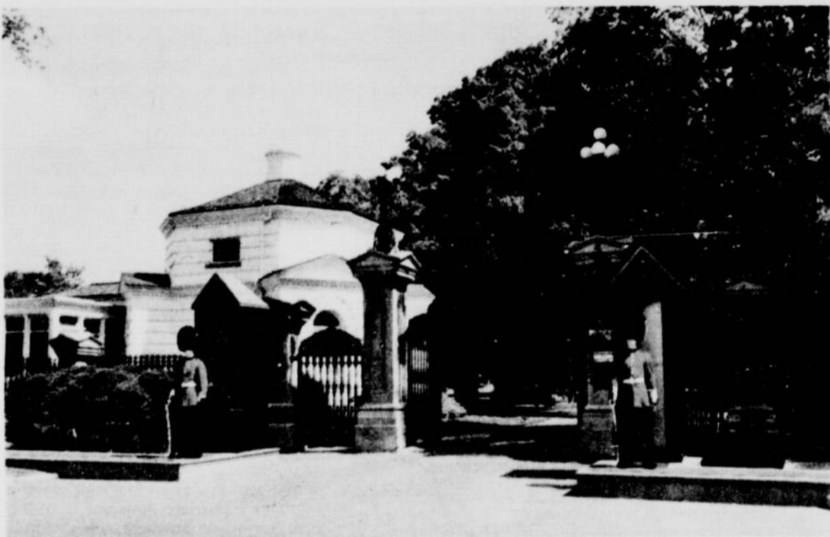
L'entrée de Rideau Hall, résidence du gouverneur général à Ottawa. Des grenadiers à bonnet de poil, armés au poing, y montent la garde comme devant le palais de la reine à Buckingham Palace.

ONTARIO est, après Québec, la plus grande province du Canada. Elle offre, cependant, ceci de particulier qu'elle possède deux capitales, la fédérale, Ottawa, et la provinciale, Toronto. Cette dernière, appelée York de 1793 à 1834, fut la capitale du Haut-Canada il y a plus de 150 ans. A l'époque, le gouverneur Simcoe avait transféré le siège de l'Assemblée de Niagara, plus vulnérable aux attaques de l'ennemi du sud, à York. Toronto fut proclamée capitale de l'Ontario en 1867, année de la confédération. Pendant quelques années elle fut aussi la capitale de tout le pays jusqu'au moment, exactement en 1857, où la reine Victoria choisissait Bytown, au centre du pays, comme nouvelle capitale du Canada.