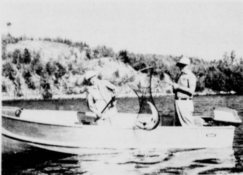
La pêche au grand brochet du nord dans le lac Sabourin. Les pêcheurs ne représentent peut-être pas plus de 27 pour cent des vingt millions de touristes qui visitent l'Ontario chaque année, mais ils ne sont pas les moins enthousiastes.