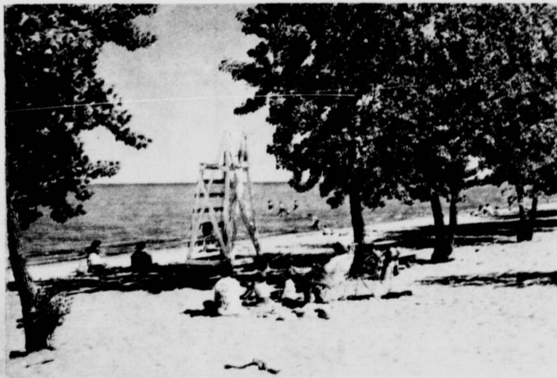
La plage du parc provincial Rondeau, sur les bords du lac Erie.

Le pot de fleur, oeuvre millénaire de l'érosion, dans le parc national près de Tobermory, dans la péninsule de Bruce.