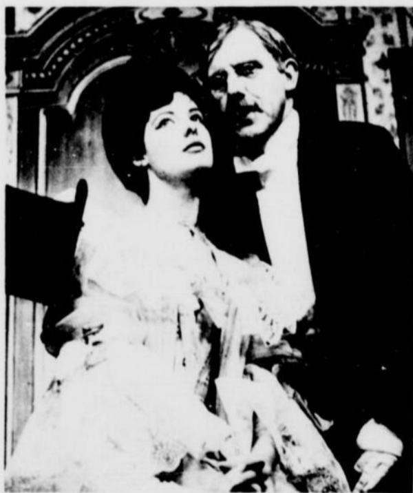
Le Dr Crippen (George Benson) et son épouse, Belle Elmore. Une invention alors toute nouvelle, la télégraphie sans fil, merveille du début du siècle, permit l'arrestation du meurtrier.

Crippen et Ethel furent arrêtés grâce à la télégraphie sans fil, à bord du "Montrose", où ils s'étaient inscrits, Crippen, sous le nom de Robinson, et Ethel déguisée en homme comme étant le fils de ce dernier. L'arrestation provoqua un émoi universel. Une armée de policiers et de journalistes attendaient les accusés à l'arrivée du paquebot à la Pointe-au-Père. Internés dans la prison de Québec puis extradés, Crippen et Ethel subirent leur procès au Old Bailey de Londres, le 18 octobre 1910. Il fut établi que Crippen, outre les autres preuves accablantes qui pesaient contre lui, était en difficulté financière et que son épouse possédait un petit capital. Ethel fut accusée de complicité après le fait mais acquittée. Crippen fut pendu dans la prison de Pentonville le 23 novembre 1910, sans faire d'aveux et en protestant de l'innocence de sa compagne. L'histoire du procès fut publiée en 1920 par Filson Young. Elle est maintenant reconstituée par le "musical" de Mankowitz et Norman sous le titre de "Belle ou la ballade du Docteur Crippen", sur le ton de la complainte.