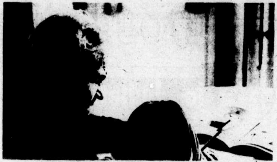
LA BIBLIOTHEQUE SCOLAIRE

La bibliothèque est l'endroit qui devrait aider l'enfant à diversifier sa culture et à exploiter ses talents de créativité, de recherche et de lecture. Une organisation scientifique selon un système de la bibliothécaire assure un usage efficace de la bibliothèque. Enfin une animation pédagogique portant sur l'emploi des techniques Audio-Visuelles de même que sur la méthodologie du travail aura un effet semblable.