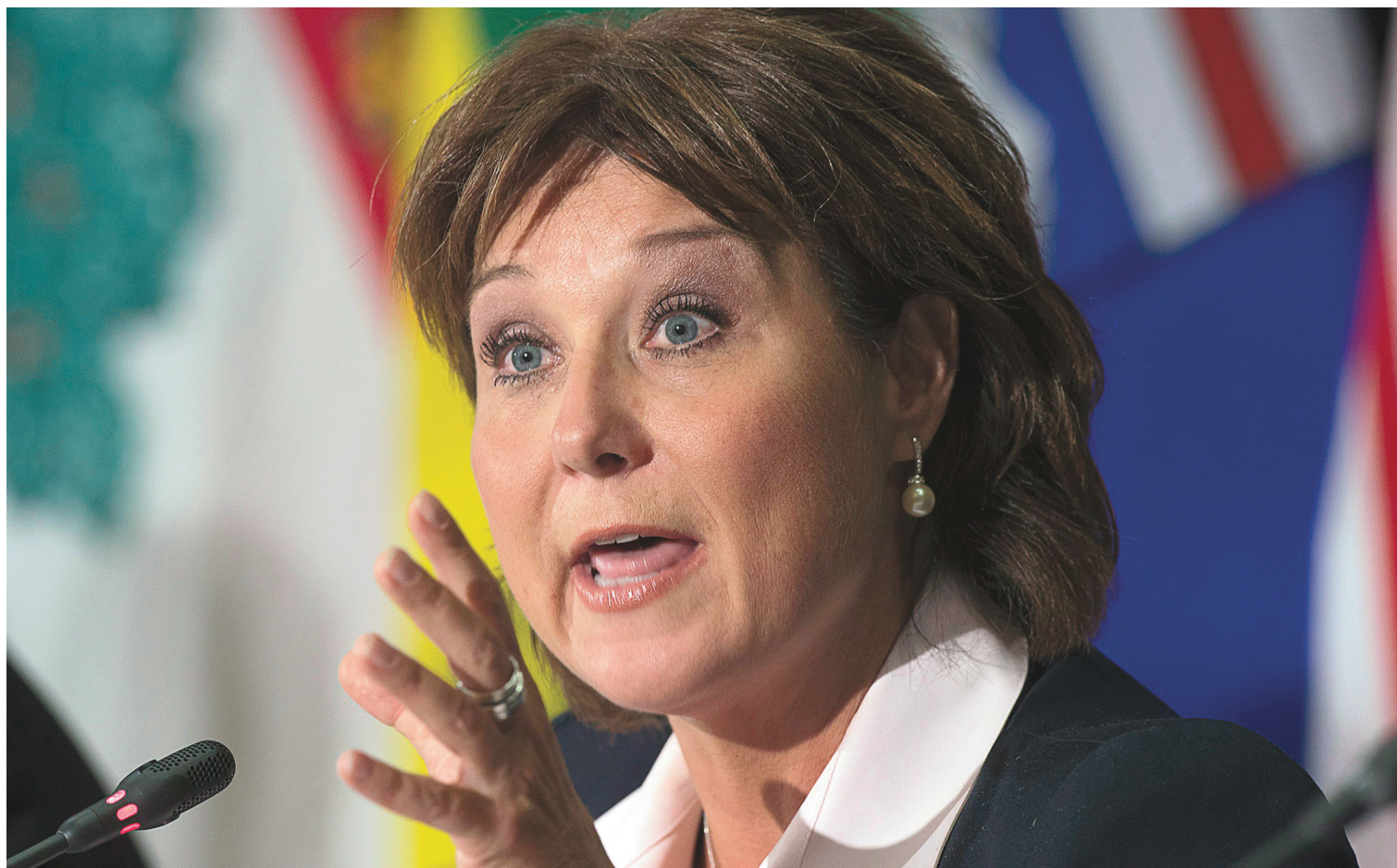
ANDREW VAUGHAN LA PRESSE CANADIENNE

Les Canadiens — y compris les Québécois — sont las des débats constitutionnels, estime la première ministre de Colombie-Britannique.