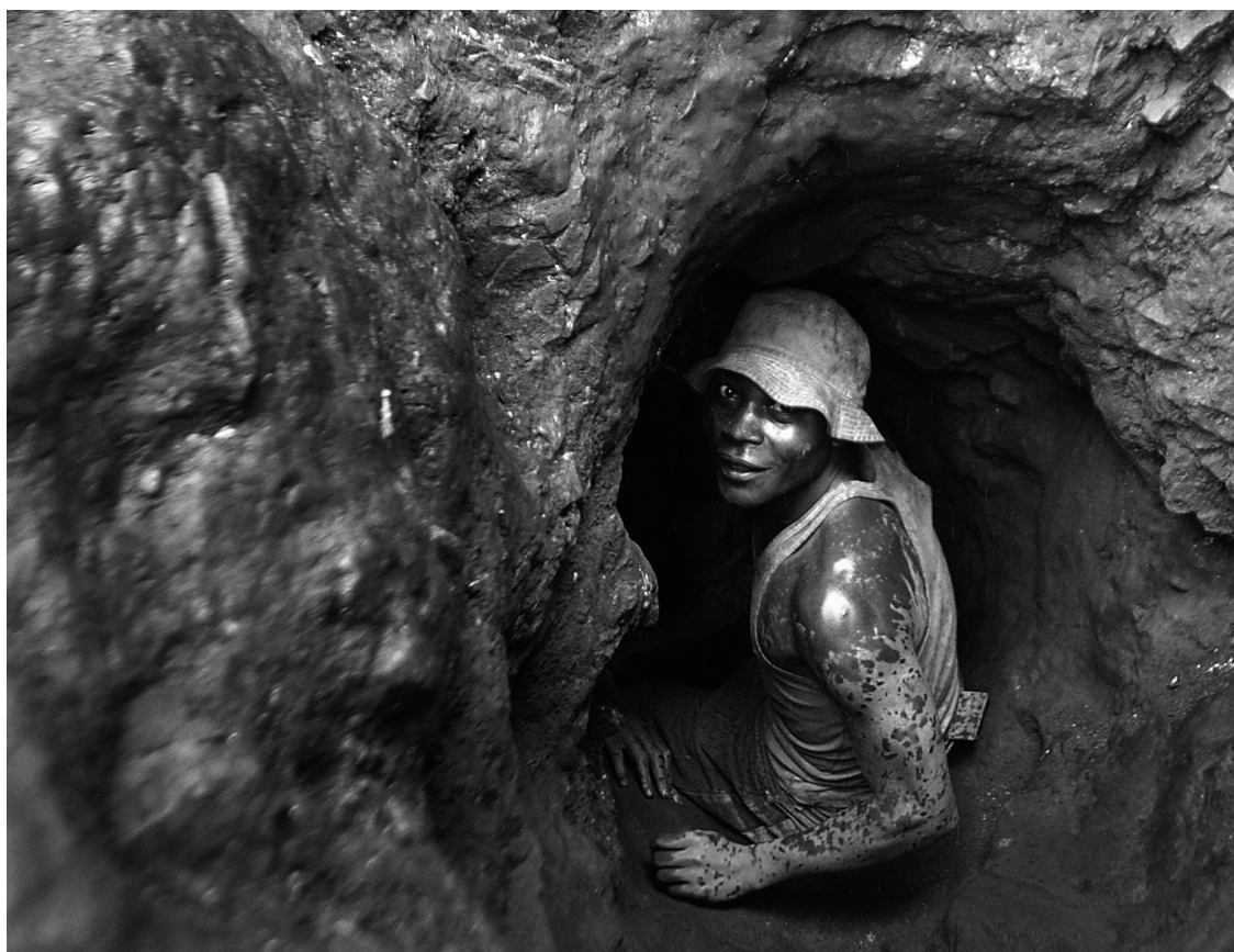
Un travailleur dans une mine de cobalt au Congo