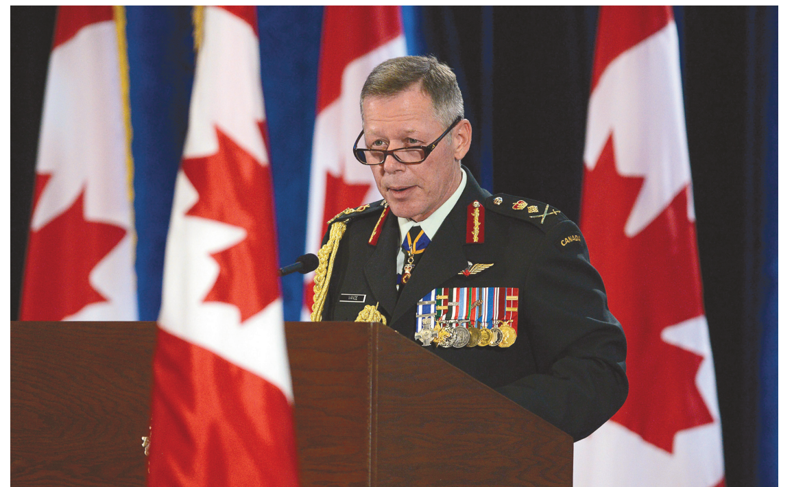
Les Forces canadiennes ont un nouveau grand patron. Le chef d'état-major de la Défense, Jonathan Vance, a été assermenté à Ottawa vendredi.

Le gouvernement Harper risque toutefois d'être questionné également sur son bilan sur le financement de la Défense nationale. Le prédécesseur de