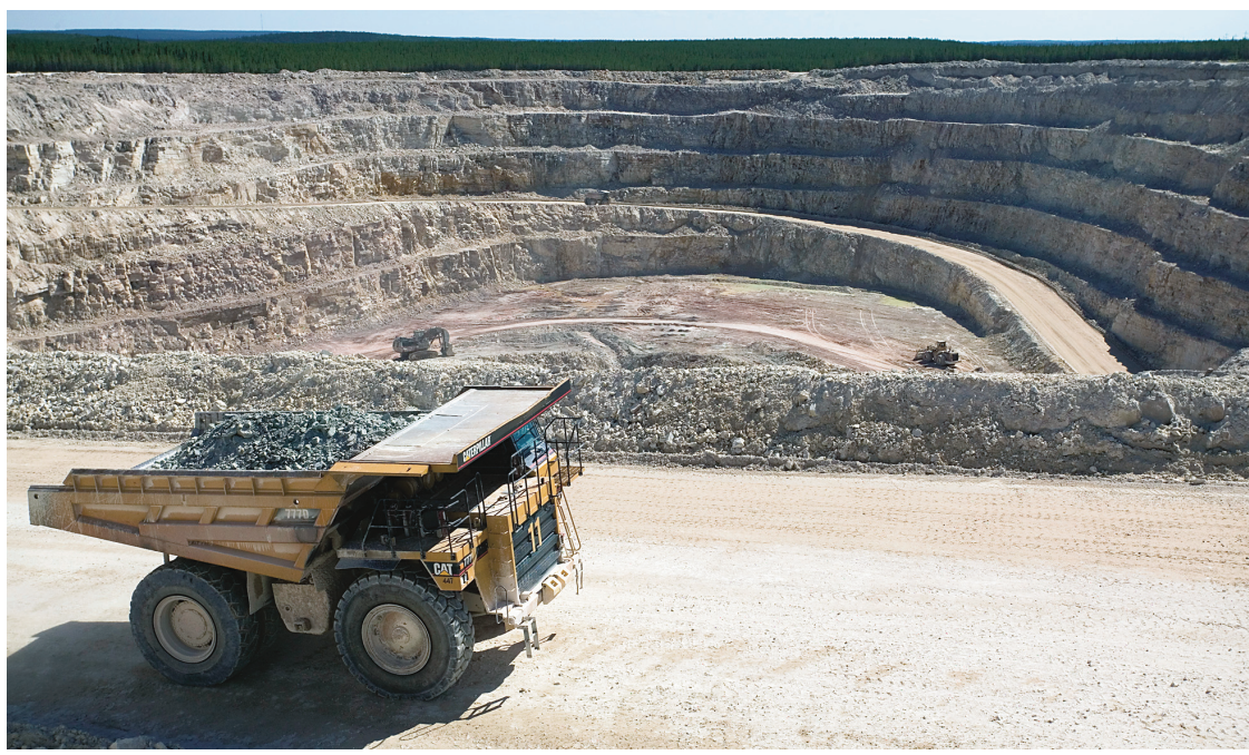
Il existe près d'une trentaine de projets d'exploration uranifère au Québec. Ci-dessus, un camion sortant de la mine d'uranium de MacClean Lake, en Saskatchewan.

Ces incertitudes, déjà mises en lumière par l'Institut national de santé publique, contribuent à alimenter le manque d'acceptabilité sociale. Qui plus est, «dans certains milieux, la présence ou la perspective de développement de mines uranifères risquent d'être associées à une détérioration du climat social et à une perte de confiance des citoyens envers les autorités». Cela est particulièrement vrai dans les communautés nordiques. Il faut dire que celles-ci seraient directement exposées aux risques, «alors que les profits seraient partagés entre des intérêts privés et répartis sur l'ensemble de la population québécoise et que les productions seraient desti-