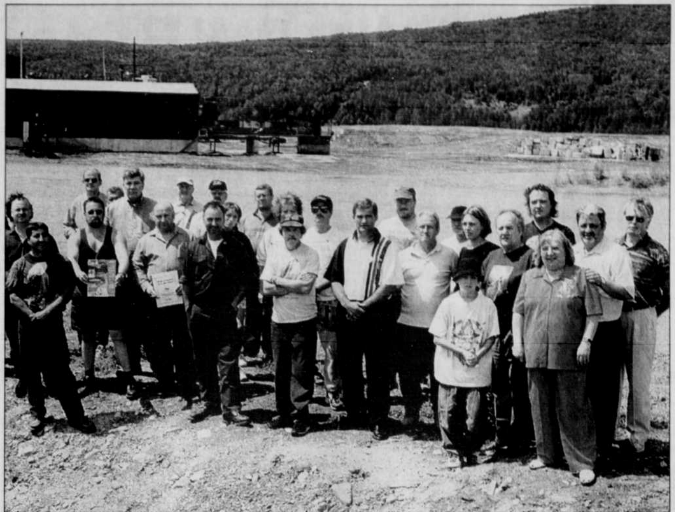
Les manifestants devant la scierie Bois Cépédia, du Groupe Cédrico, fermée il y a deux semaines.

Les élections auront lieu les 18 et 25 novembre