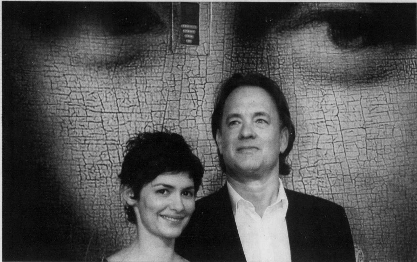
Audrey Tautou et Tom Hanks, vedettes du film américain Da Vinci Code, posent en gare de Cannes devant un TGV Eurostar spécialement décoré aux couleurs du film, après leur arrivée en provenance de la gare de Waterloo, à Londres. Ce TGV, rebaptisé pour l'occasion The Da Vinci Code, a établi hier le record mondial de la plus longue liaison ferroviaire internationale sans escale (1421 km).