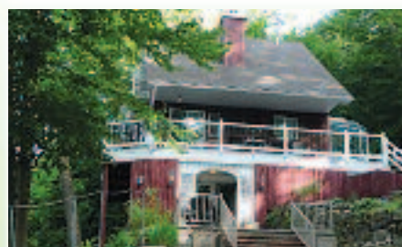
ACCÈS NOT. AU LAC ÉCHO – Superbe vue sur l'eau! Accès au lac en face de la maison. Aire ouverte. Comb. lente. Solarium 4 saisons. À 15 min. de Saint-Sauveur! MLS 23172200. 372 000 $