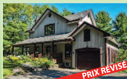
VENDEUR TRÈS MOTIVÉ! - Bord Lac Bleu. Cottage ent. rénoveré! Aire ouv. avec vue sur l'eau. 3 CAC, 2 BUR, 4 SDB. S.-sol fini. =Garage. Ter. plat. MLS 9460412. 499 000 $