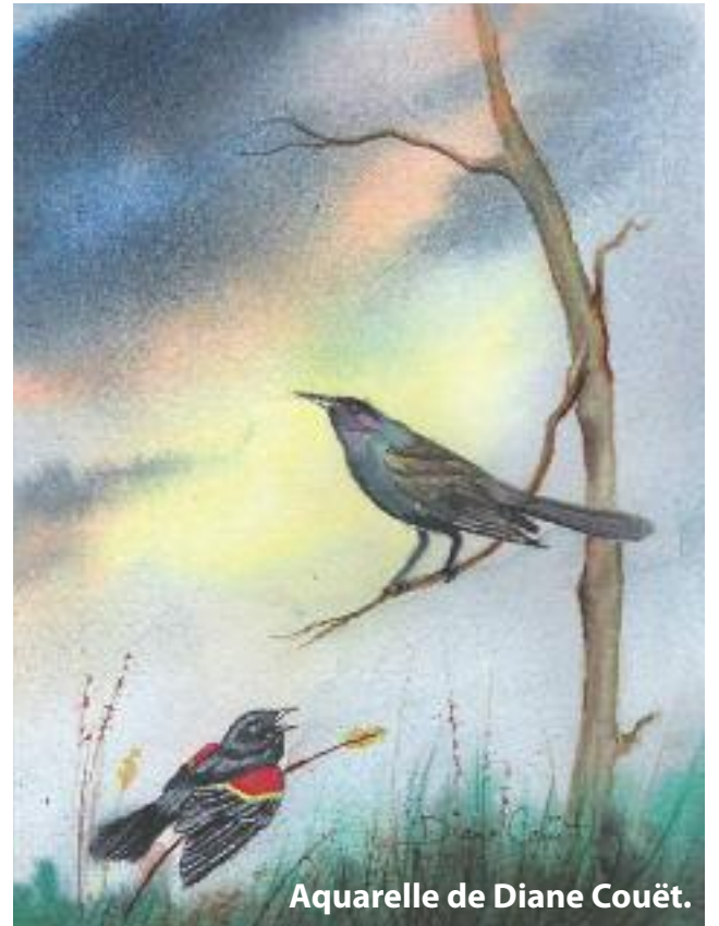
Aquarelle de Diane Couët.

La nature suit ses rythmes ancestraux, ses cycles saisonniers. Il me semble aller mieux lorsque je m'attarde à elle, lorsque je me laisse guider le long du chemin à la recherche d'indices de changements. Oui, la glace fondra, les érables couleront, les ruisseaux dégèleront, les marmottes reviendront à la surface. Toute cette effervescence a de quoi