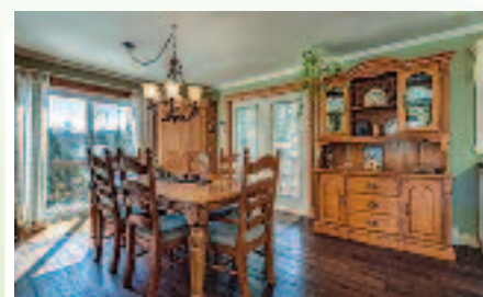
BORD LAC MAILLÉ – Propriété rénoverée. Aire ouverte. 3 ch. à coucher. 2 s. de bains, piscine hors-terre. Vue sur l'eau. À 8 min. de Saint-Jérôme. MLS 15971973. 259 900 $