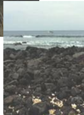
Plage de lave.

Sur la côte est, arrosée plus qu'abondamment grâce aux alizés, la végétation est luxuriante. La forêt pluviale spectaculaire, dense, est incroyable avec ses fourgères arborescentes, ses ruisseaux et ses rivières ainsi que ses chutes magnifiques. La présence des pluies fait toute la différence entre la côte ouest et la côte est, car l'eau en s'infiltrant dans les fissures de lave permet l'apparition de la végétation. En effet, la lave hawaïenne ne favorise pas une vie prospère contrairement aux cendres volcaniques de certains volcans. La lave y est dure, et cimente le sol soit avec