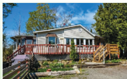
SECT. LAC CONNELLY – Coquet plain-pied rénoveré. 2 CAC. Décoration int. chaleureuse. Véranda 3 saisons. Vue sur le lac. À 5 min. des princ. services. MLS 19003735. 157 000 $