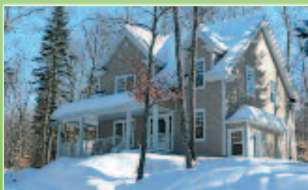
LAC DE L'ACHIGAN – Cottage champêtre 2009. Accès au lac de l'Achigan. 3 ch. à l'étage. 2 salles de bains. Foyer. Ter. : 44 800 p.c. MLS 10807107. 345 000 $