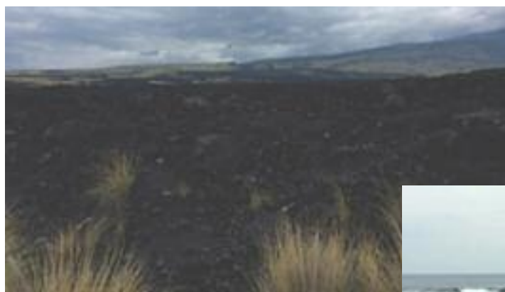
Paysage de coulée de lave avec les graminées sur la côte de Kona, coulée remontant à la fin du 19 e siècle.

Les volcans sont à l'origine de ces îles. Sous l'océan, la croûte terrestre est plus mince (10 km et moins). Ainsi depuis 70 millions d'années, le magma s'est infiltré dans les fissures et s'est figé au contact des eaux du Pacifique. À force d'accumulations de couches de lave sont nés des montagnes sous-océaniques et l'archipel hawaïen.