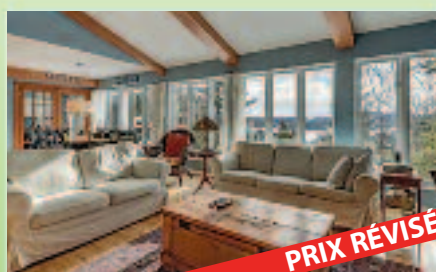
VUE! VUE! VUE! – Vue panoramique! Cottage impeccable! 4 CAC, solarium, foyer, 2 SDB. Piscine hors-terre. MLS 12584393. 399 000 $