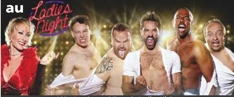
L'équipe de comédiens de Ladies Night .