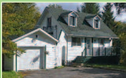
BORD LAC DES SOURCES – 80' bord de l'eau. 2 CAC, 2 s./bains, foyer, s.-sol, garage. Occupation immédiate. Vendu meublé. MLS 15599570. 195 000 $.