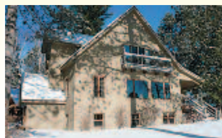
DOMAINE DE 6,9 ACRES! – Véritable havre de paix longé sur 862' par la riv. Pashby! Ter. privé + maison d'invité des plus champêtres! MLS 20063917. 449 000 $