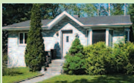
187' BORD RIV. PASHBY – Sect. lac de l'Achigan. Pl.-pied. 2 CAC + 1 BUR, 2 SDB. S.-sol fini. Ter. plat. Peut accéder au lac par canot, chaloupe, kayak seulement. MLS 15953294. 162 000 $