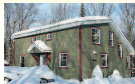
ACCÈS NOT. LAC EN CŒUR – À 2 min. à pied de l'eau. Propriété entièrement rénoverée. Comb. lente. 2 CAC. Ter. : 39 918 p.c., privé. MLS 14191723. 199 900 $