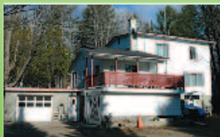
ACCÈS NOT. LAC DE L'ACHIGAN – Très grande propr. avec 5 CAC et 1 BUR., 2 SDB. Patio, 2 garages. 1 remise. MLS 21944959. 179 500 $