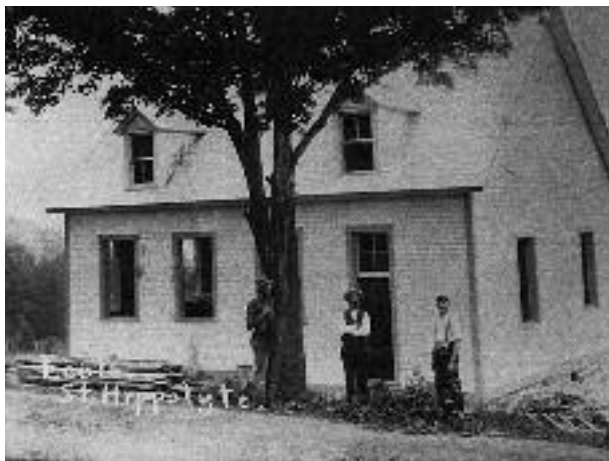
École no.1 au village de Saint-Hippolyte, en construction en 1912 et démolie en 1958. Elle occupait l'emplacement du poste d'essence actuel.

L'histoire de la création des sept écoles de rang de 1871 à 1962 de la municipalité de Saint-Hippolyte, sur un vaste territoire laurentien (132 km 2 ) 1 , témoigne de l'importance d'offrir une éducation, des valeurs intellectuelles et religieuses, malgré les défis économiques que cela pouvait représenter pour les familles fondatrices.