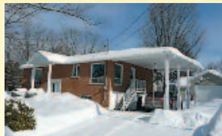
ACCÈS LAC MAILLÉ – Pl.-pied, 3 CAC + BUR. Sous-sol avec comb. lente. Garage détaché et remise. À 2 min. des services et 10 min. de Saint-Jérôme. MLS 25340529. 199 000 $