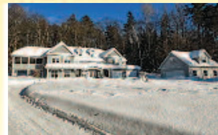
LAC DE L'ACHIGAN – Propriété avec vue impréable face au lac. Ter. de 74 016 p.c. avec 1938 p.c. bord de l'eau. Privé. Plage de sable. Sud-ouest. MLS 18930371. 1 075 000 $