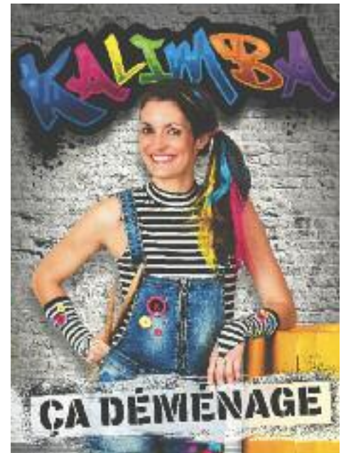
... au Théâtre Gilles-Vigneault.

Pour vous procurer des billets pour le spectacle du 25 mars qui s'adresse aux jeunes de 4 à 12 ans, cliquez http://theatregillesvigneault.com/calendrier/kalimba/ .