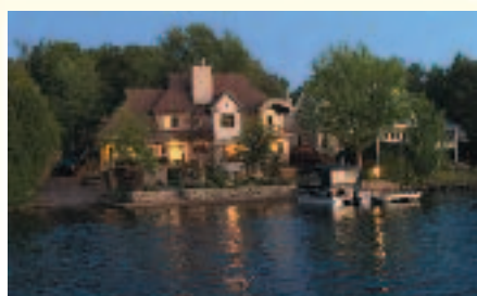
BORD LAC CONNELLY – Superbe propriété bord lac motorisé. Vue panoramique! Entièrement rénoverée en 2008. Pièces spacieuses. Ter. paysager. 50 min. de Mtl. MLS 17524139. 984 000 $