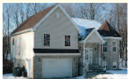
SAINT-HIPPOLYTE – Propriété 2003, 4 CAC, 2 s./bains. Garage adjacent. À 1 min. de tous les services, 10 min. de Saint-Jérôme. 299 000 $