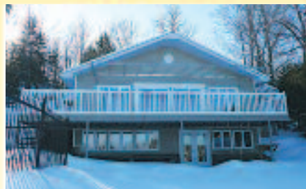
BORD LAC BLEU (navig.) – Vue panoramique! Pleine fenestration avec galerie et auvent face au lac. 3 CAC. S.-sol (rez-de-jardin). MLS 11779288. 399 000 $