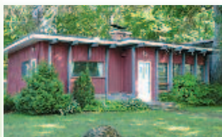
SECTEUR LAC CONNELLY – Plain-pied, 3 CAC, foyer au bois, vue sur l'eau. Ter. : 7961 p.c. Rue paisible. MLS 10465440. 109 000 $