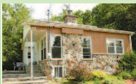
SAINT-HIPPOLYTE – Maison de 3 CAC, foyer au bois. Secteur paisible avec forêt invitante! MLS 23106420. 158 000 $