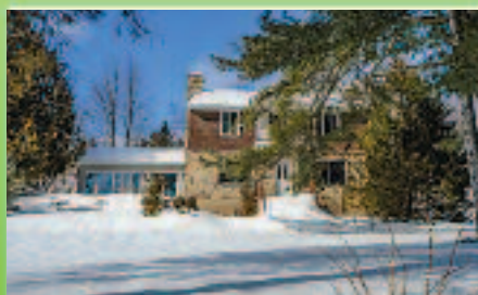
SECTEUR LAC CONNELLY – Belle propriété d'antan! Habillée de pierre autant à l'intérieur qu'à l'ext. 3 CAC + BUR. 2 foyers. Chaleureuse. Ter. : 36 360 p.c. MLS 15518554. 245 000 $