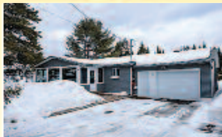
ACCÈS LAC ACHIGAN – Coquette maison de 3 CAC. Foyer en pierre. Grande véranda lumineuse. SDB rénoverée au goût du jour. Garage. MLS 24888825. 144 900 $