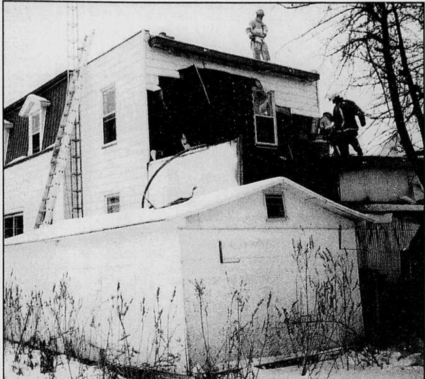
Grâce à la prompt intervention des pompiers de Magog, les flammes qui menaçaient de détruire un immeuble de la rue Hall abritant trois logements ont pu être contenues dans le hangar où elles avaient pris naissance.

Elle entend d'ailleurs remettre sa démission une demi-heure avant la nouvelle assemblée et se représenter aussitôt aux élections. La CoopTel dessert des abonnés de plusieurs municipalités environnantes de Valcourt, notamment Bonsecours, Lac Bowker, Maricourt, Racine, Stukely-Sud et Durham-Sud.