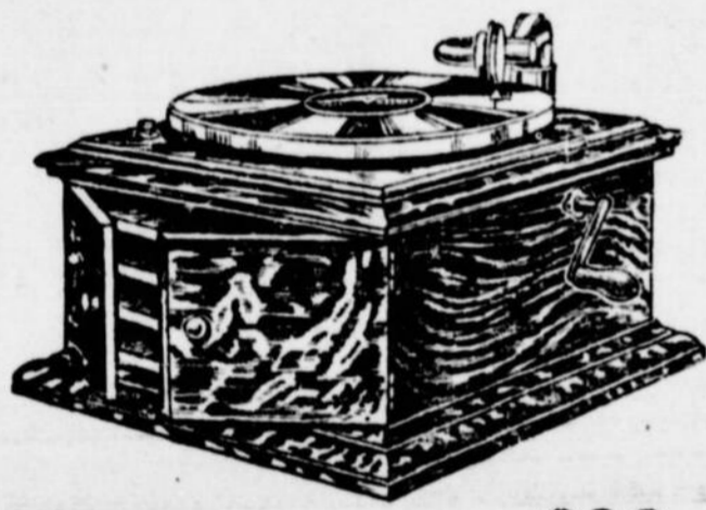
VICTROLA IV $20

"Je vous le dis, Pierre, Paul ou Jacques et les autres n'ont plus le pas sur moi. Ils ne peuvent plus se vanter devant moi de leurs Victrolas et de leur choix de records, parce que j'en ai d'aussi beaux qu'eux.