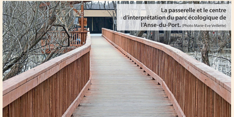
La passerelle et le centre d'interprétation du parc écologique de l'Anse-du-Port.