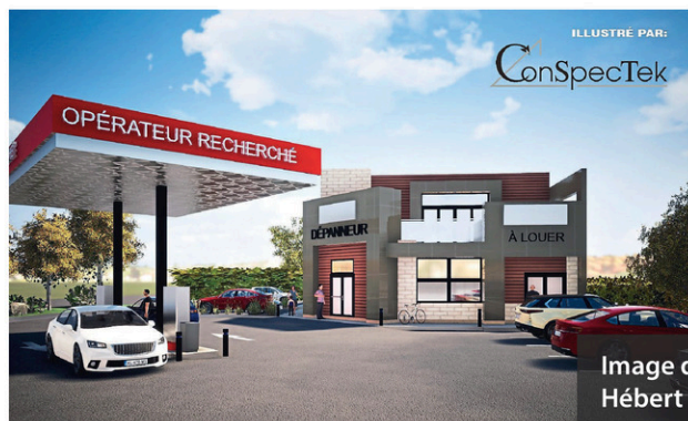
Image du projet qui prendra place au coin des rues Principale et Hébert (8 e rang) à Saint-Wenceslas.