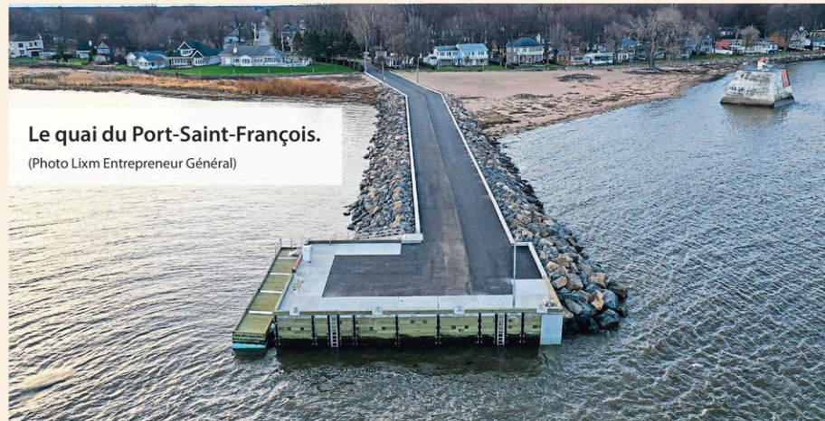
Le quai du Port-Saint-François.