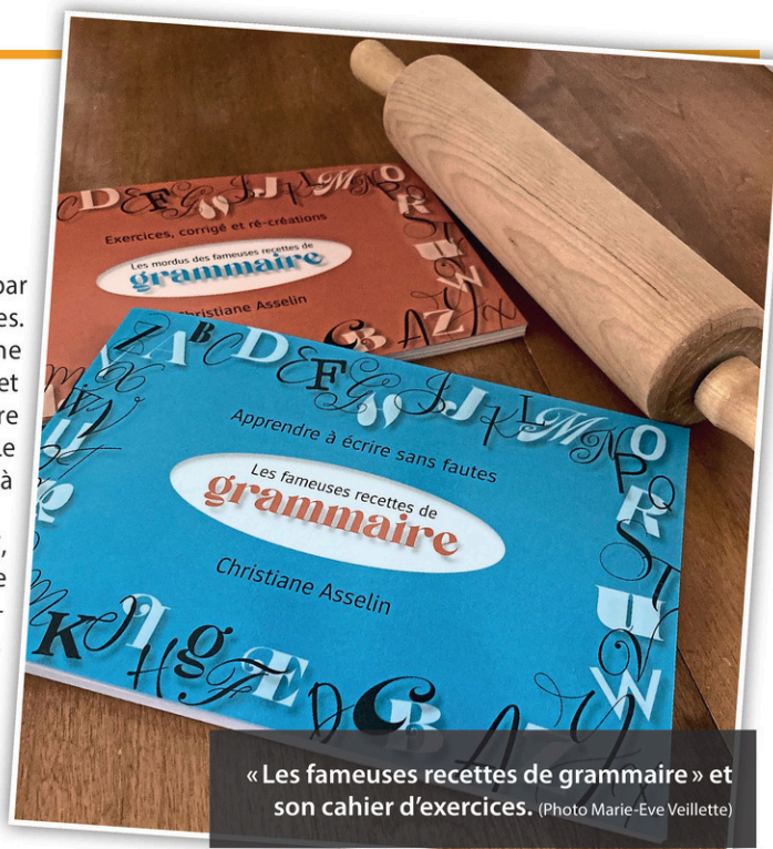
«Les fameuses recettes de grammaire» et son cahier d'exercices.

Un cahier d'exercices est également offert aux chefs en herbe qui souhaitent améliorer leurs techniques. Tout comme la grammaire, il est offert en librairie ainsi que sur le site web des Pelleteurs de nuages.