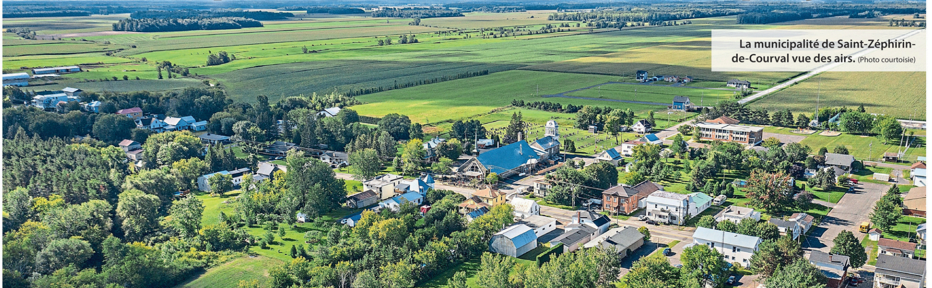
La municipalité de Saint-Zéphirin-de-Courval vue des airs.

MARIE-EVE VEILLETTE meveillette@icimedias.ca