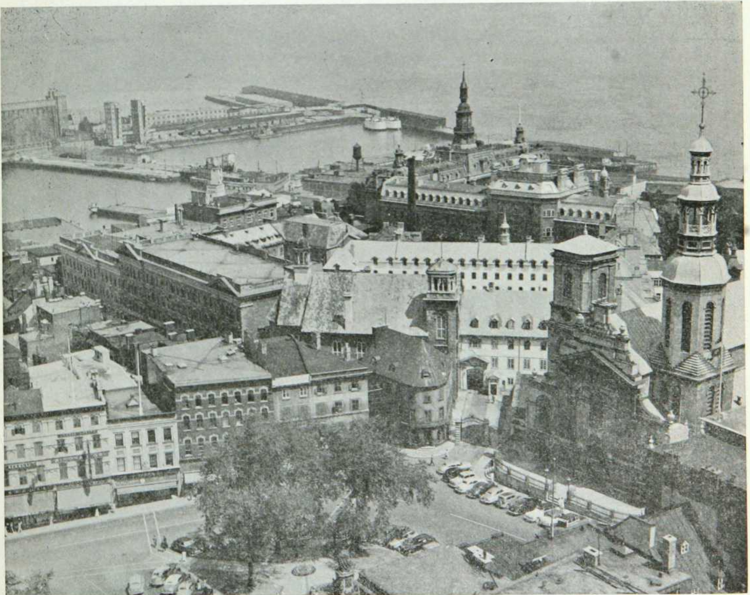
UNE PARTIE DU VIEUX QUEBEC

Quebec City, the population of which exceeds 175,000, will attain in the relatively near future, according to the present rate of increase, 200,000.