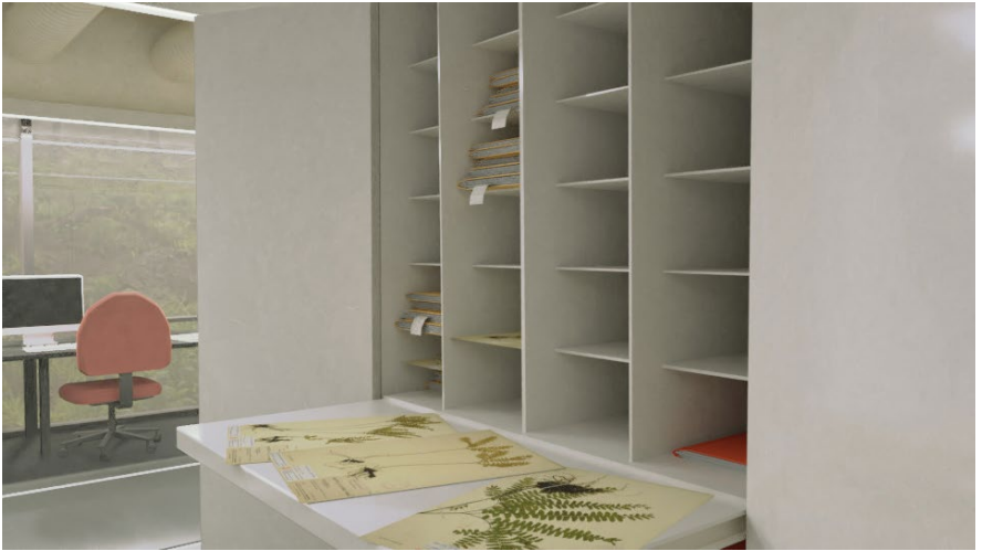
Mirement/L'herbier - Towing/The Herbarium (2021)

Images tirées de l'œuvre de réalité virtuelle Images from the virtual reality work