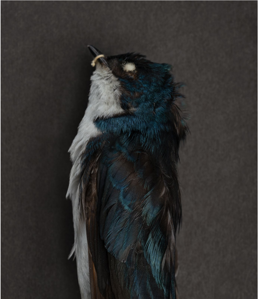
Mirement/Trissemments – Towering/Trissemments Monstres – Hirondelle bicoloré (2022)

Impression jet d'encre sur papier baryté, 56 x 48,5 cm Inkjet print on baryta paper, 56 x 48.5 cm