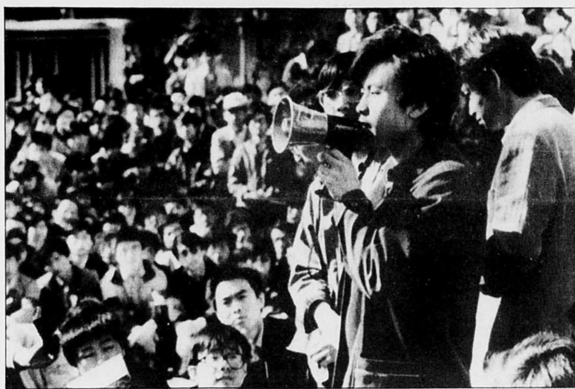
Les étudiants de plusieurs universités de Pékin refusent de mettre fin, à la demande du gouvernement, à leur campagne en faveur d'une réforme politique.