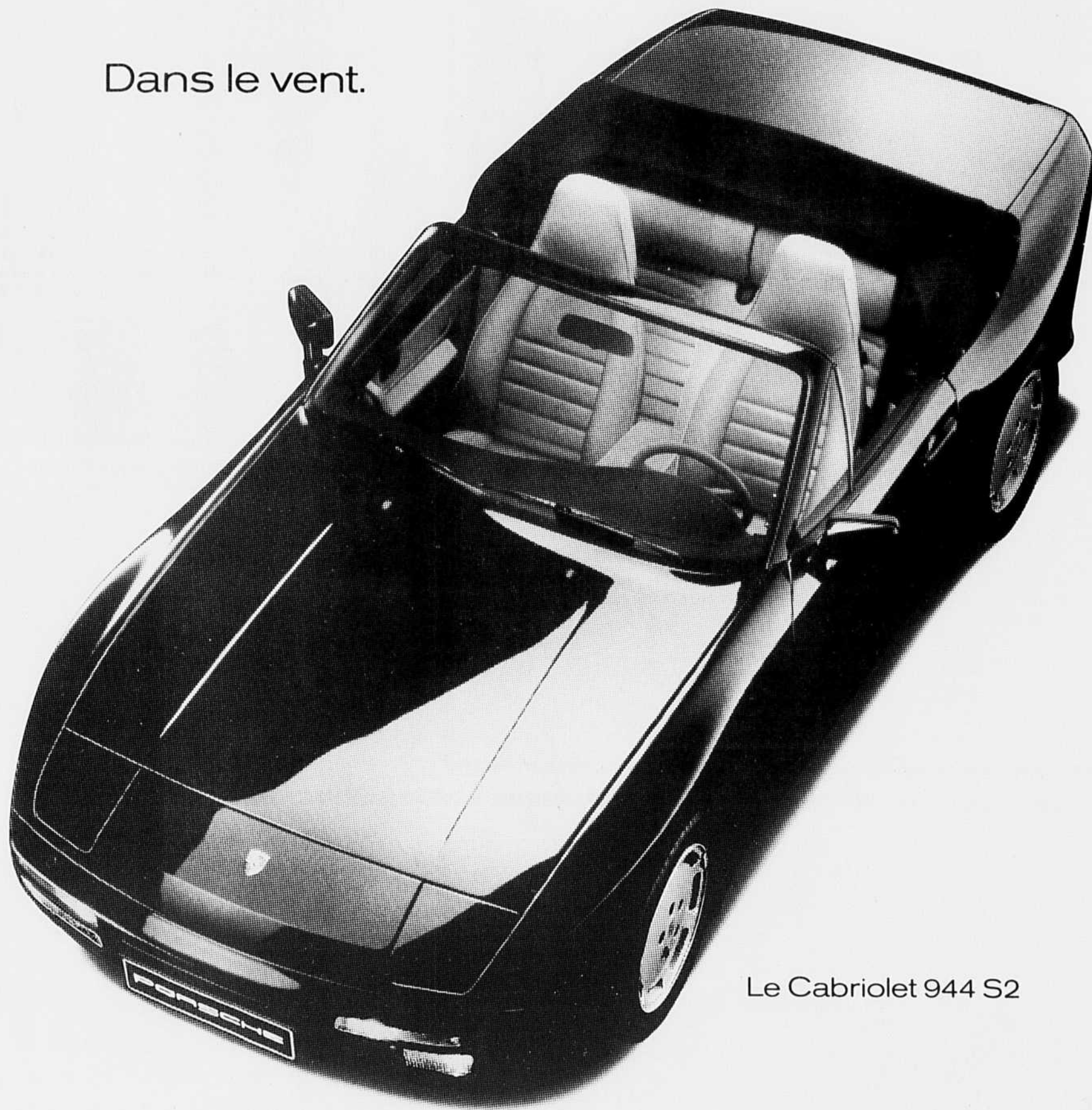
Le Cabriolet 944 S2