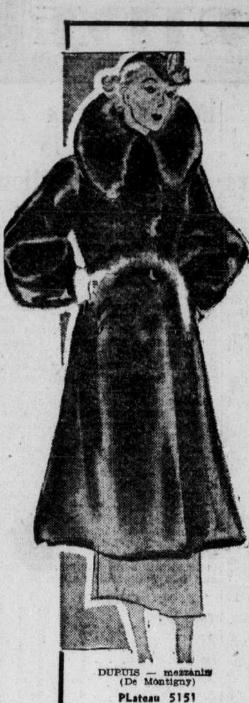
DUPUIS - mazzanin (De Montigny) Plateau 5151

Notre politique, vous le savez, c'est une politique agricole du premier article au dernier de notre programme. Nos adversaires disent que ce programme est irréalisable parce qu'il est trop beau. Mais, cultivateurs de Deux-Montagnes, est-ce que je vous ai trompés dans le passé? Est-ce que, comme ministre de l'Agriculture, j'ai négligé une