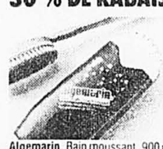
Algemarin. Bain moussant, 900 ml. Ord. 36,50 Solde 24,99 ch. Prime: à l'achat de ce produit, vous recevrez, sans frais, une brosse pour le bain (valeur de 8,99). Tant qu'il y en aura!