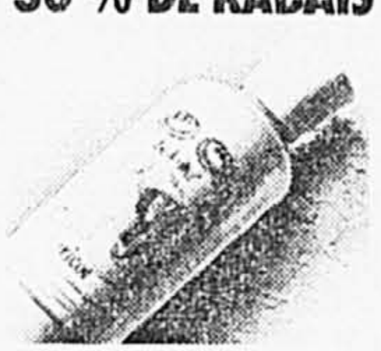
Belmira. Bain moussant, 500 ml. Pomme verte, citron, mandarine, etc. Après lancement 8,75 Solde 5,99 ch.