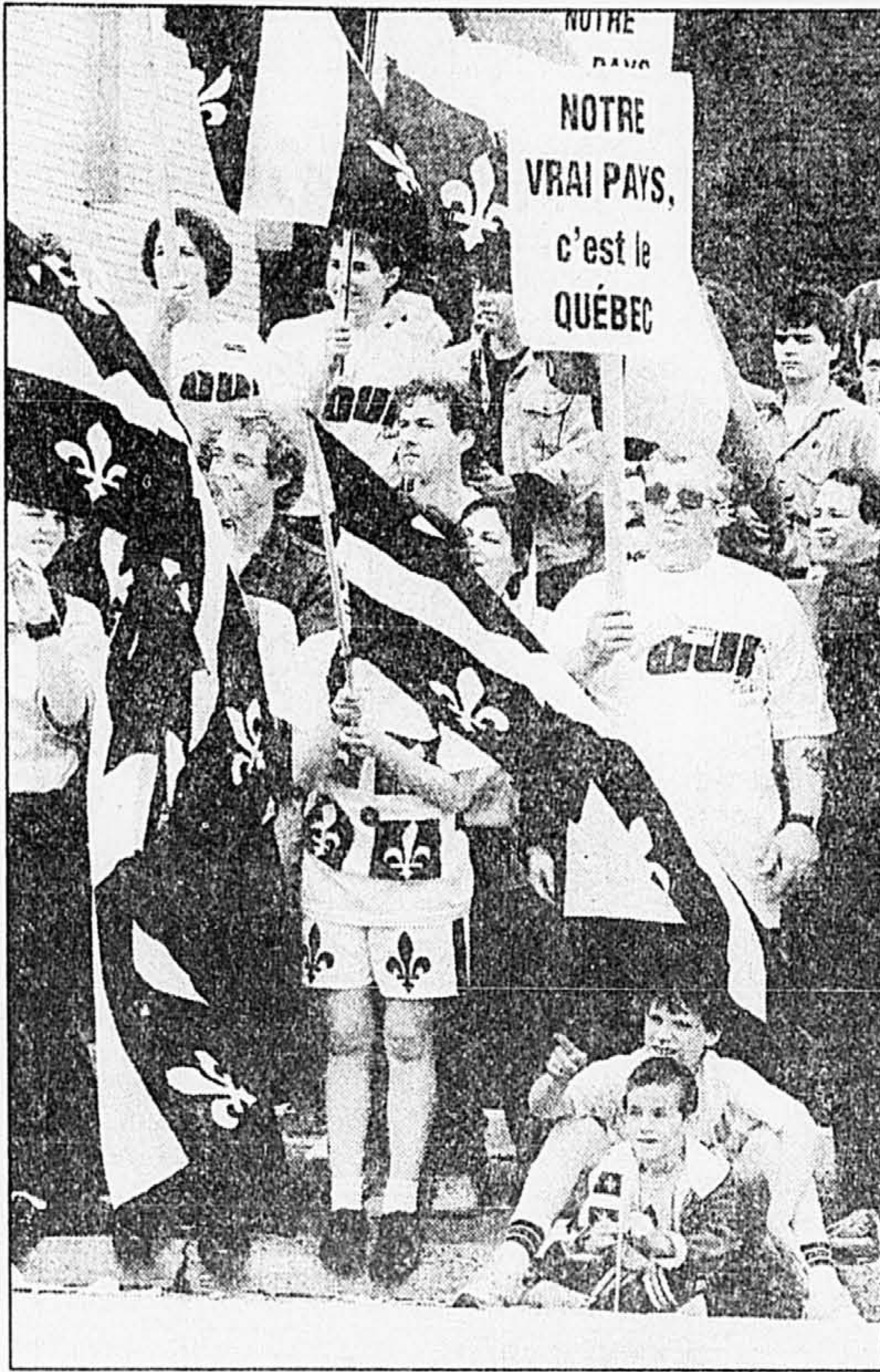
Parmi les drapeaux déployés, de nombreux participants au défilé brandissaient une pancarte à saveur politique.