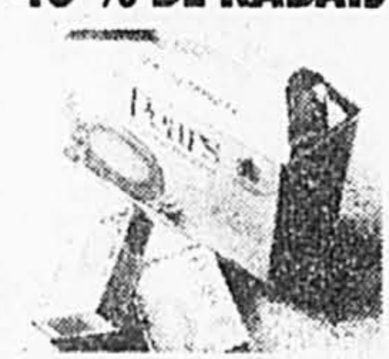
Pears. Boîte contenant 12 pains de savon de 75 g. Ord. 16,68 Solde 9,99 ch.