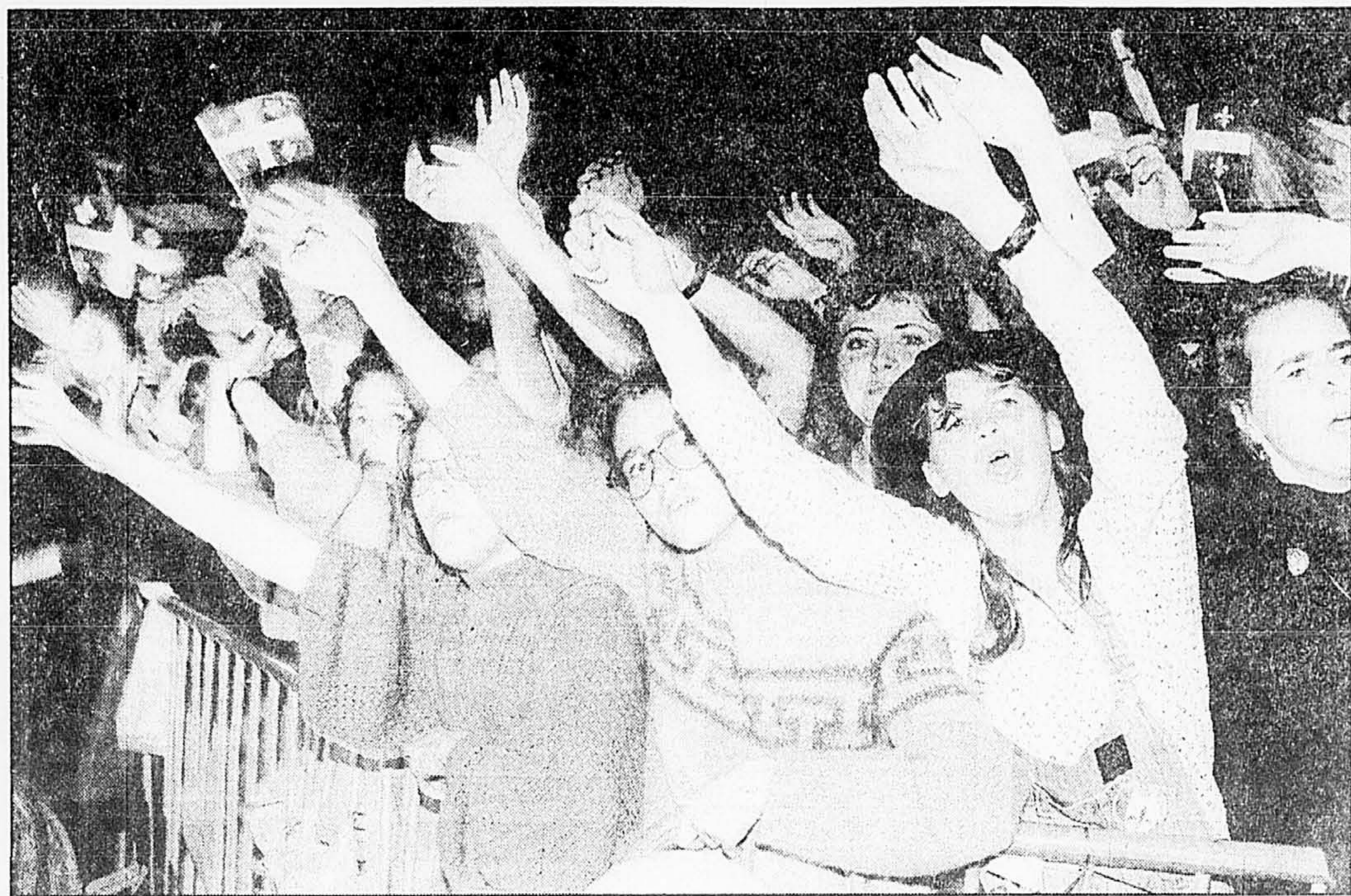
202 000 mains ont fait la vague...

La foule de l'île Sainte-Hélène était venue faire le pont avec la Saint-Jean de 1976