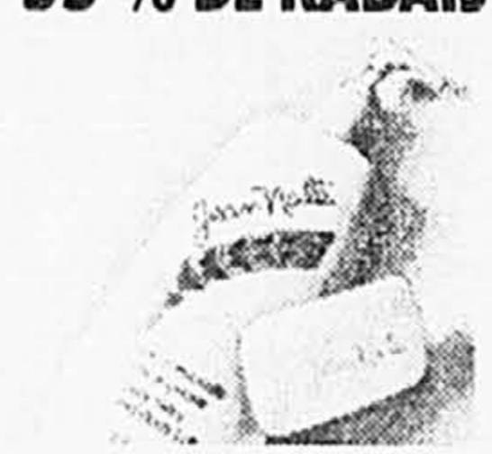
Jean Naté. Lotion pour les mains et le corps. 500 ml. 5,99 ch. (Valeur de 17 $) Pain de savon, 80 g. Ord. 1,95 Solde 79 c ch.