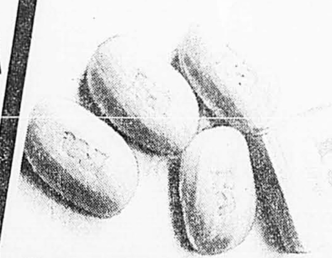
SAVONS FA Paquet de 12 savons Fa de 80 g. 8,88 ch. (Valeur de 14,28). Tant qu'il y en aura! 888