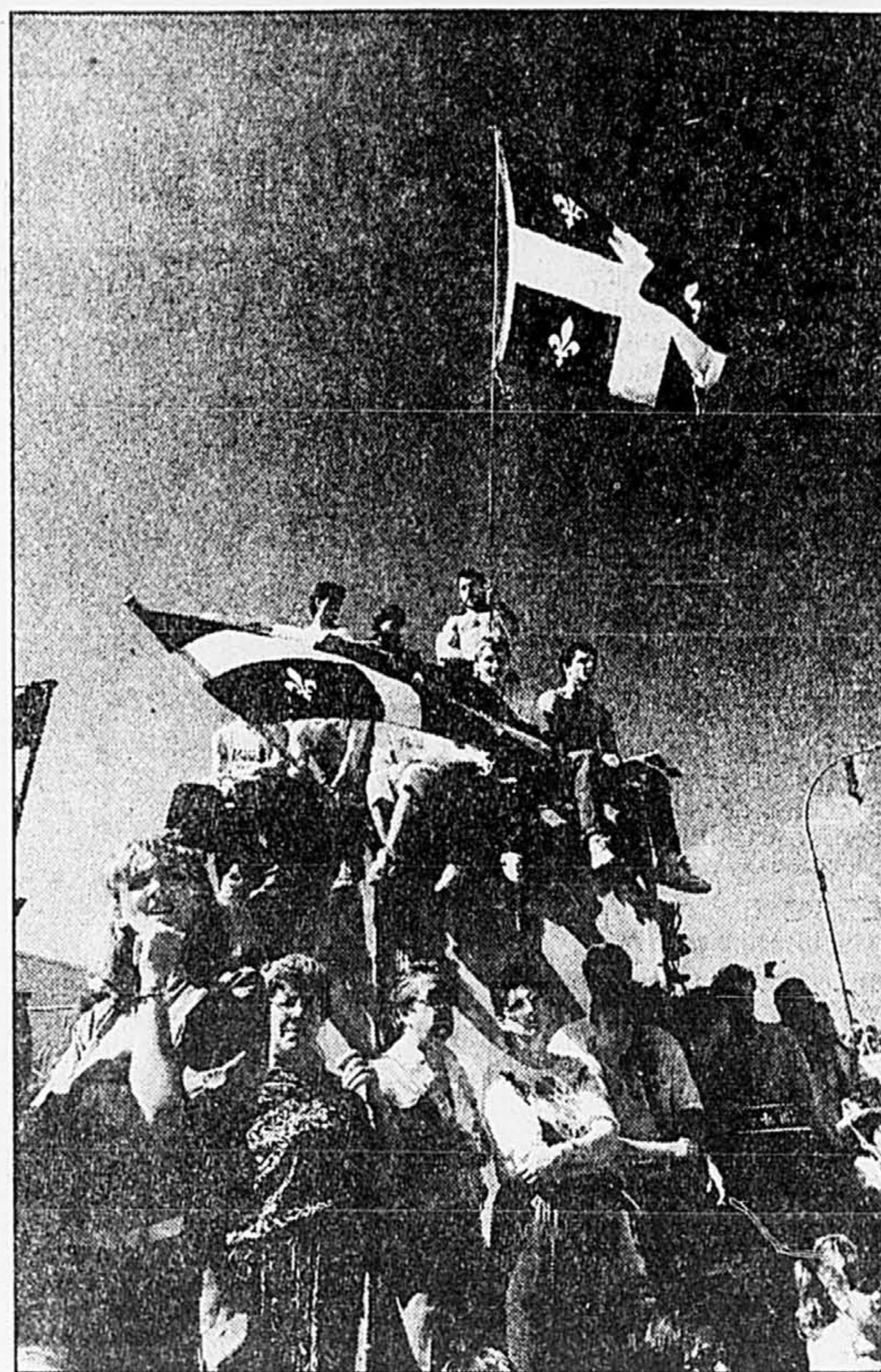
On se perchait où l'on pouvait sur le parcours du défilé.