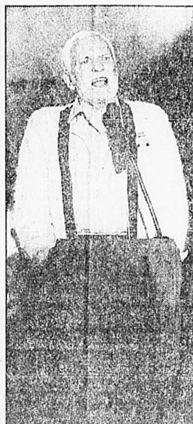
Jean Duceppe a rappelé l'urgence du pays.