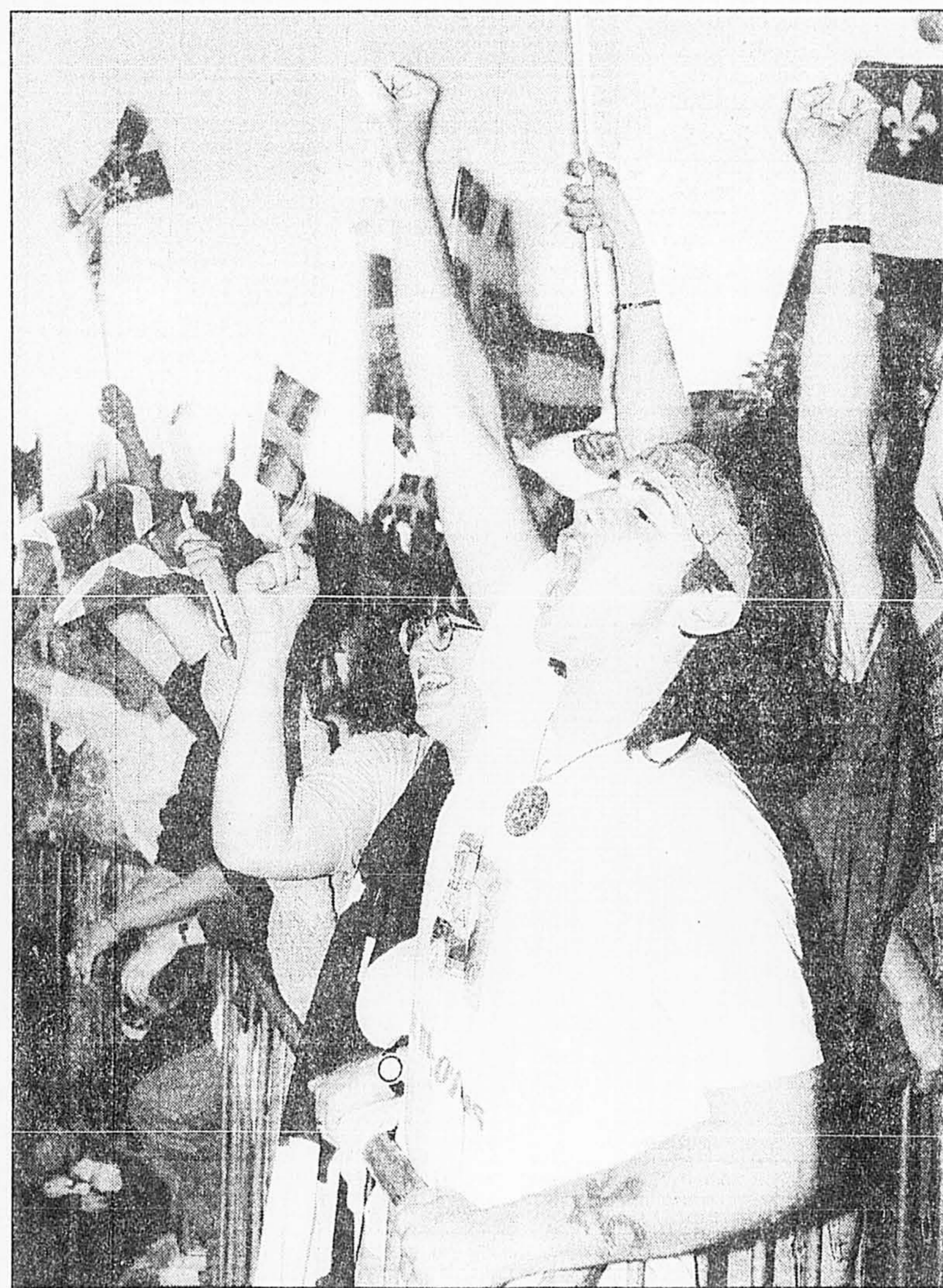
Un pays! Un pays!, criait la foule.

Tout ça était dépassé. On était en fait venu faire le pont. Faire le pont avec la Saint-Jean de 1976, sur la montagne, qui a précédé l'élection du PQ. Et celle-ci, qui ne suivait plus Meech, semblait-il, mais effaçait plutôt des années d'hésitation, devenait comme un dernier « rappel » de l'autre, annonçant tranquillement l'avènement imminent du pays.