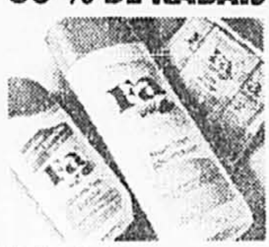
Fa. Tous les bains moussants, les gels de douche et les sels de bain. Parfums variés. Ord. 4 $ à 28,95 Solde 2,79 à 19,99 ch. Tant qu'il y en aura!

PARTICIPEZ AU CONCOURS FA À LA BAIE! VOUS POURRIEZ GAGNER UN CABRIOLET GTS DE VOLKSWAGEN!