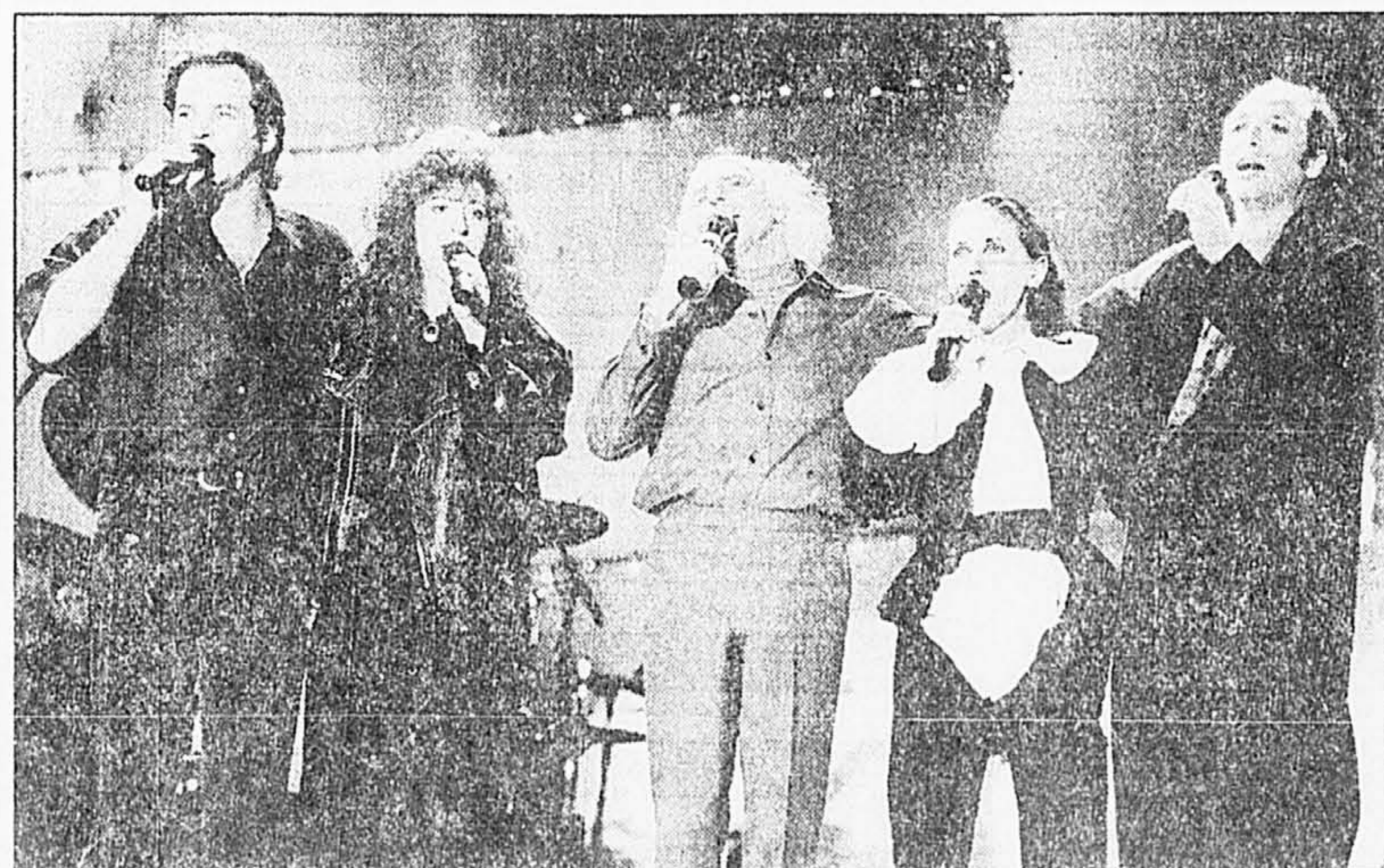
Paul Piché, Laurence Jalbert, Gilles Vigneault, Diane Dufresne et Michel Rivard attendaient les 101 000 spectateurs aux portes du pays...