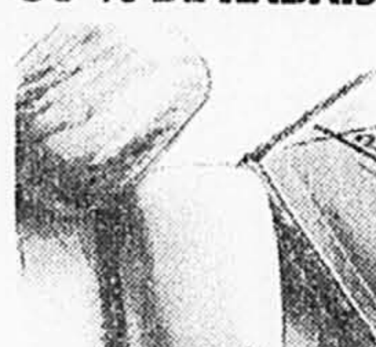
Puhl. Pain de savon fantaisie, aspect marbré. Couleurs variées. Après lancement 2,95 Solde 1,99 ch.