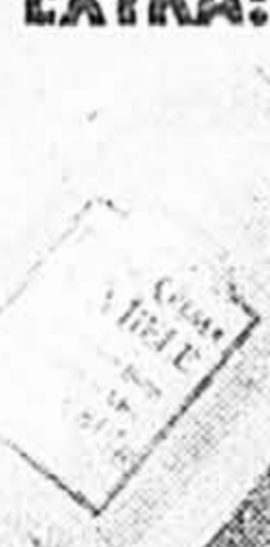
Perlier. Crème de bain, 500 ml 14,99 ch. (Valeur de 25 $) Tant qu'il y en aura!