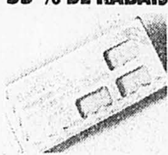
Baycrest. Jeu de 6 savons d'invité, 45 g chacun. Flocons d'avoine ou lanoline. Ord. 3,49 Solde 1,49 ch.

C'EST CLAIR ET NET! AUBAINES, PRIMES ET CONCOURS