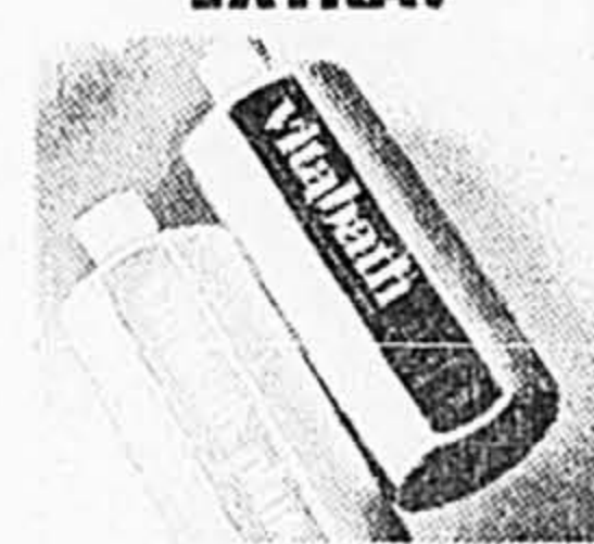
Vitabath. Et 50% en prime! Spring Green, Fresh Pink ou Plus. 900 g pour le prix de 600 g! 29,99 ch.