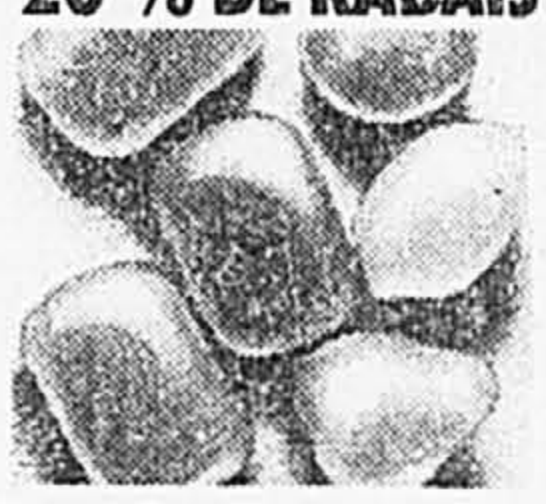
Kappus. Savons à la glycérine, parfumés aux fruits, en boîte. Ord. 2,19 Solde 1,69 ch. En vedette! Savons à la glycérine, en forme de fruit. 2/2,99