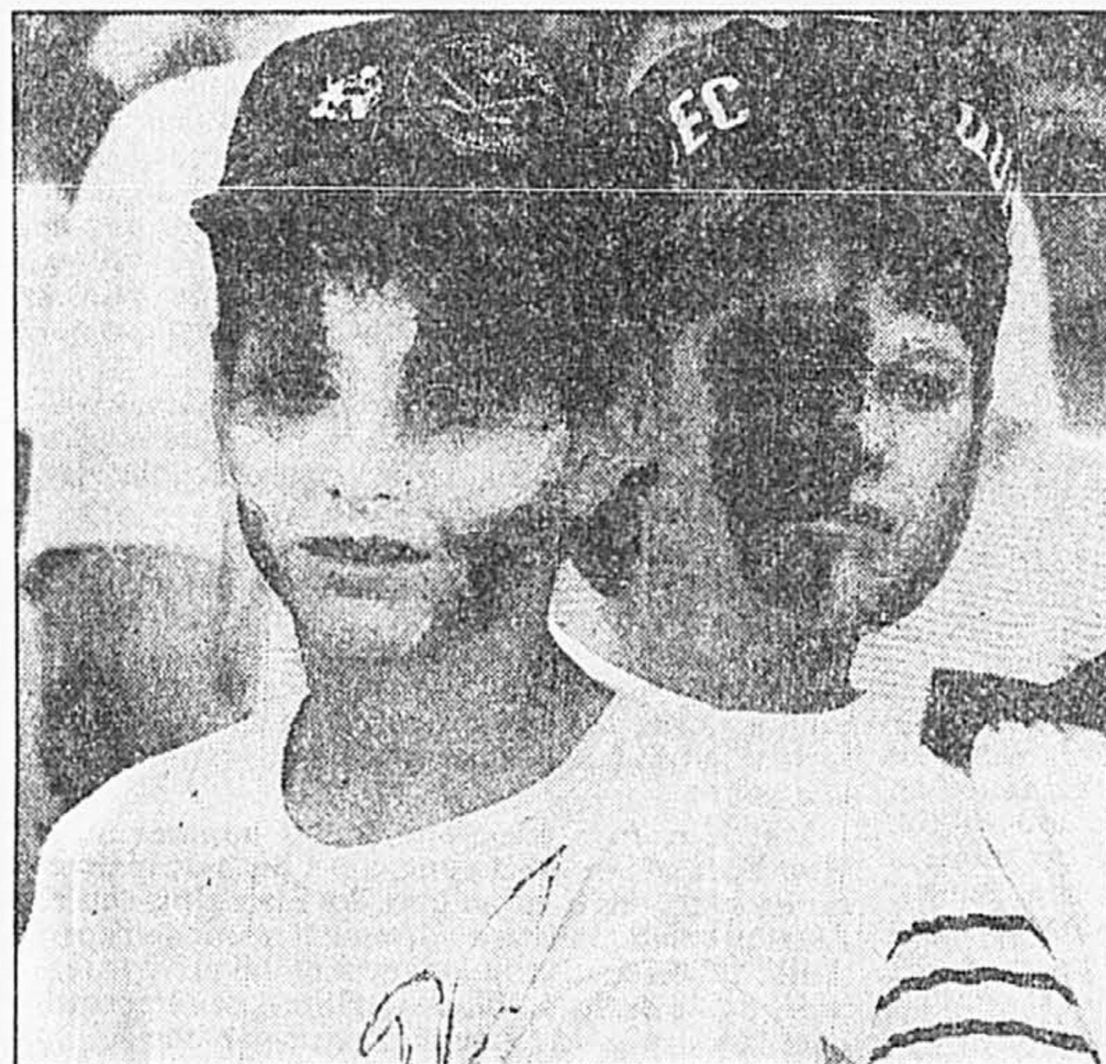
Ces deux enfants au visage peinturluré aux couleurs du fleurdelisé n'étaient pas nés en 1968.

Comme on le voit, la fierté du « caractère distinct » ne date pas d'hier. Déjà, certains, comme le