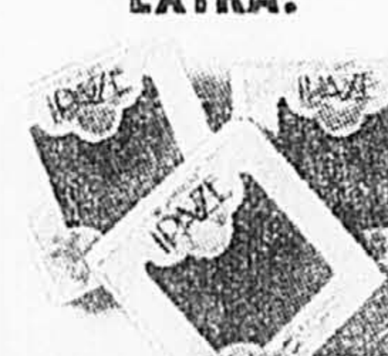
Ipaze de France. Savon à la glycérine. Pomme, rose, orange ou citron. 3/2,49 ou 83 c ch. Tant qu'il y en aura!