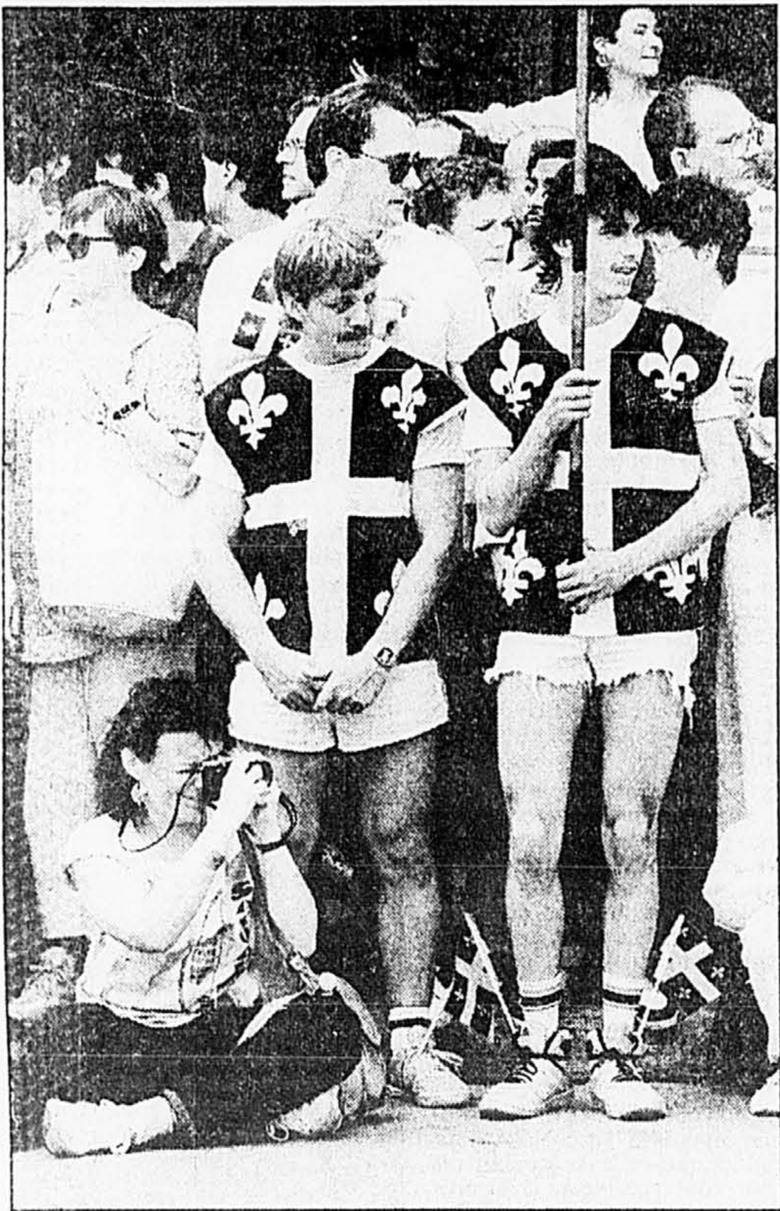
Certains avaient revêtu le fleurdelisé et le portaient même aux pieds.