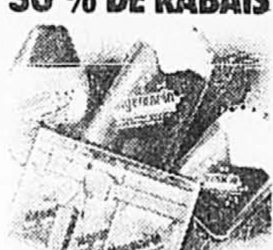
Algemarin. Tous les bains moussants, les gels de douche et les sels de bain. Ord. 3,20 à 16,60 Solde 2,25 à 11,62 ch. Tant qu'il y en aura!