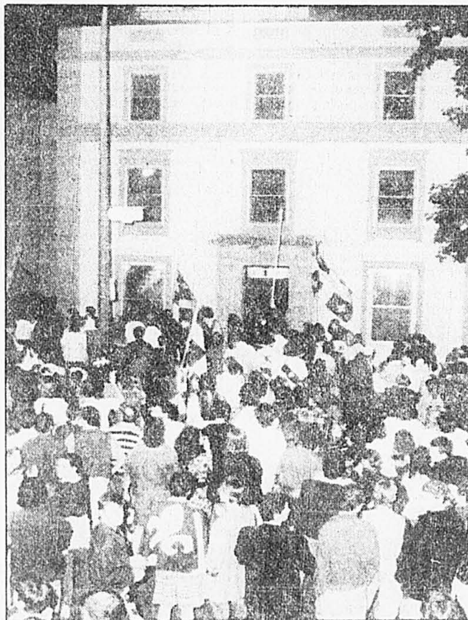
Une manifestation spontanée, dimanche soir, a conduit les participants devant la maison de Pierre-Elliott Trudeau sur l'avenue Des Pins.

En 1940, donc, la tendance à s'affirmer comme un peuple mûr et capable de décision s'est aussi manifestée dans le défilé. De 1940 à 1947, le personnage de saint Jean-Baptiste adulte fut substitué au garçonnet aux cheveux bouclés.