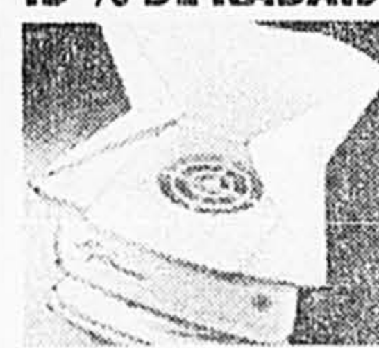
Epi-Sauna. Sauna facial et vaporisateur. Se plie à 9 cm de hauteur. Ord. 99,95 Solde 49,95 ch.