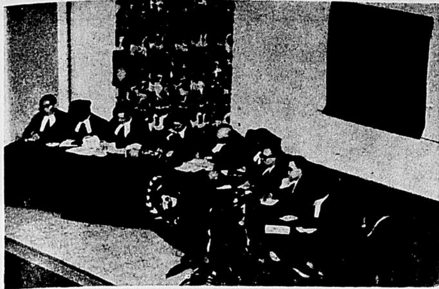
Cette année, c'est sur notre campus que se déroulera la session de l'O.N.U. modèle.