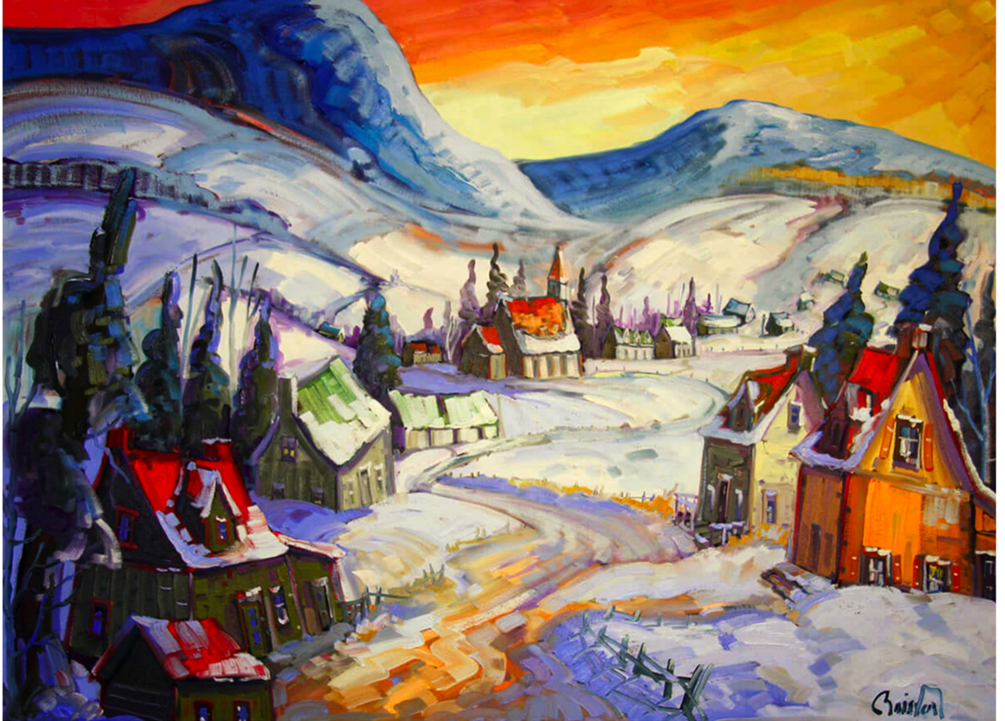
Village de St-Tite-des-Caps par Normand Boisvert, 2015