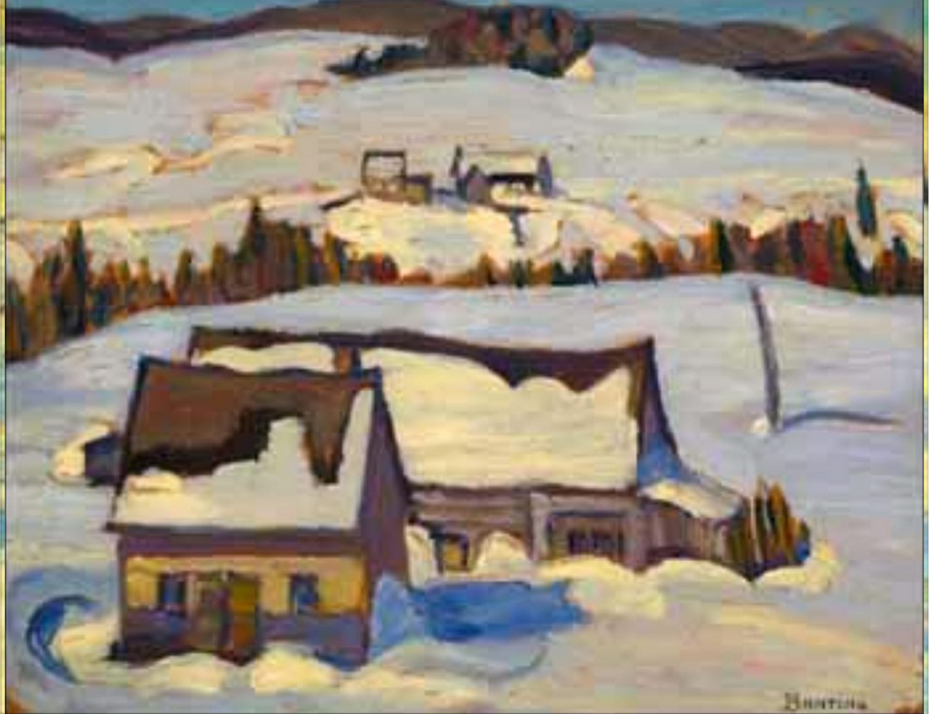
St-Tite-des-Caps, Québec par Sir Frederick Grant Banting, 1937 Huile sur panneau vendue 43 125$ incluant la prime d'achat