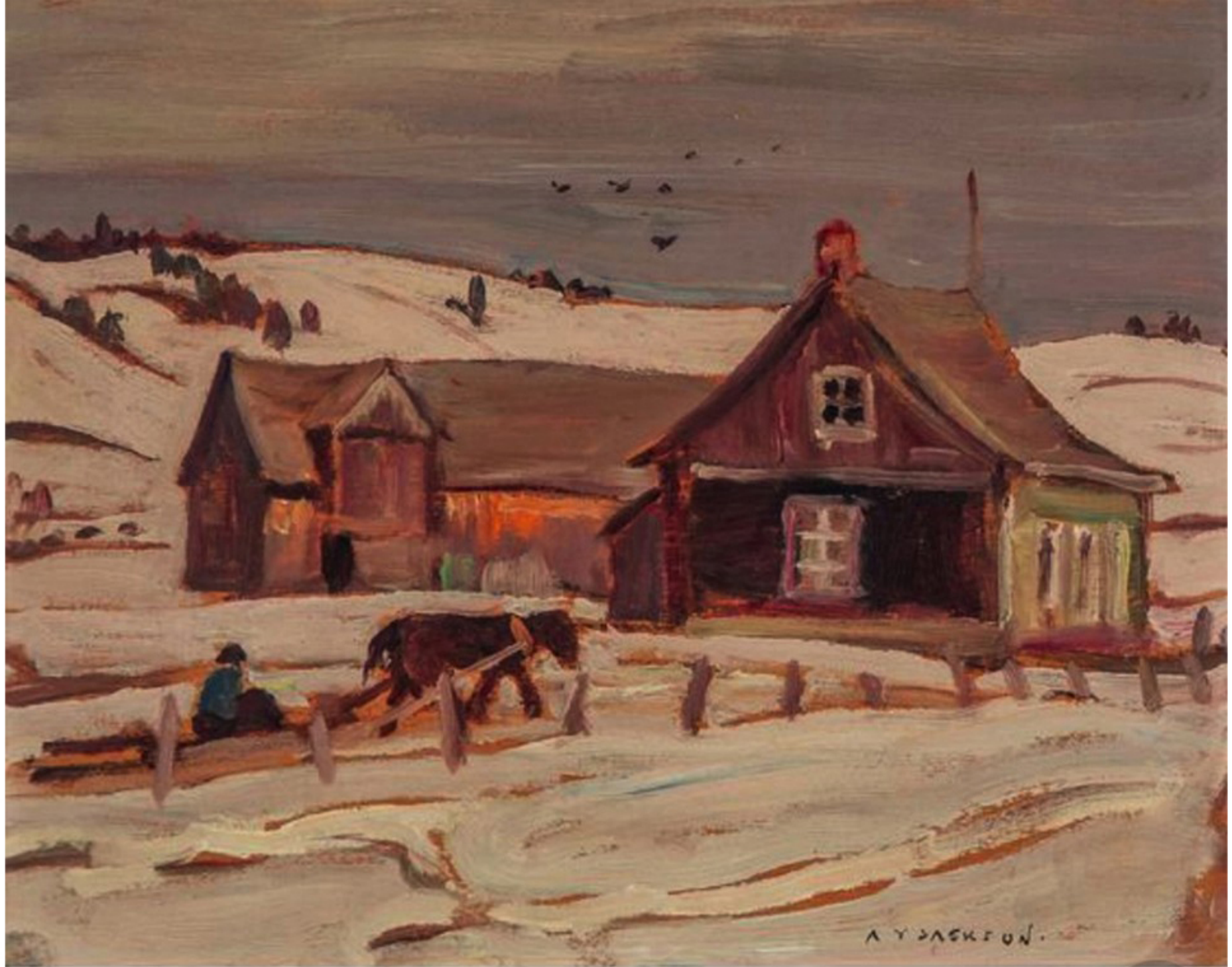
St-Tite-des-Caps par Alexander Young Jackson en 1946