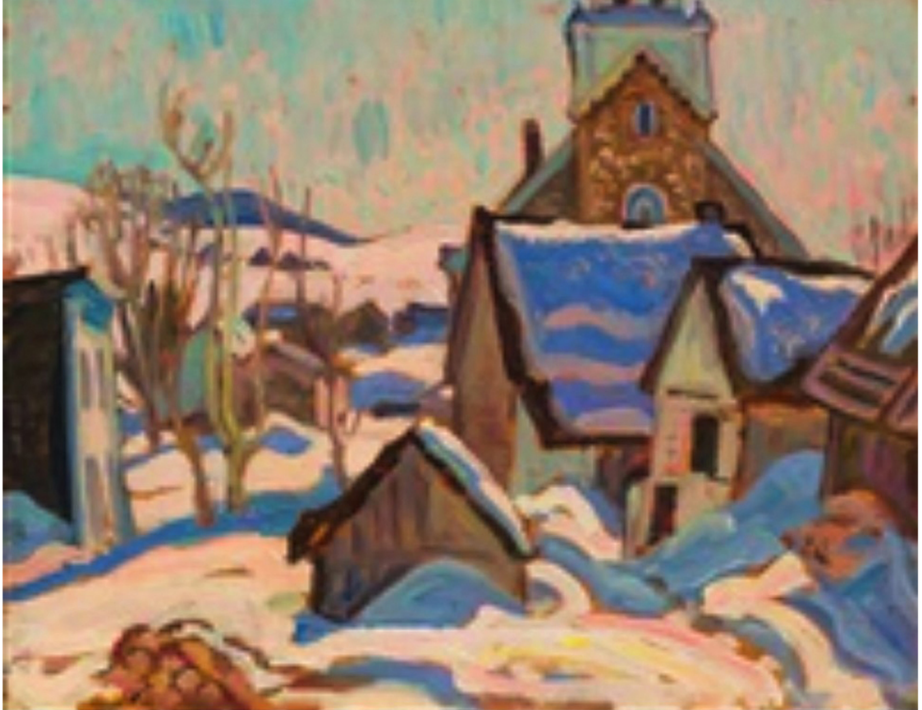
L'église de St-Tite-des-Caps par Alexander Young Jackson, 1928