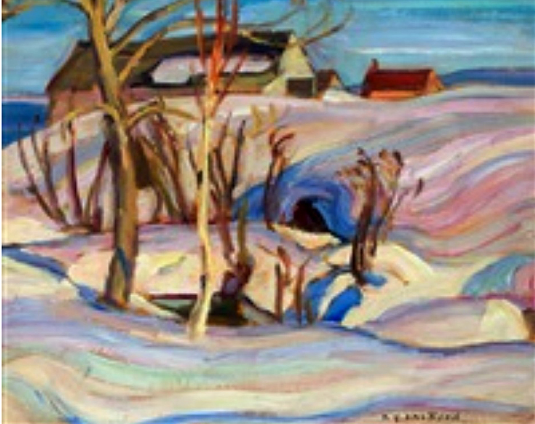
La crique, St-Tite-des-Caps par Alexander Young Jackson, 1930-1932 47