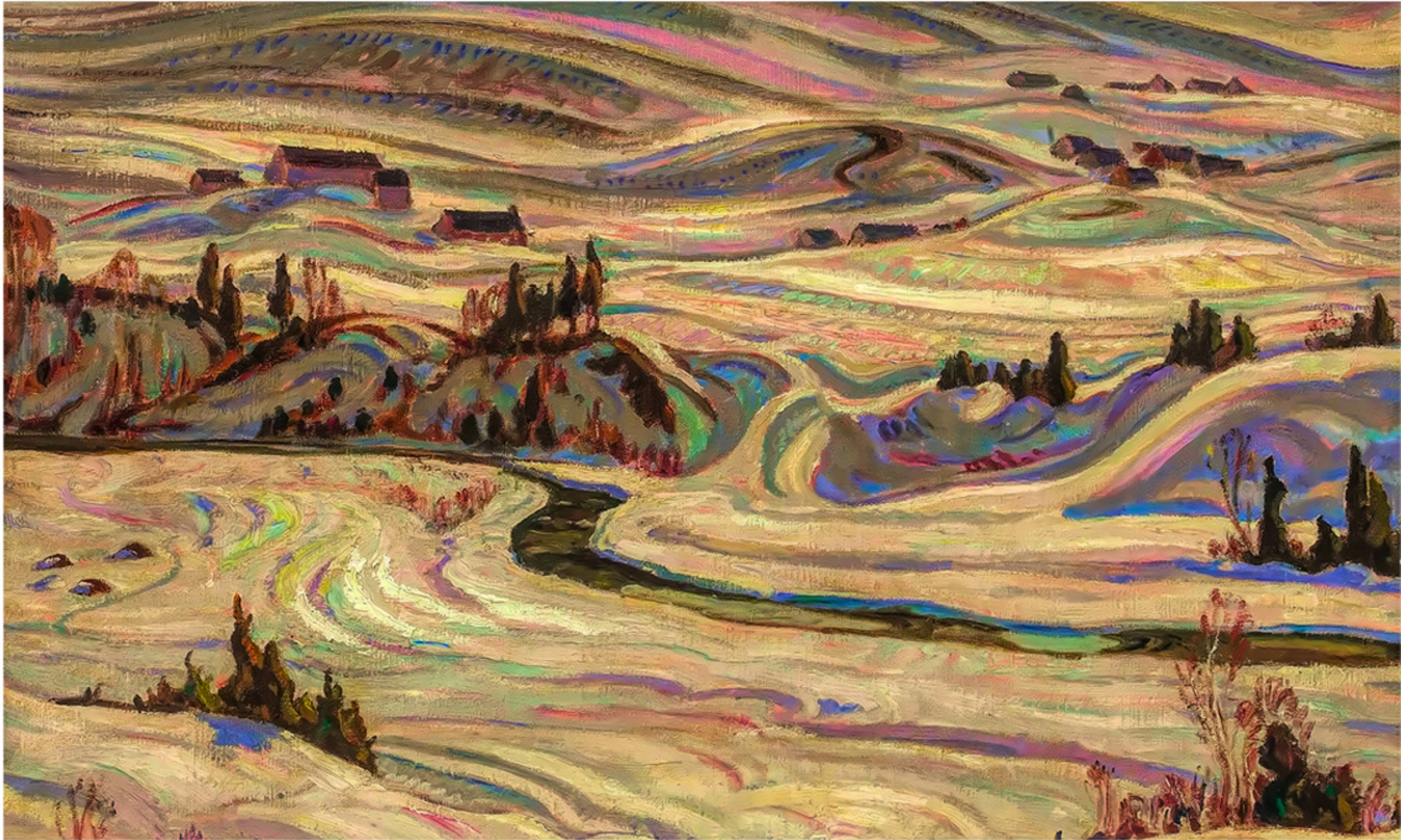
Hillside, St-Tite-des-Caps par Alexander Young Jackson, 1931 Vendu 324 000$