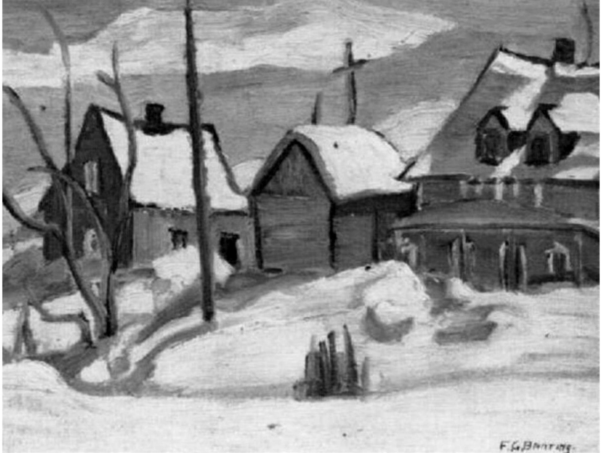
Winter, St-Tite-des-Caps par Sir Frederick Grant Banting, 1937