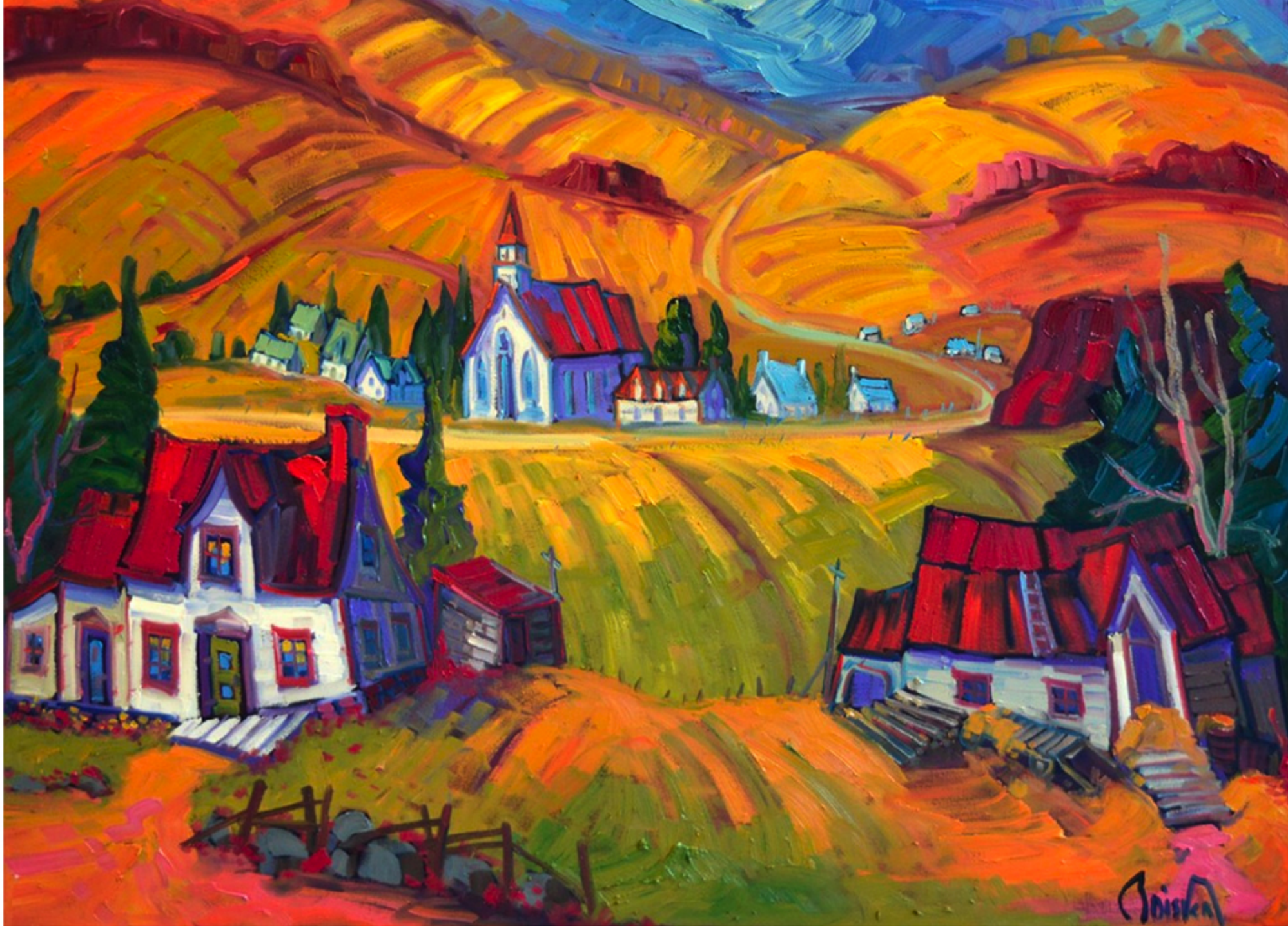
Automne à Saint-Tite-des-Caps par Normand Boisvert Huile 36 x 36 4 053$