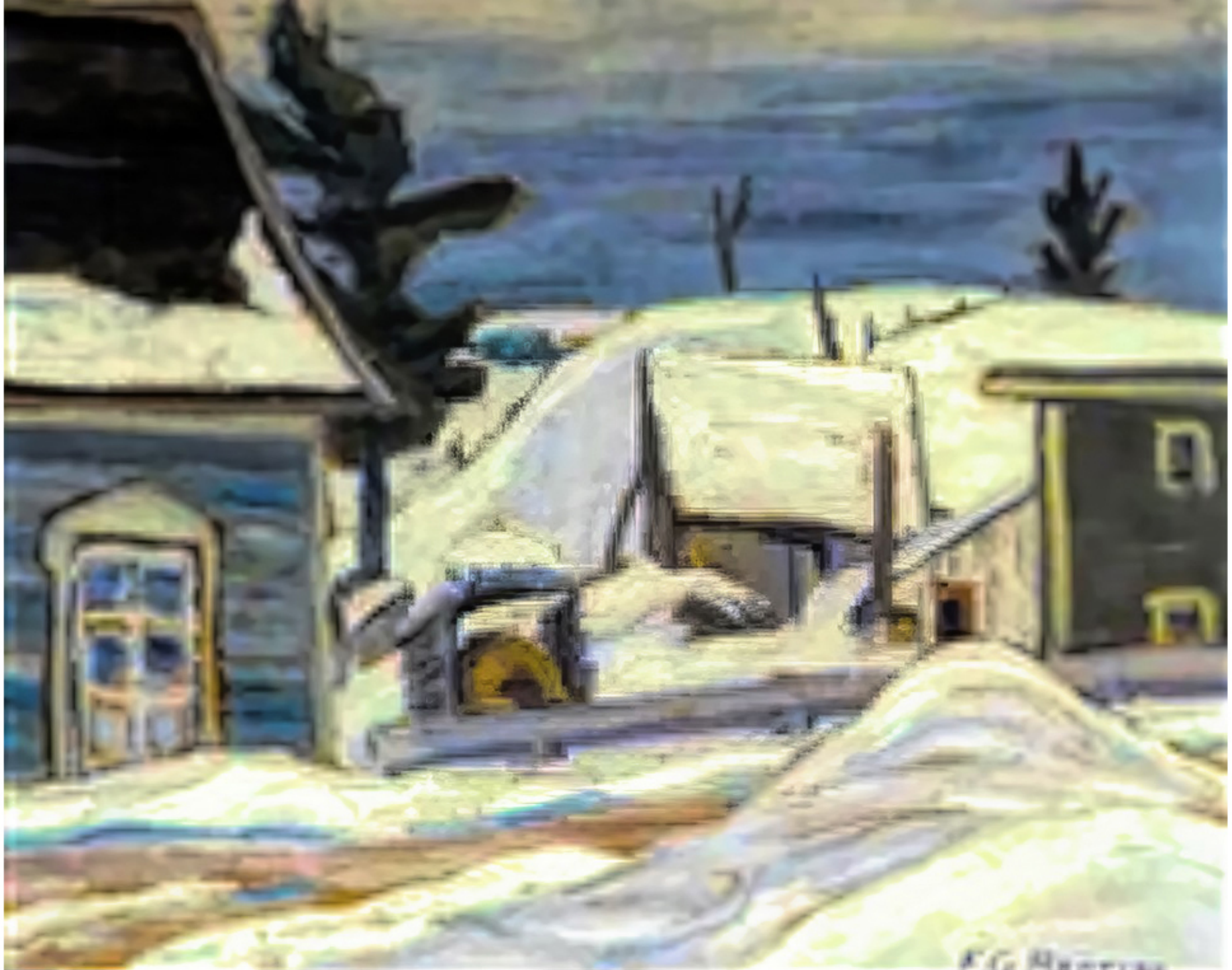
St-Tite-des-Caps par Sir Frederic Grant Banting 1937