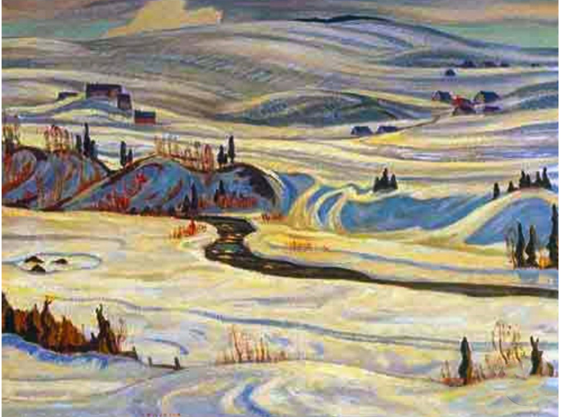
Hillside, St-Tite-des-Caps par Alexander Young Jackson