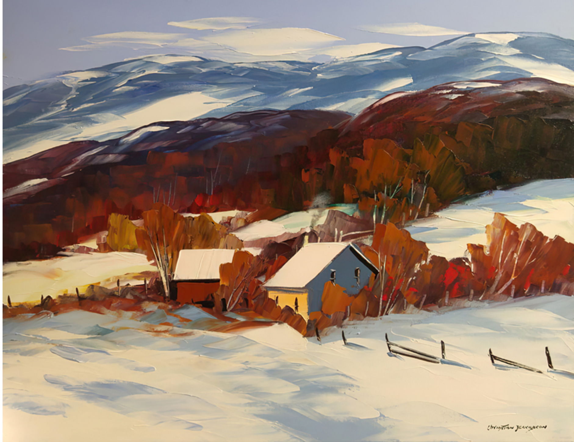
À St-Tite-des-Caps par Christian Bergeron