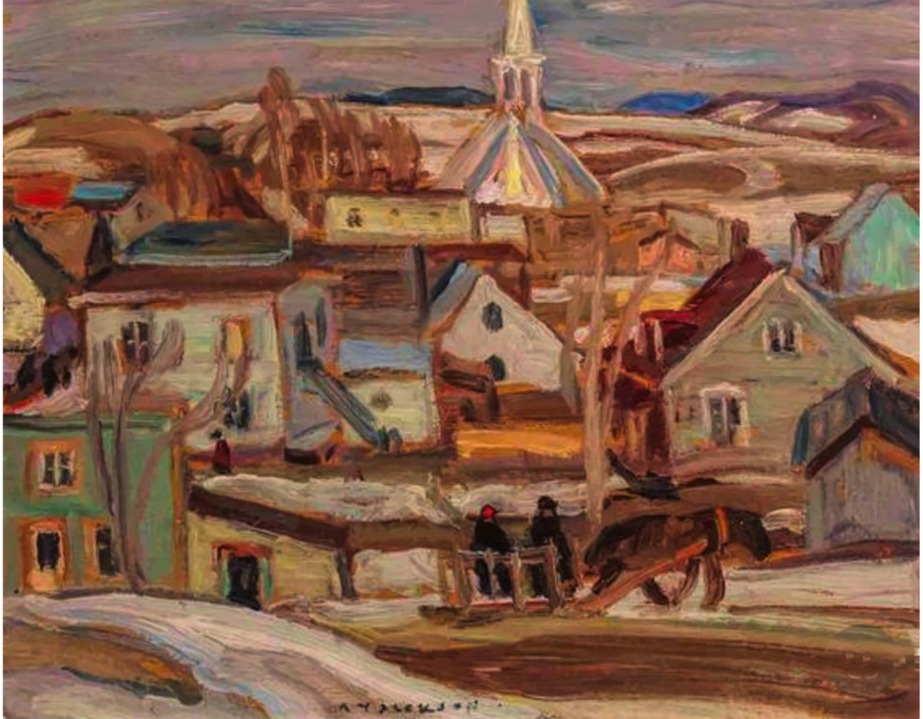
St-Tite-des-Caps par Alexander Young Jackson 1932