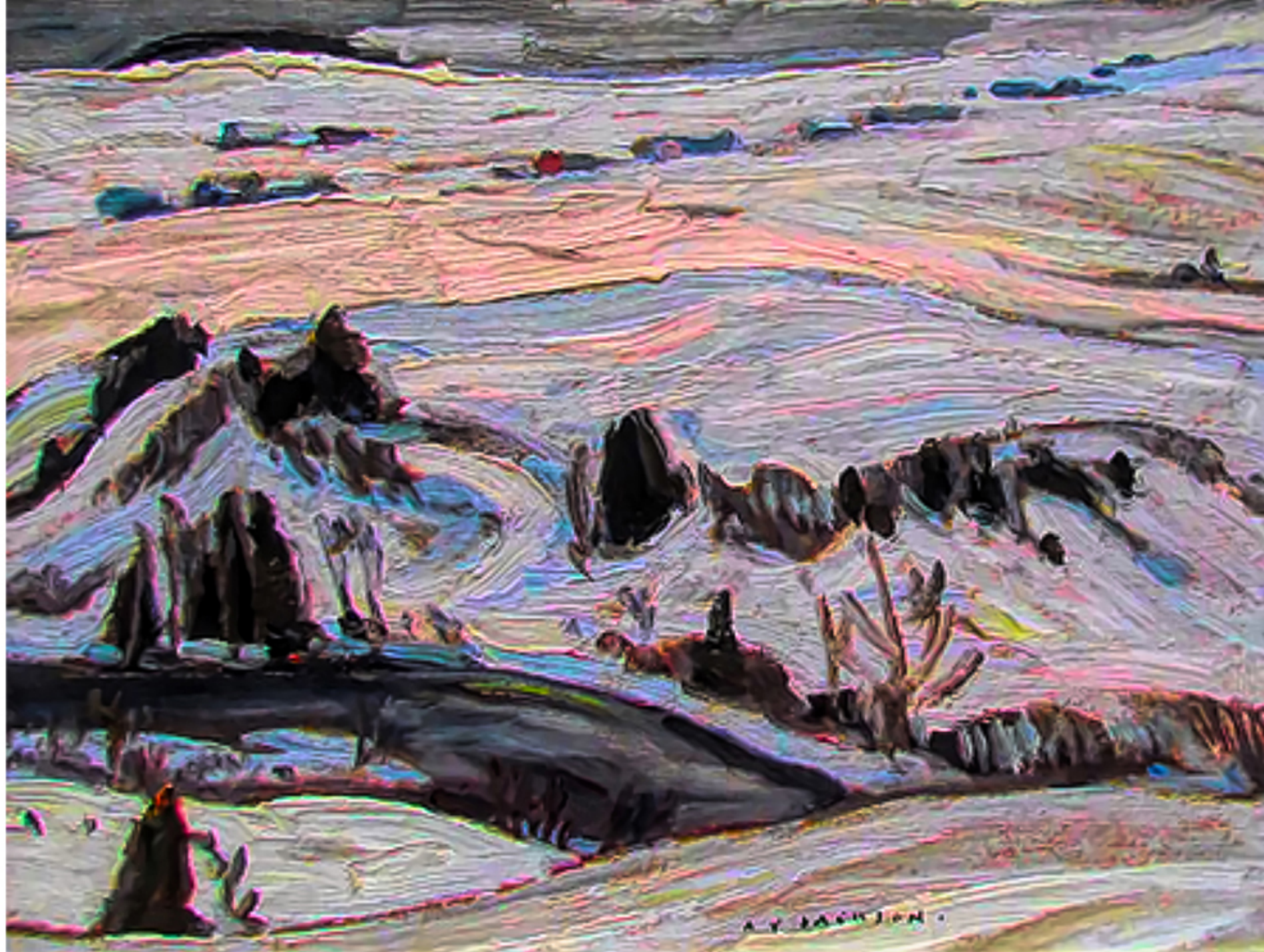
Saint-Tite-des-Caps par Alexander Young Jackson 1950 Huile sur panneau, 38 000$