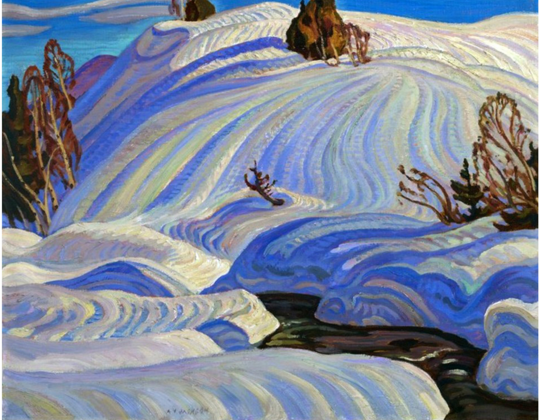
The Stream, St-Tite-des-Caps par Alexander Young Jackson, 1934