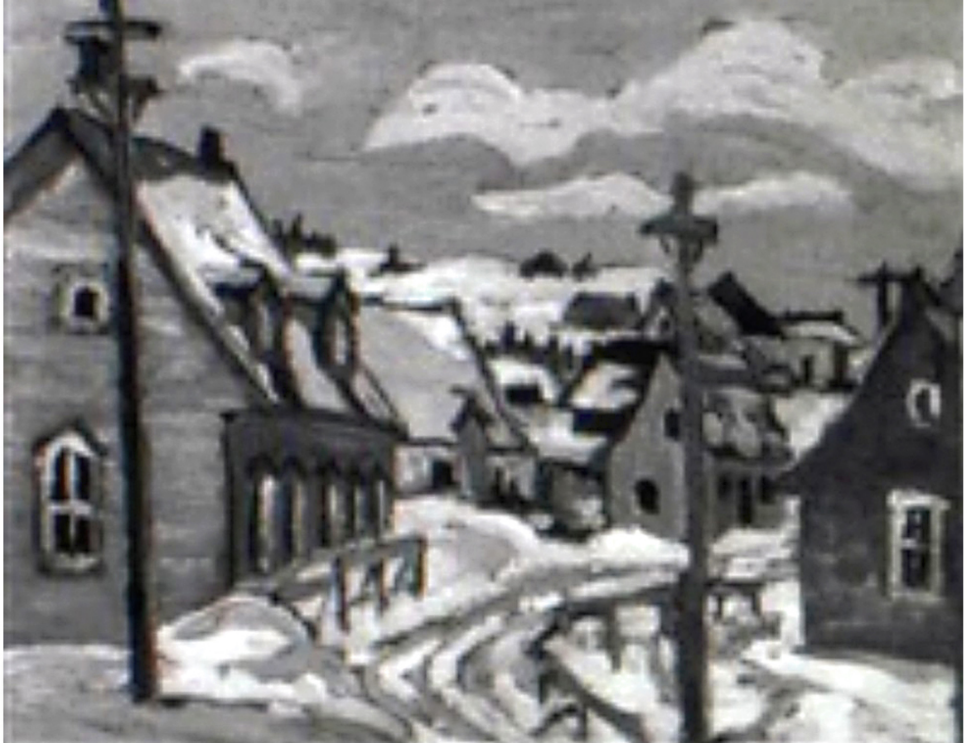
St-Tite-des-Caps, Québec par Sir Frederik Grant Banting