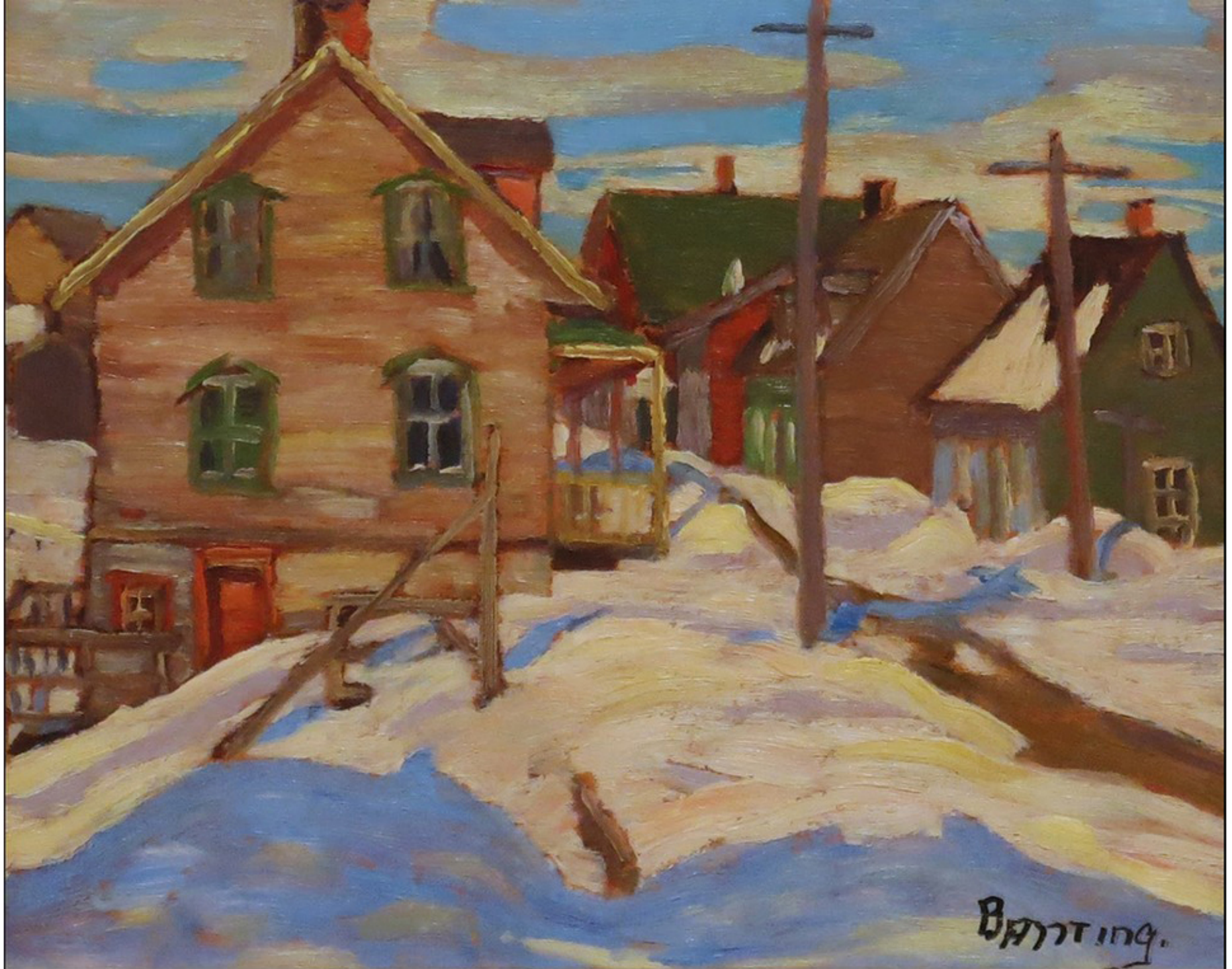
St-Tite-des-Caps par Sir Frederick Banting 1937