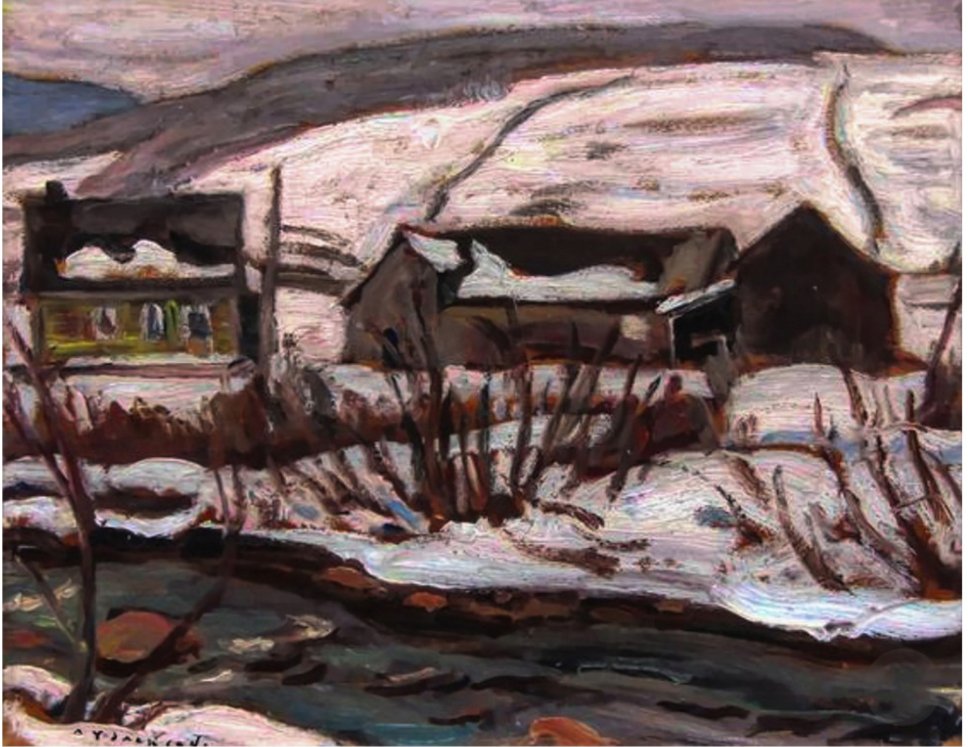
Grey, St-Tite-des-Caps par Alexander Young Jackson 1946