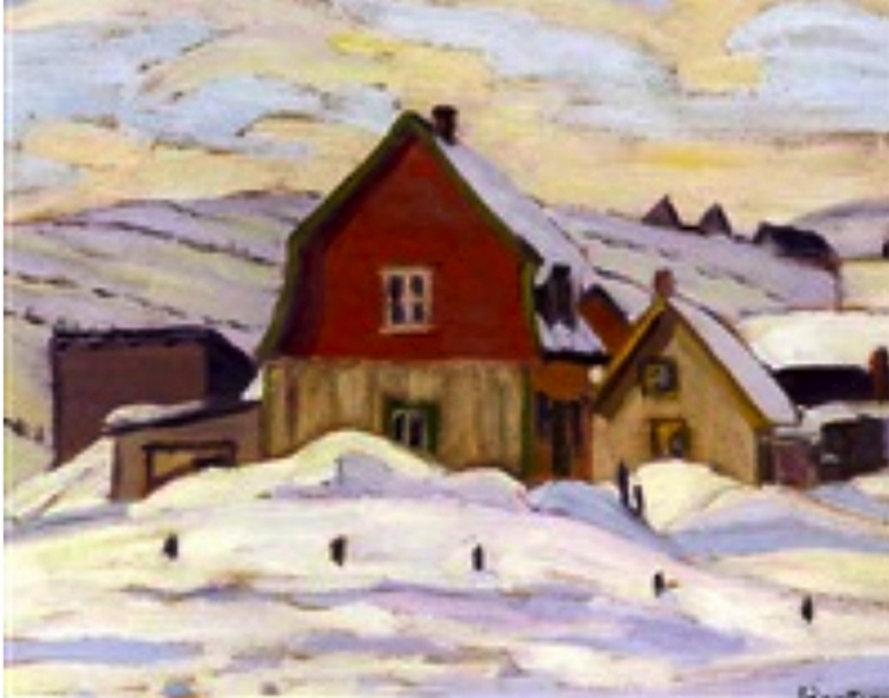
Payage canadien-français, St-Tite-des-Caps Sir Frédéric Grant Banting 1937