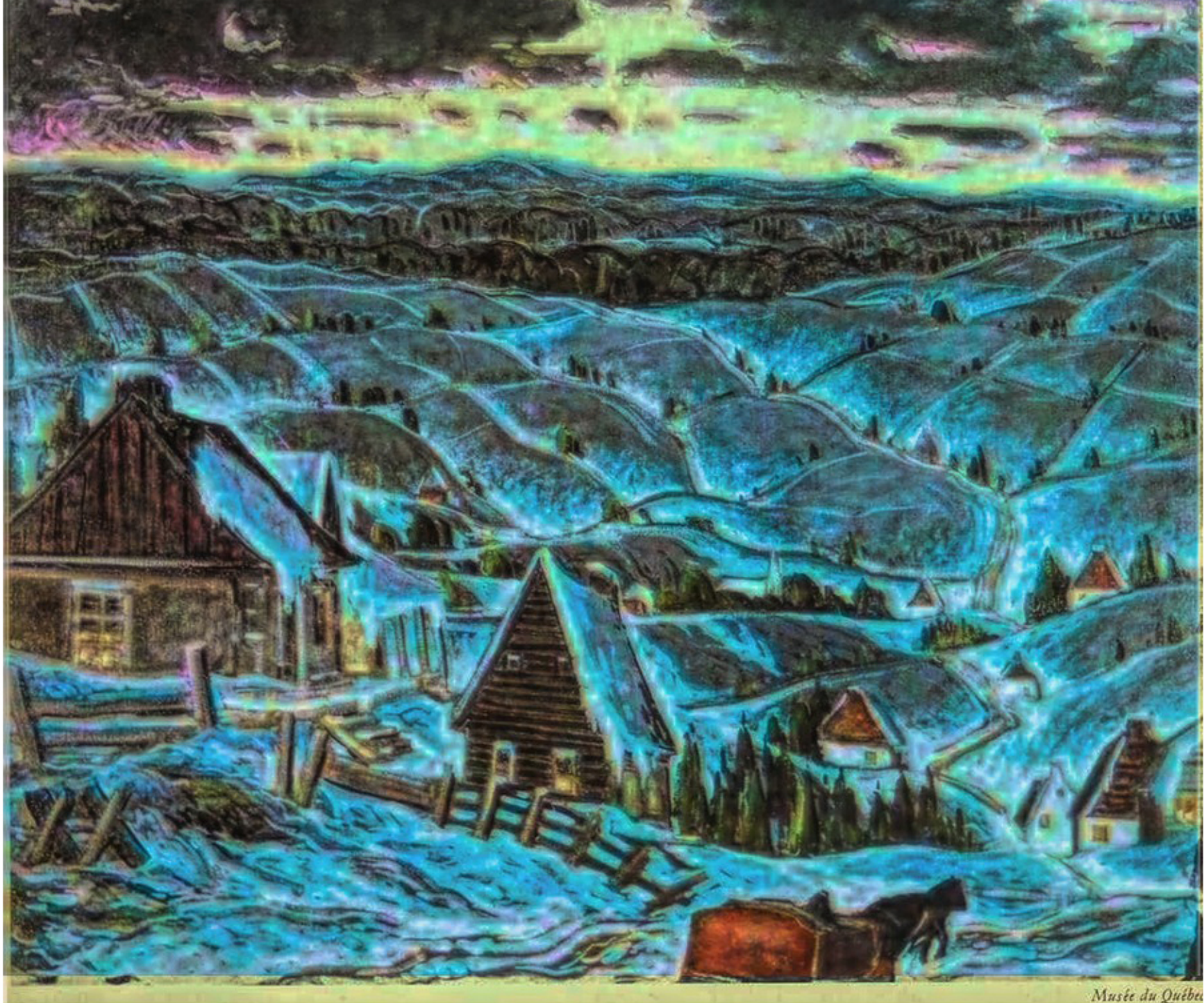
Crépuscule à St-Tite-desCaps par Marc-Aurèle Fortin vers 1940