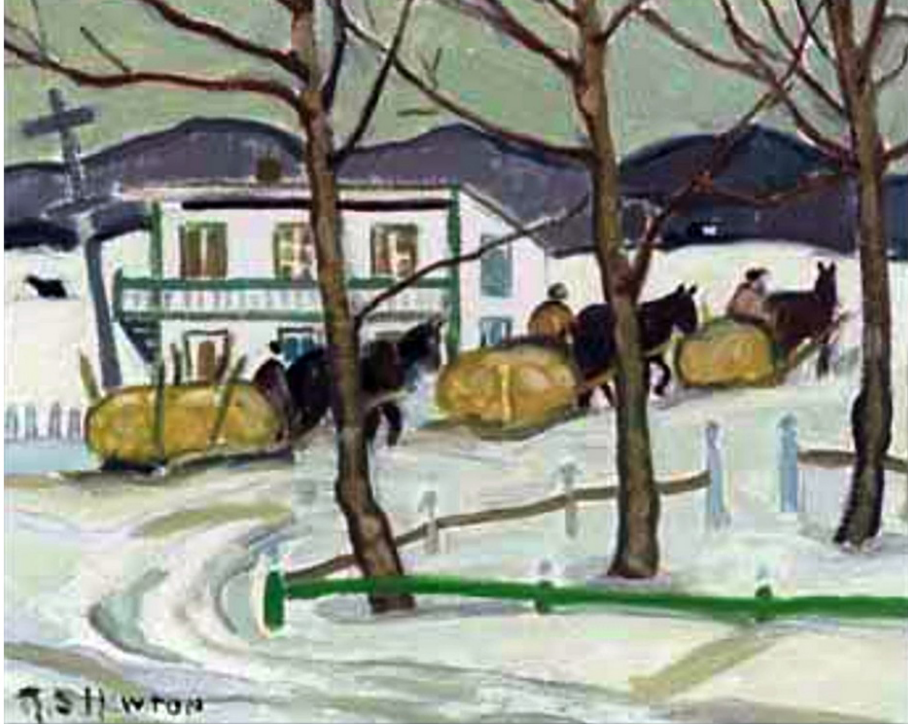
Three Loads of Hay, St-Tite-des-Caps, Randolph Stanley Hewton, 1928? Huile sur canvas, 16 000$