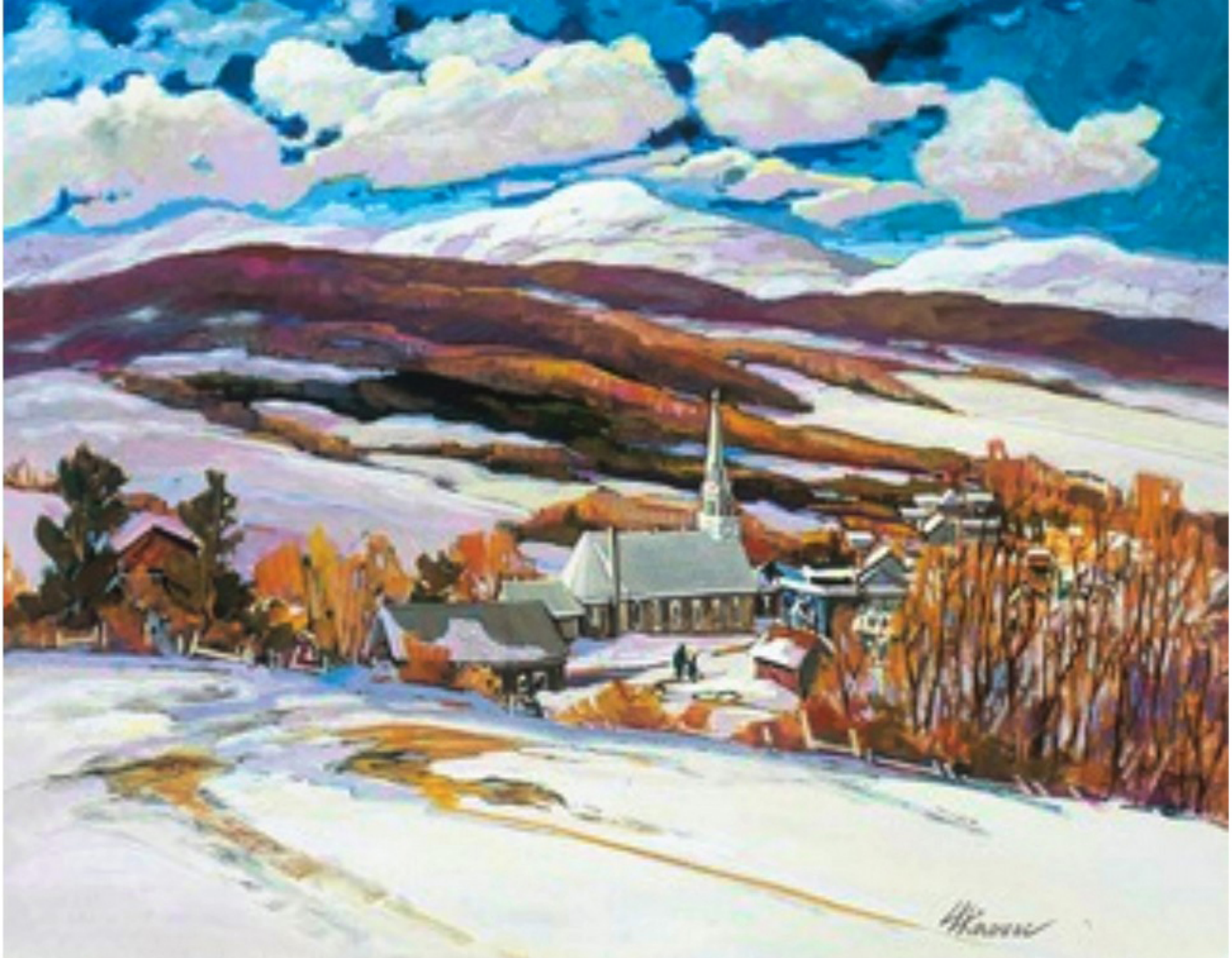
Saint-Tite-des-Caps par Louise Lecor Kirouac