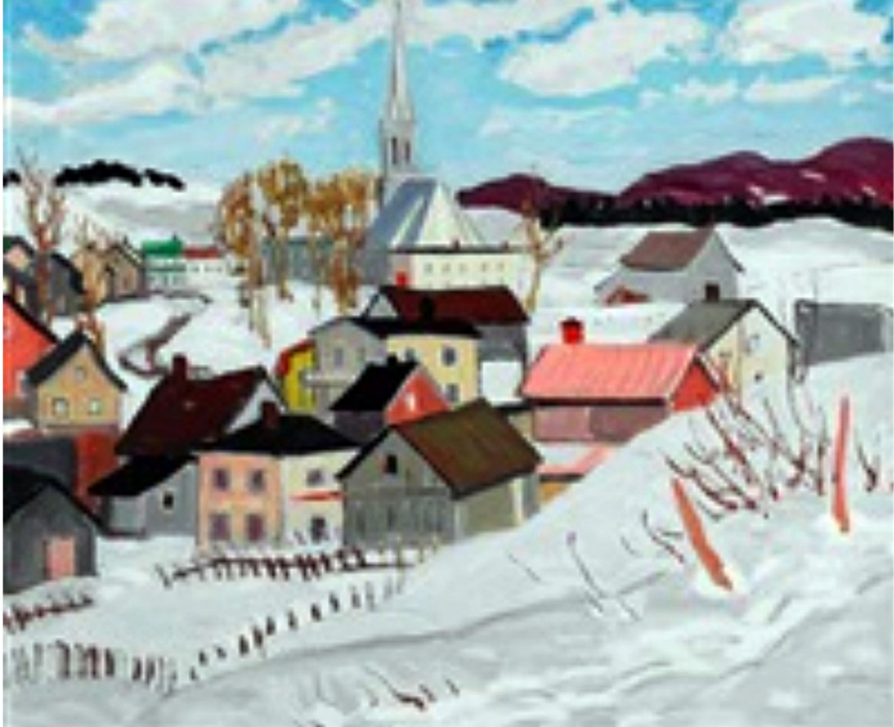
St-Tite-des-Caps, Randolph Stanley Hewton, 1928?