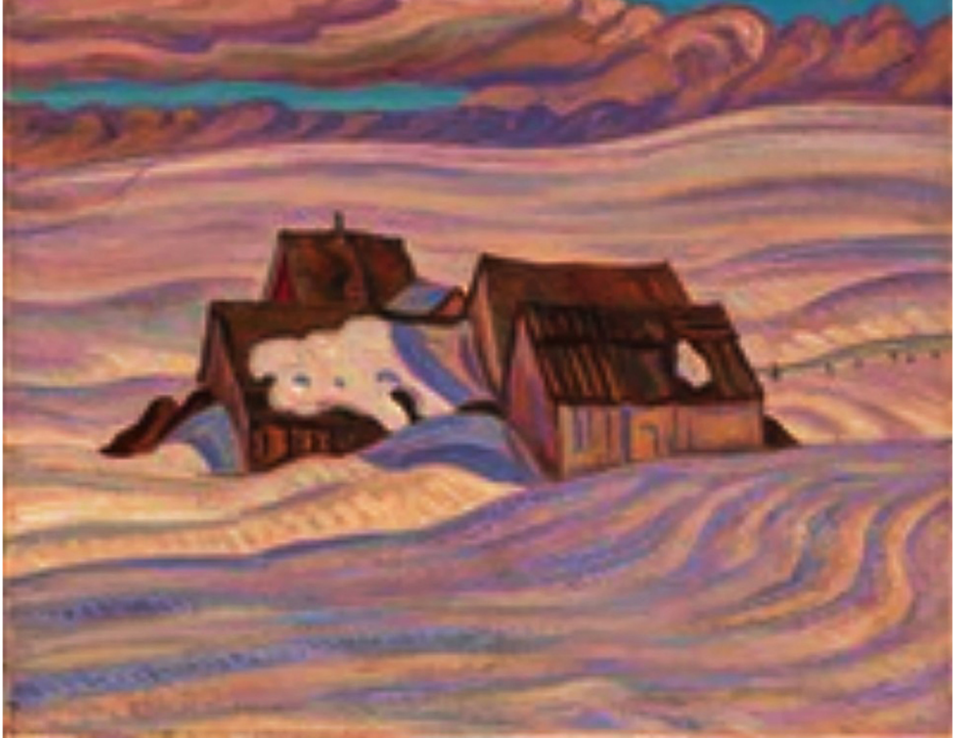
Ferme à St-Tite-des-Caps par Alexander Young Jackson, 1937