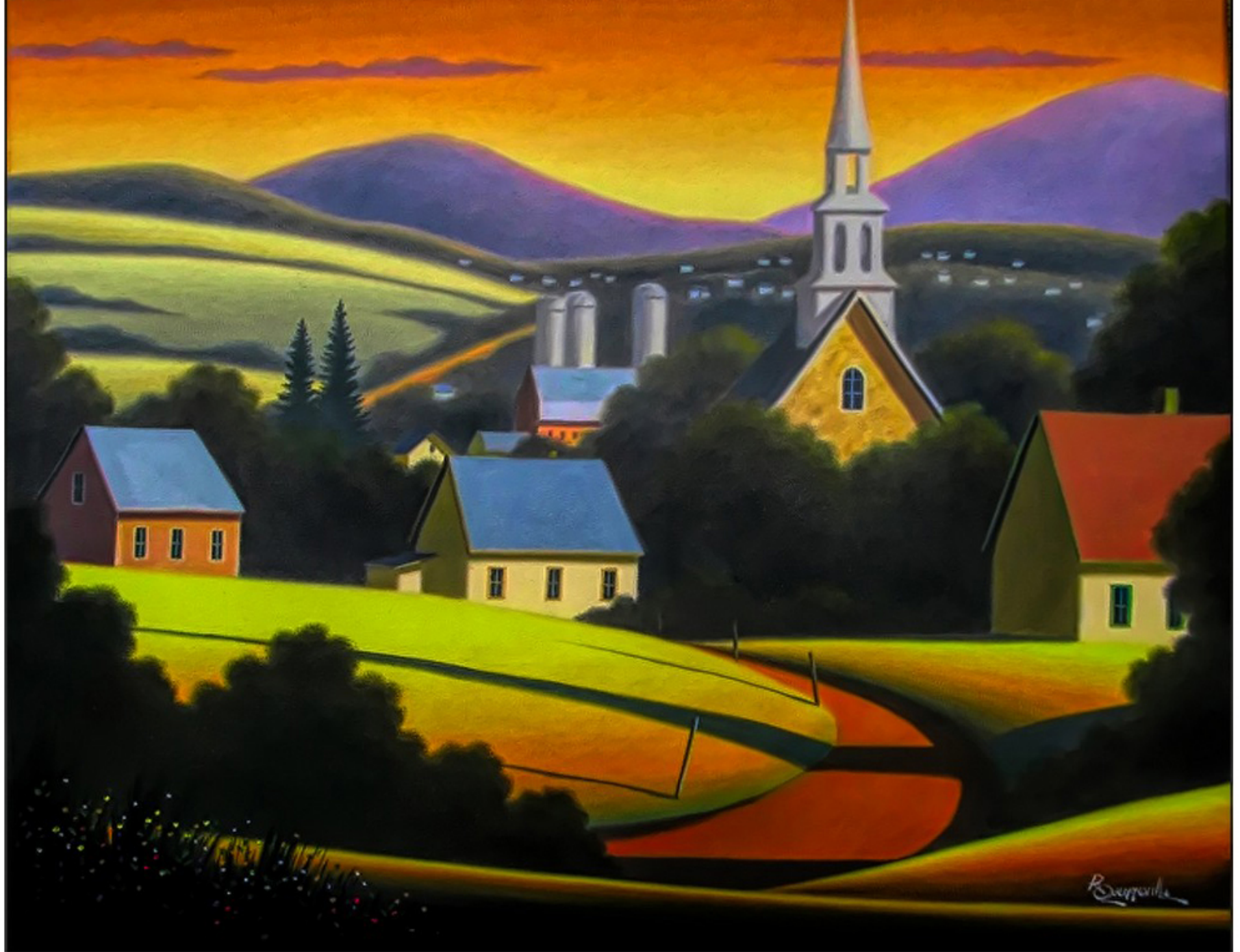
St-Tite-des-Caps par Raymond Quenneville