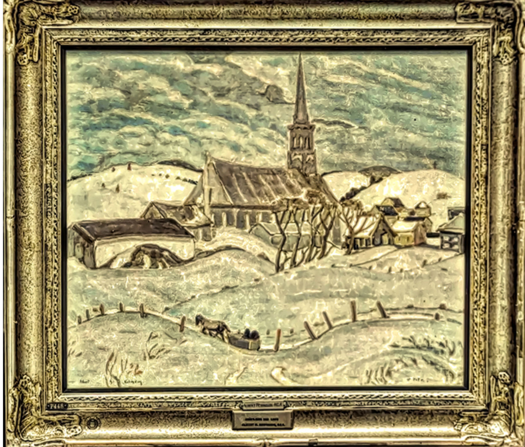
Saint-Tite-des-Caps par Albert Henry Robinson, 192X