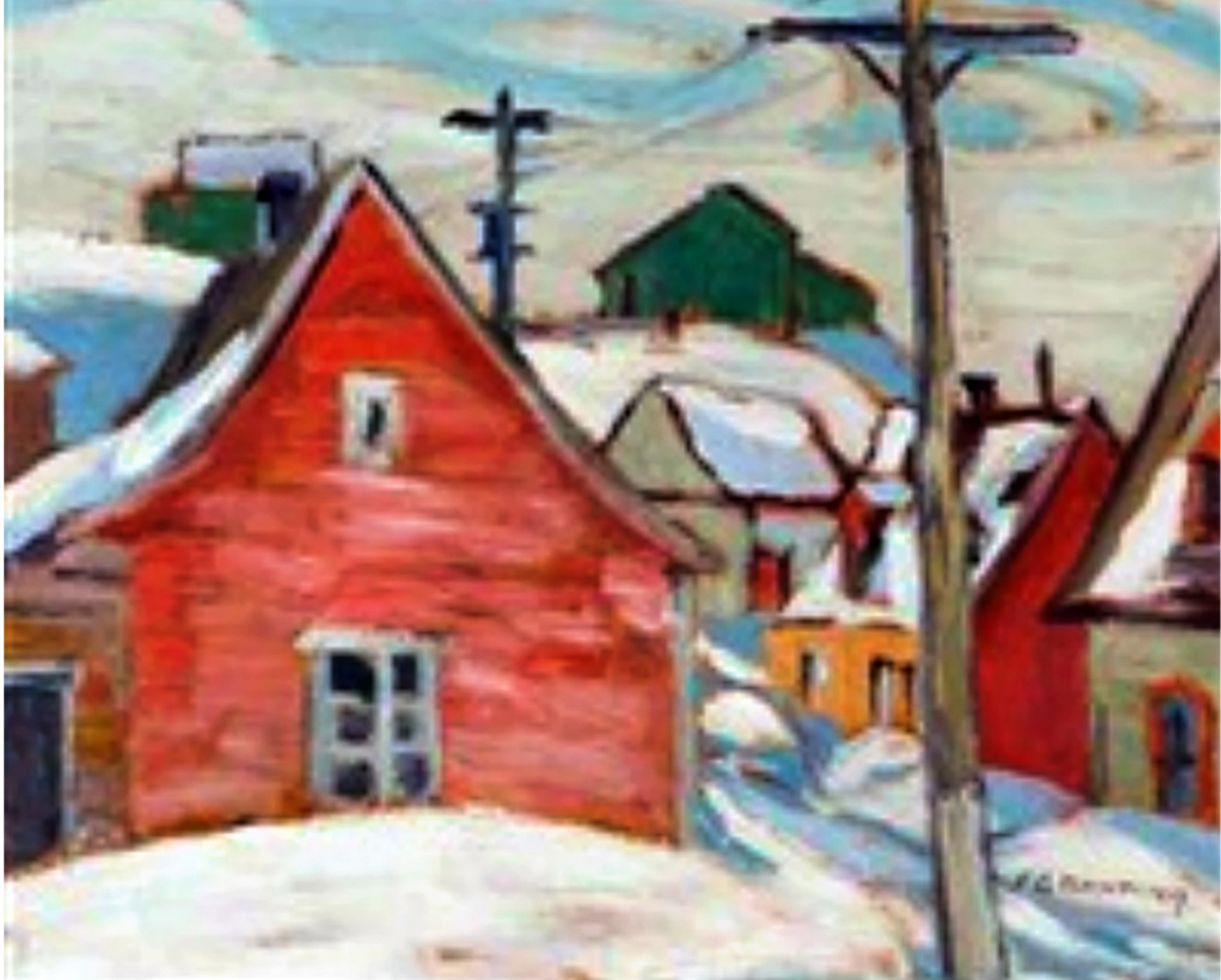
St-Tite-des-Caps, Québec par Sir Frederik Grant Banting, 1937