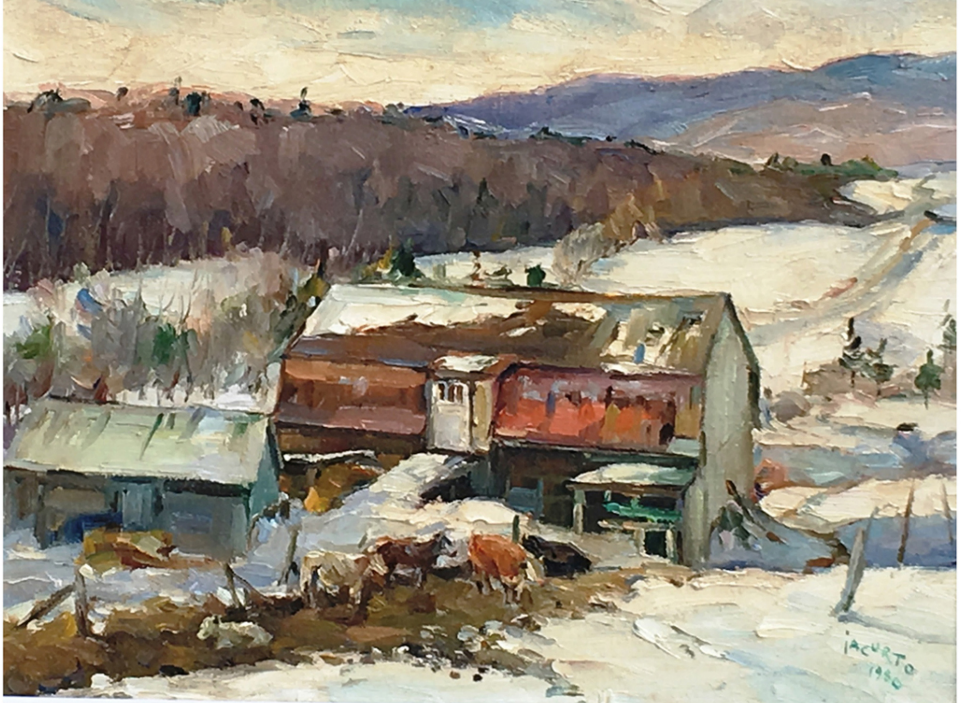
St-Tite-des-Caps par Francesco Iacurto 1980