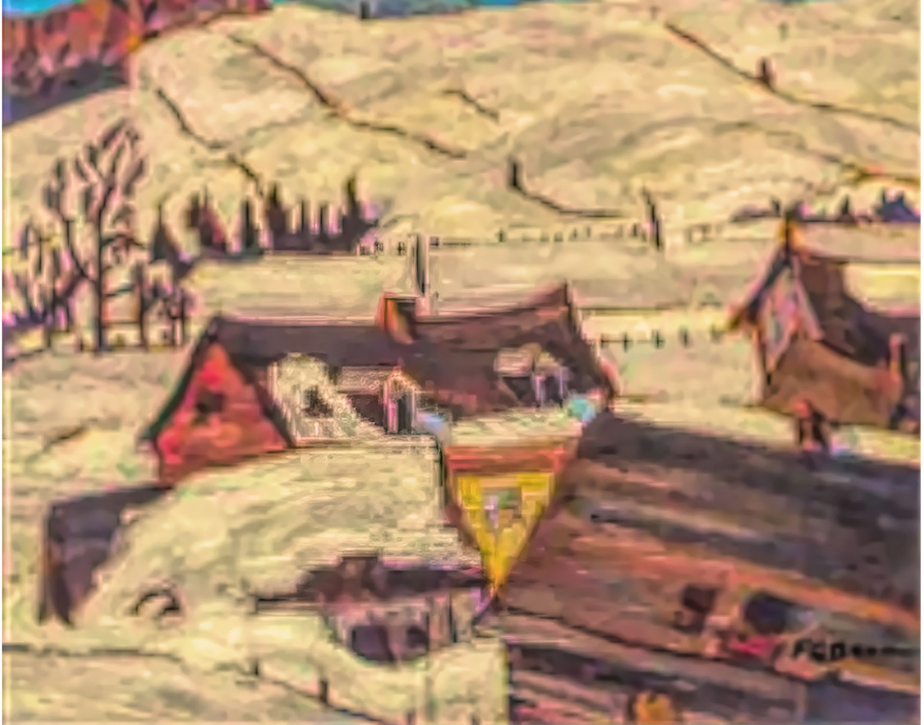
St-Tite-des-Caps, Québec par Sir Frederick Grant Banting, 1937