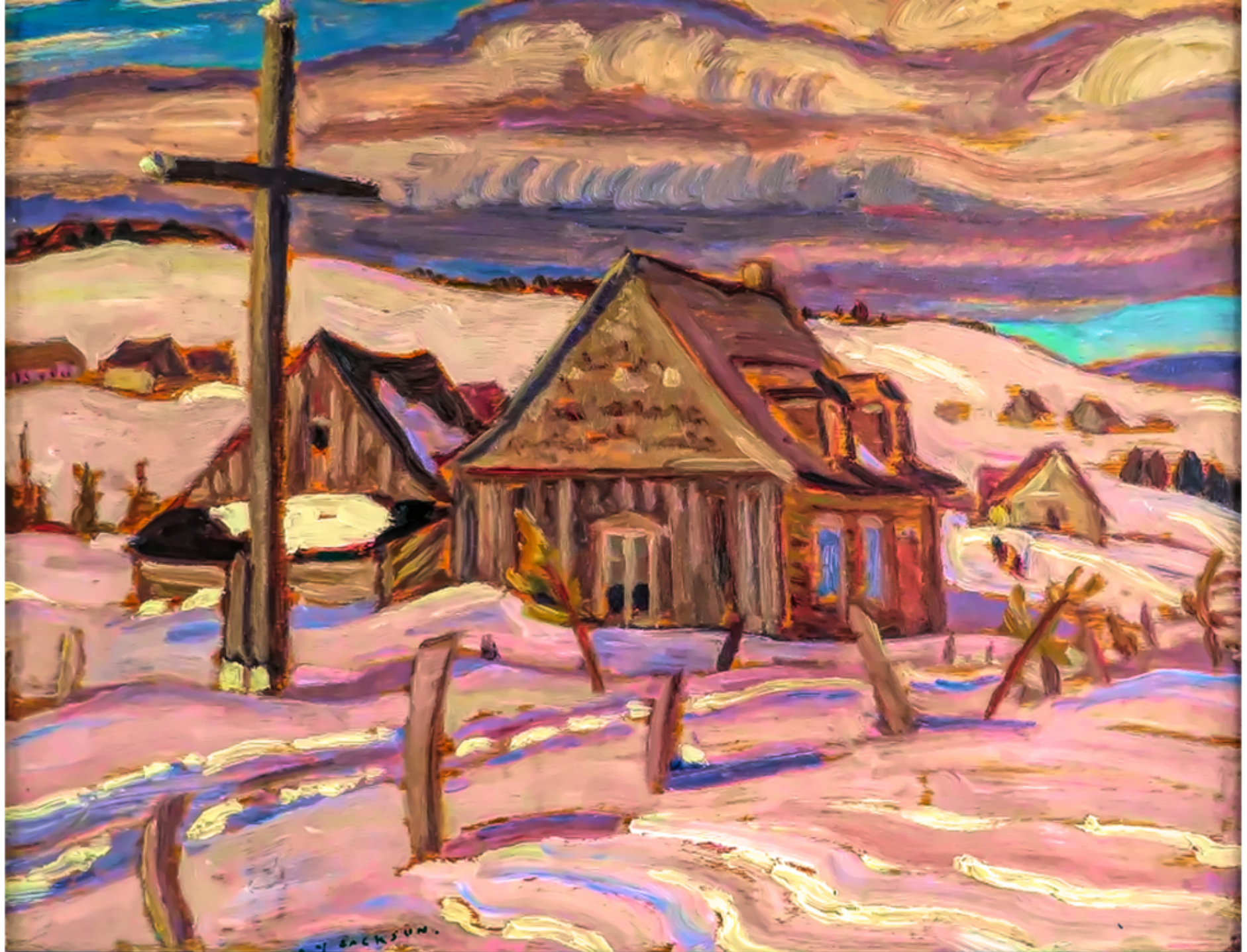
Le calvaire, St-Tite-des-Caps, A.Y. Jackson 1937