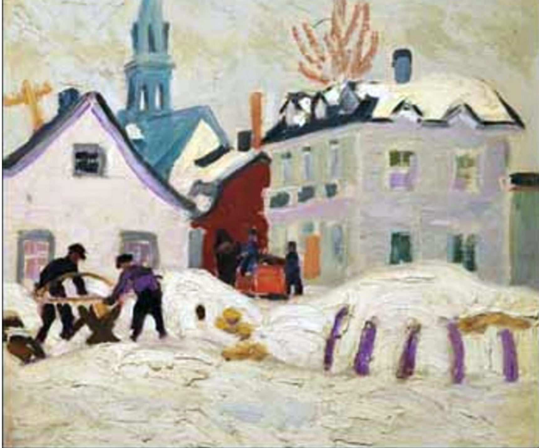
Scène d'hiver à St-Tite-des-Caps, Randolph Stanley Hewton, 1928? Huile sur canvas, 76 000$ incluant la prime d'achat.