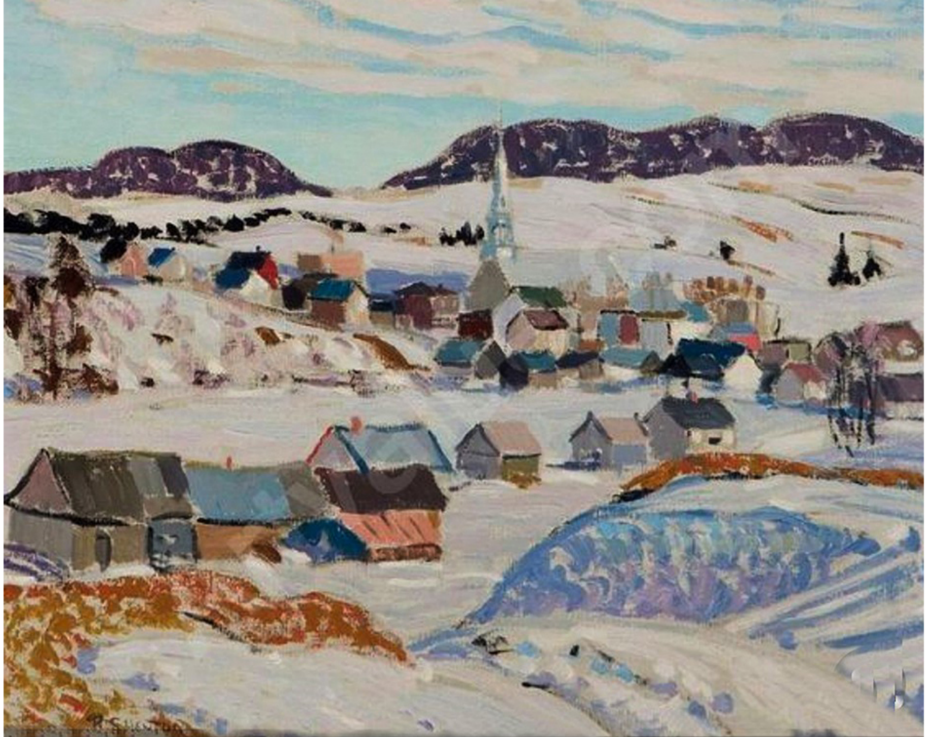
St-Tite-des-Caps par Randolf Stanley Hewton