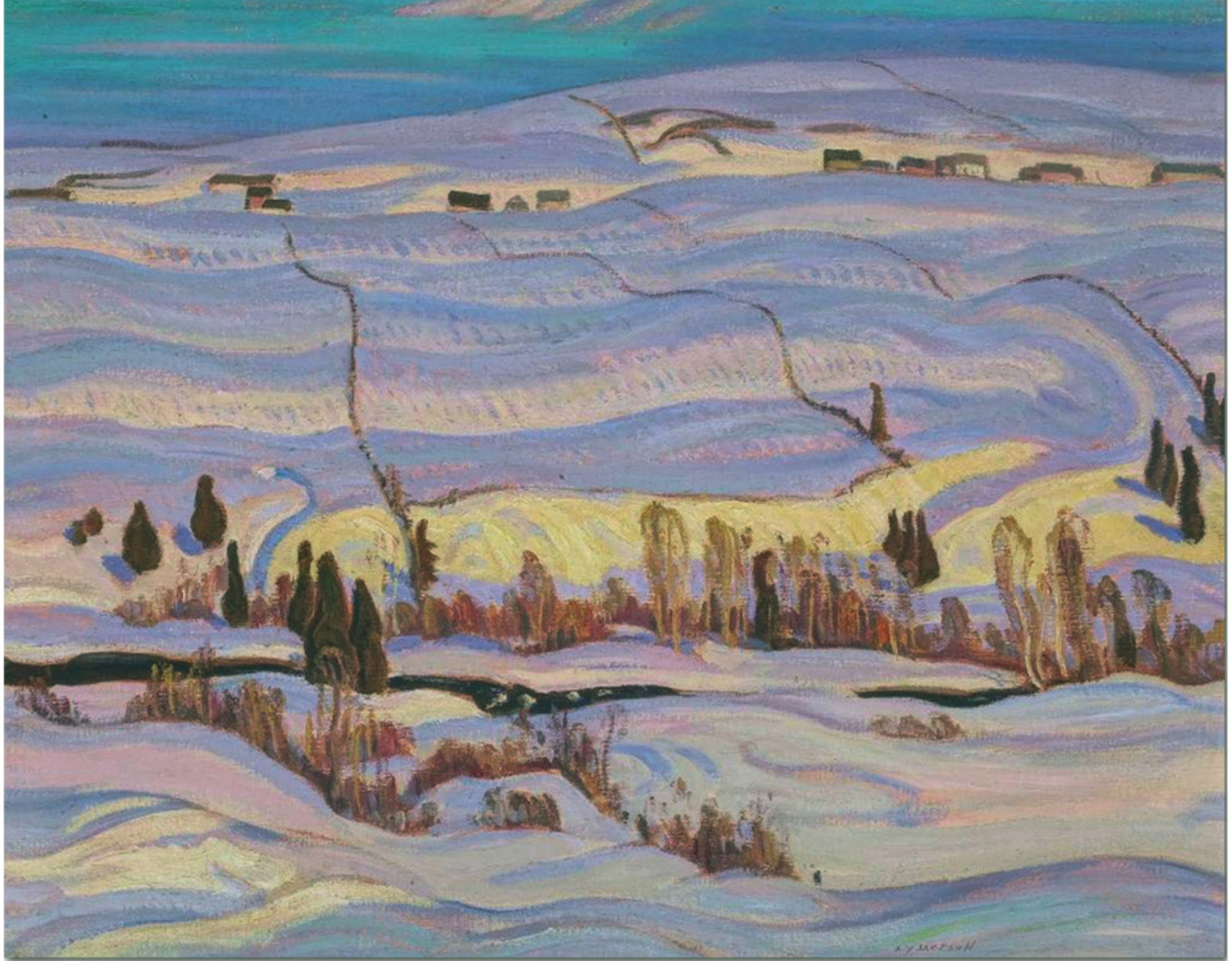
Morning, St-Tite-des-Caps par Alexander Young (A. Y.) Jackson, 1939 Huile sur toile, 26" x 32"