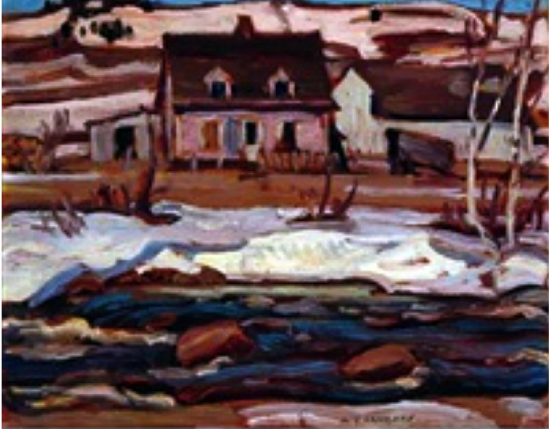
Quebec Farm, St-Tite-des-Caps par Alexander Young Jackson