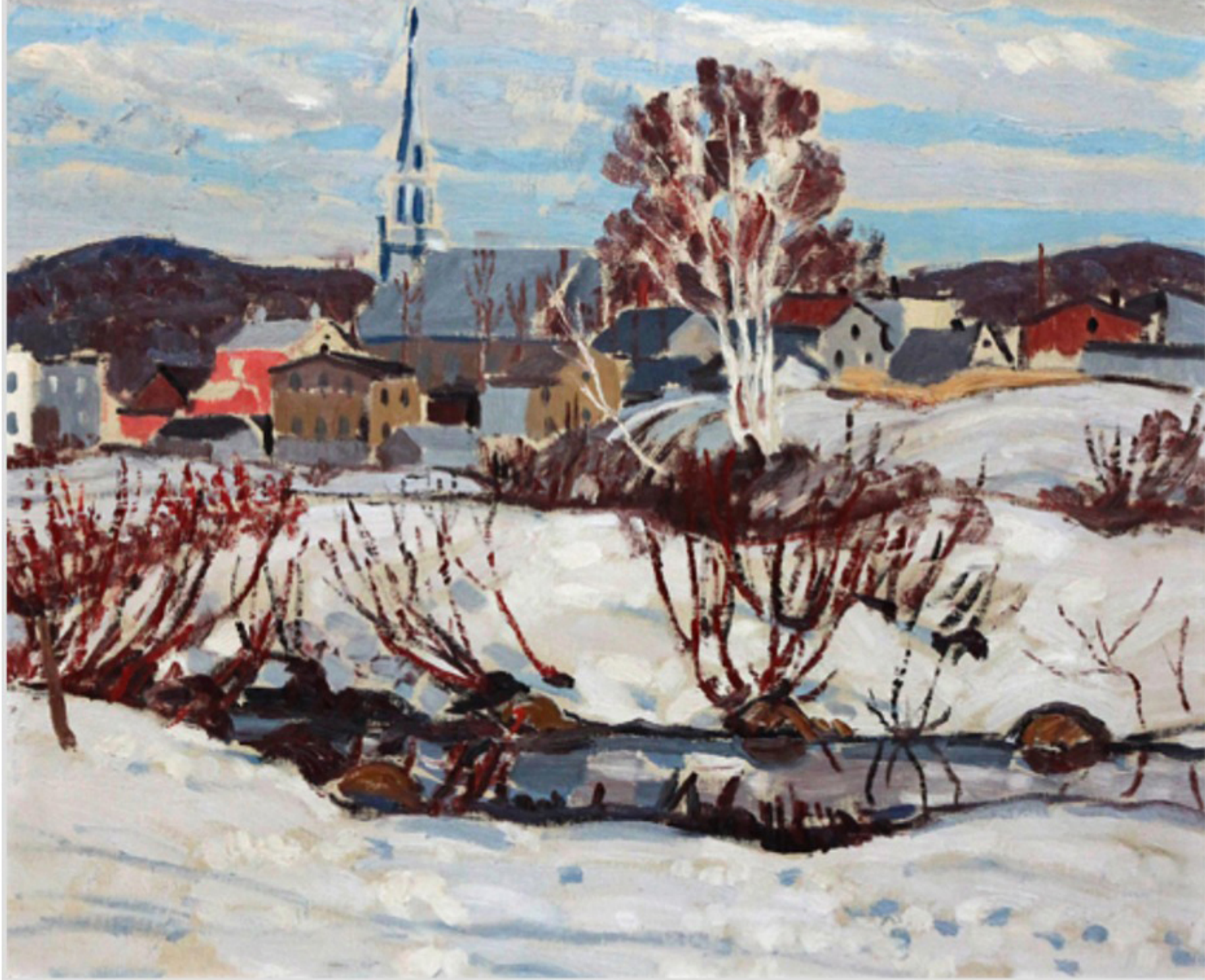
St-Tite-des-Caps, Randolph Stanley Hewton, 1928?