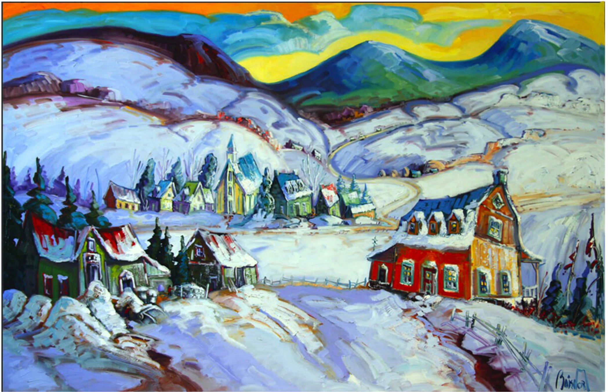
Hiver à Saint-Tite-des-Caps par Normand Boisvert, 2017