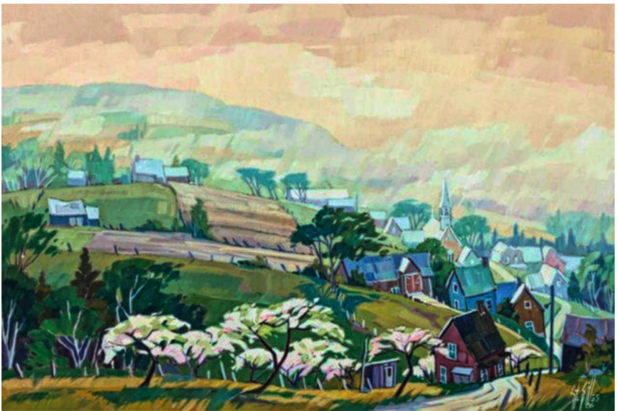
St-Tite-des-Caps par Antoine St-Gilles, 1986