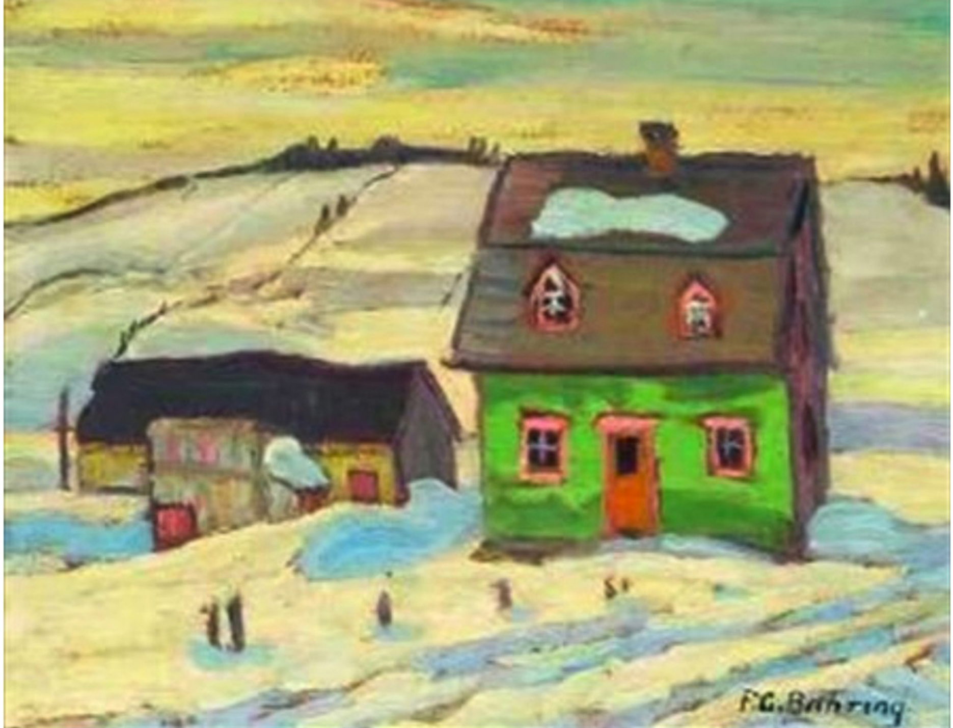
St-Tite-des-Caps, Québec par Sir Frederick Grant Banting, 1937 Vendue 25 000$