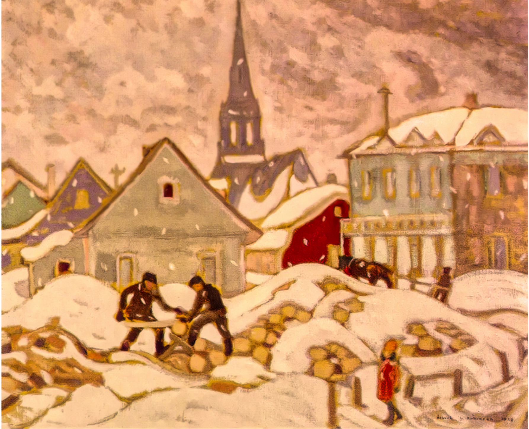
Sciage du bois, St-Tite-des-Caps par Albert H. Robinson 1928