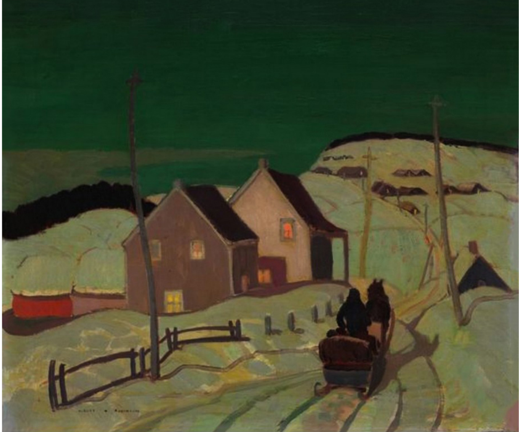
Moonlight, St-Tite-des-Caps par Albert H. Robinson 1929