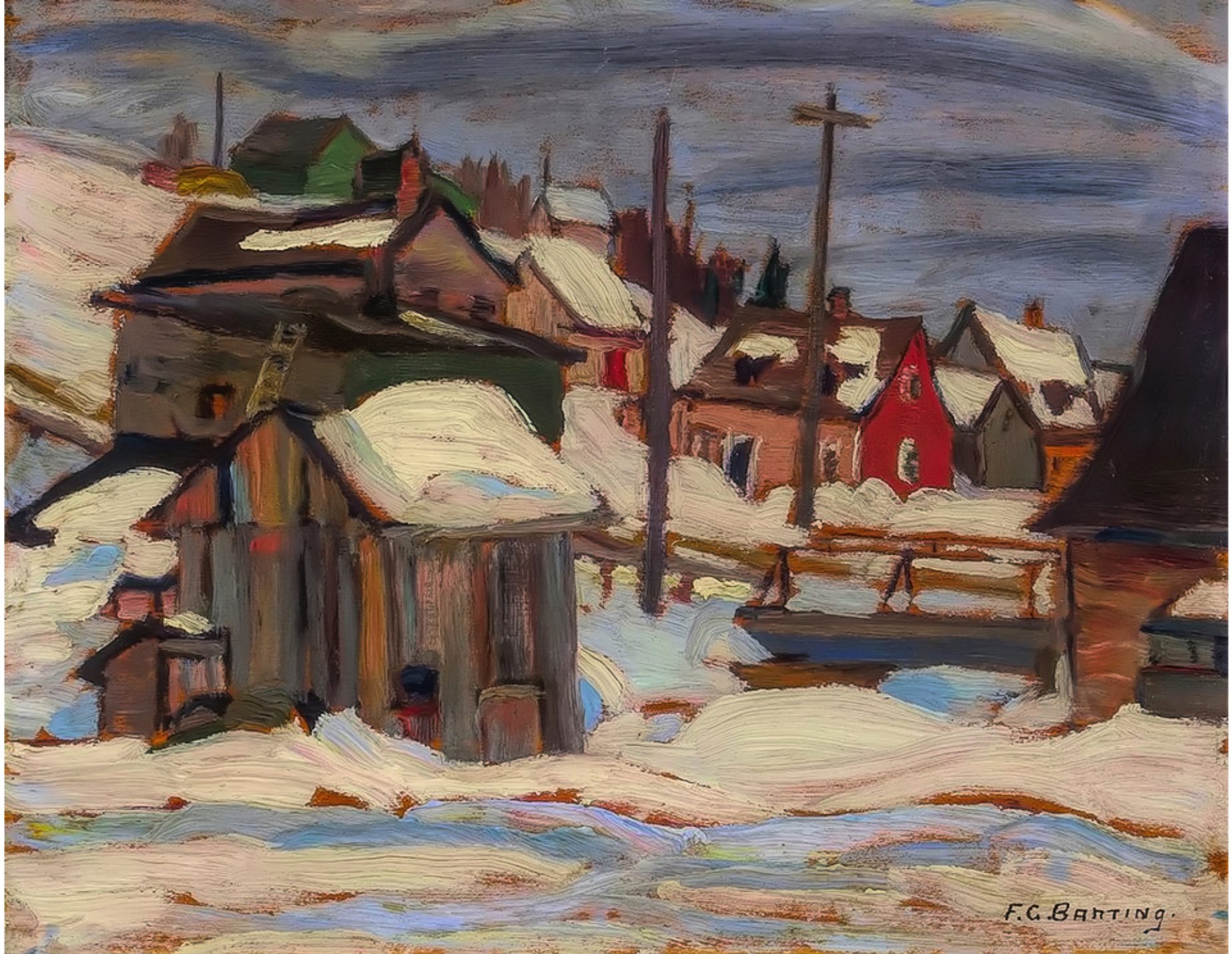
St-Tite-des-Caps, Québec par Sir Frederic Banting 1937 Huile 30 000$