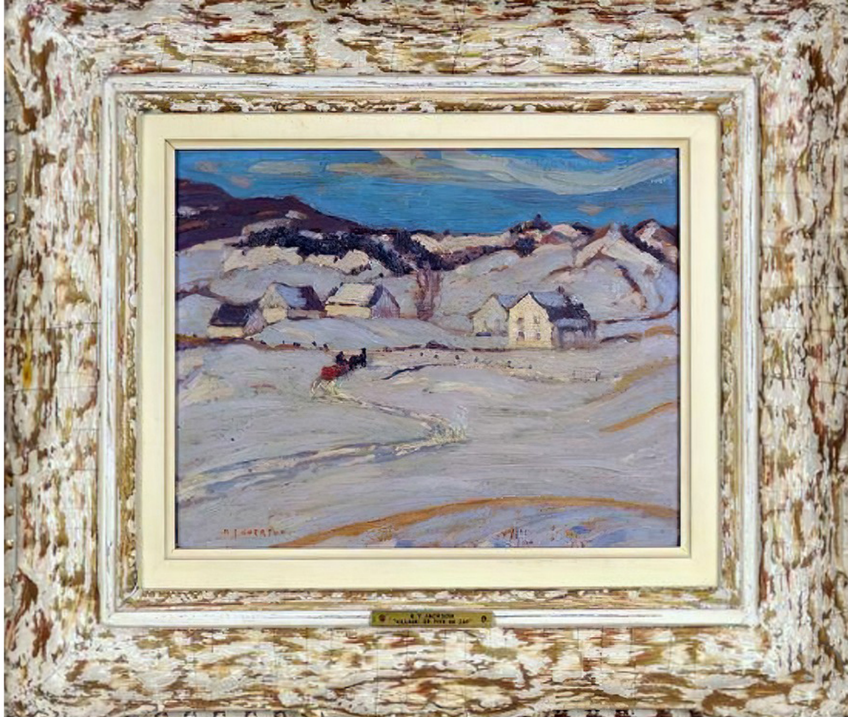
Village, St-Tite-des-Caps par Alexander Young Jackson, 1935