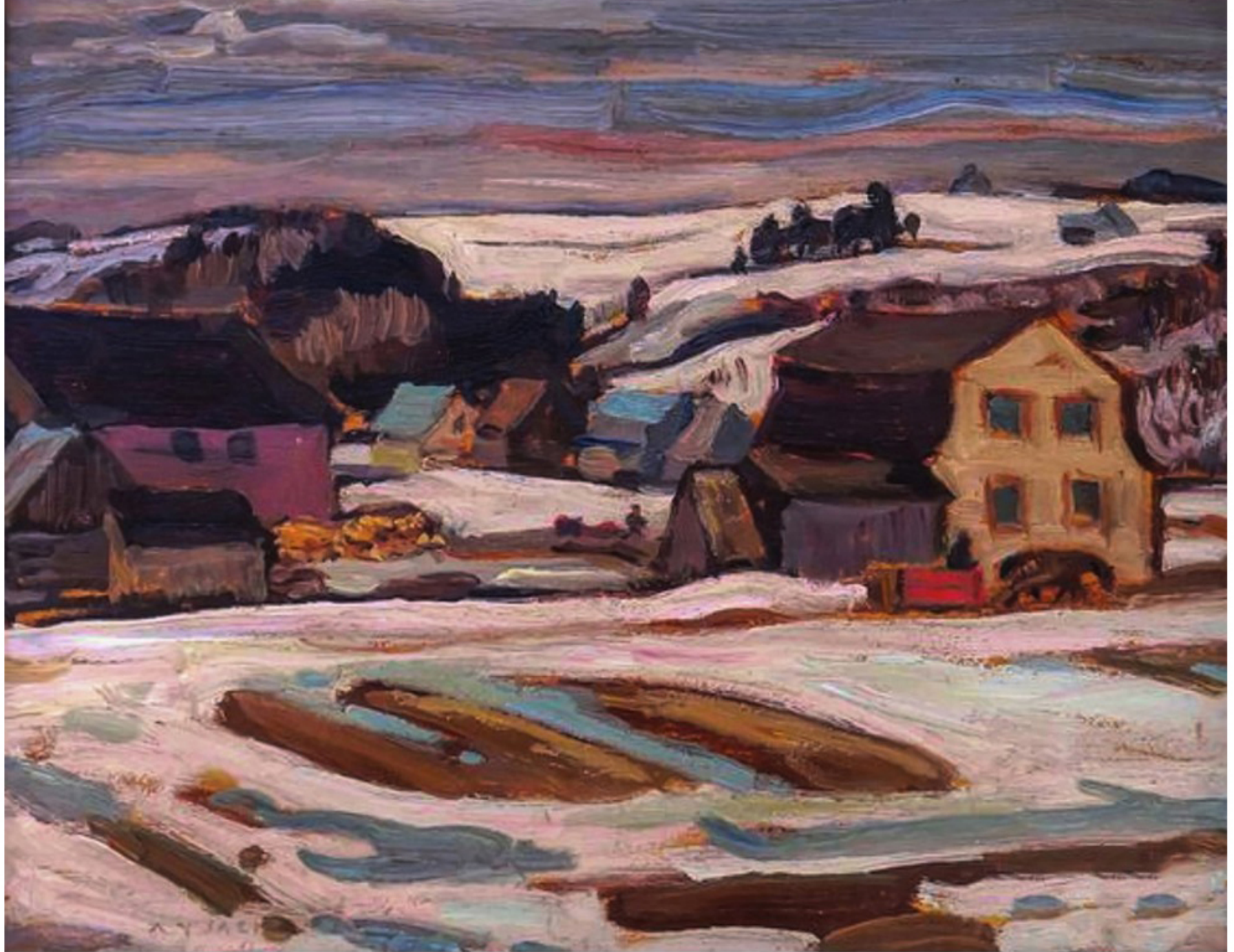
Valley Farm, St-Tite-des-Caps par Alexander Young Jackson, 1933