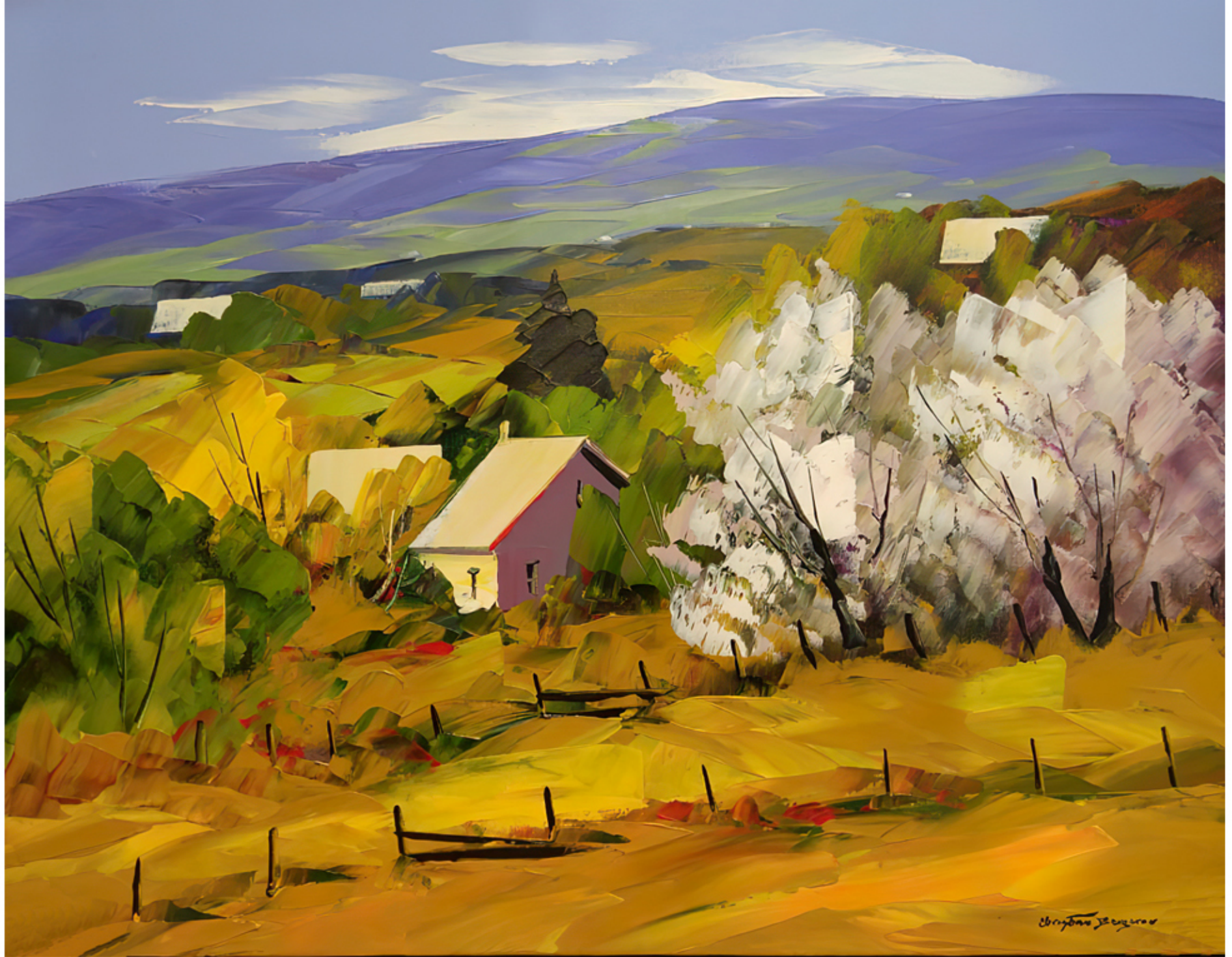
À St-Tite-des-Caps par Christian Bergeron