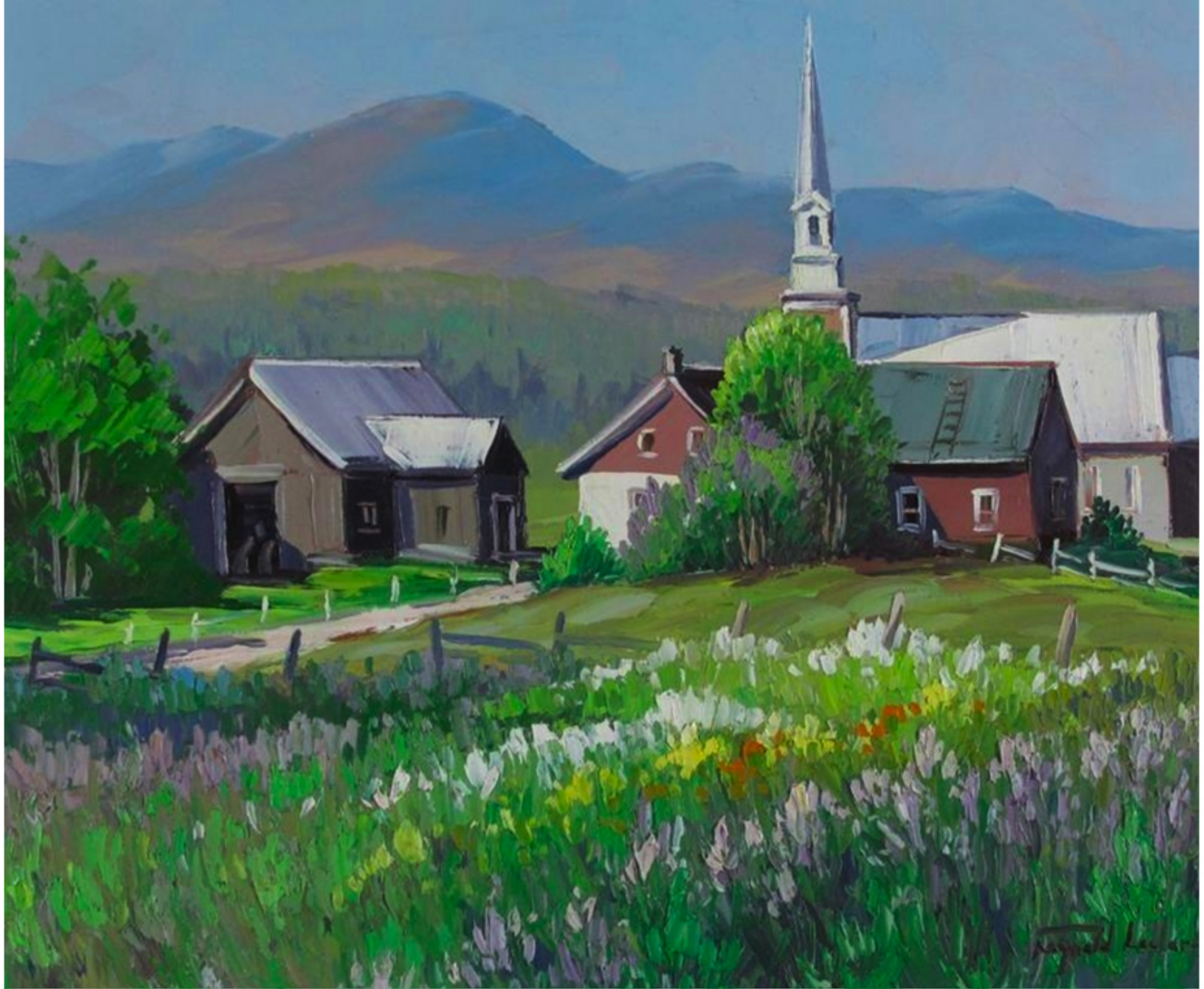
St-Tite-des-Caps, Charlevoix par Raynald Leclerc