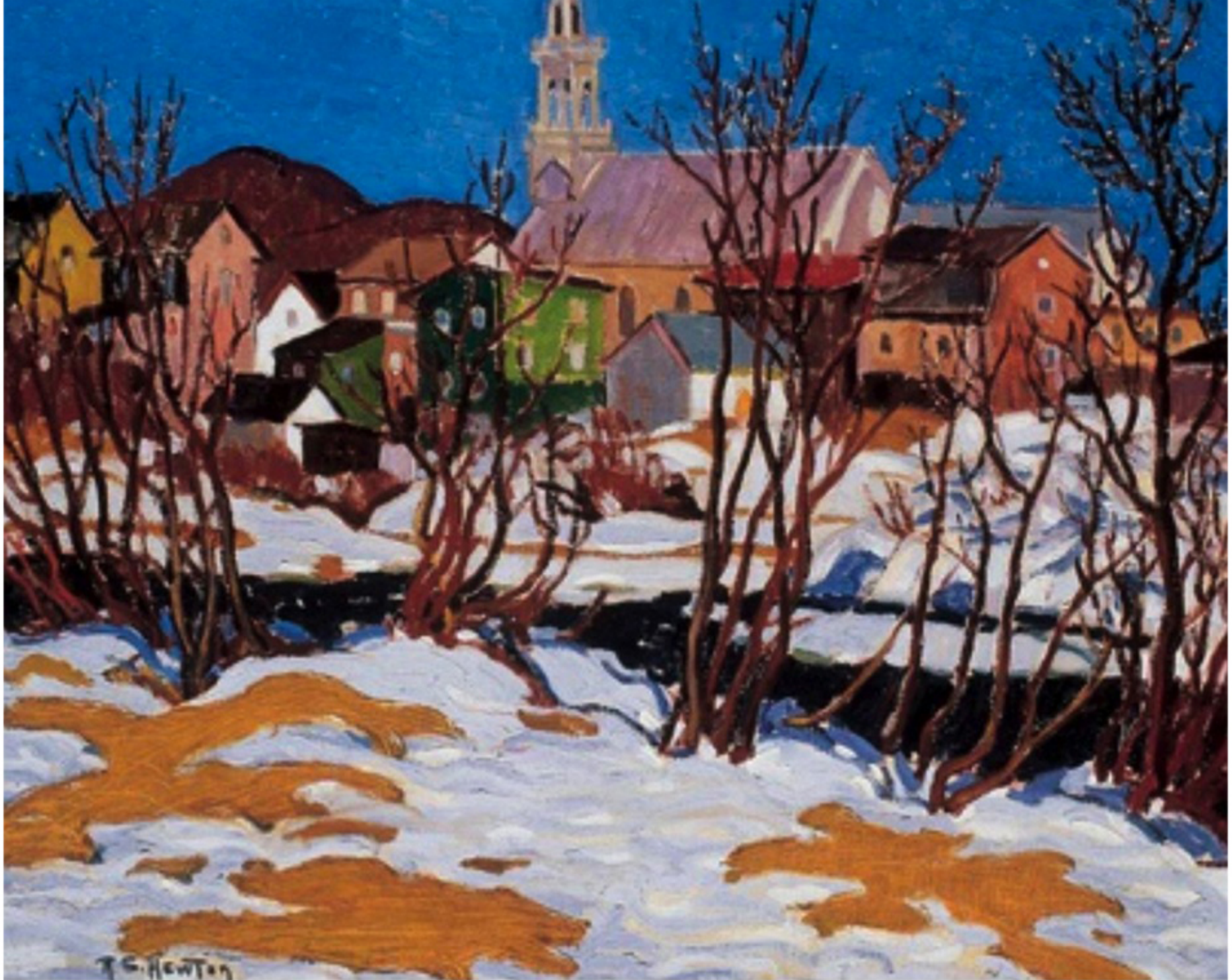
St-Tite-des-Caps, Randolph Stanley Hewton, 1928?