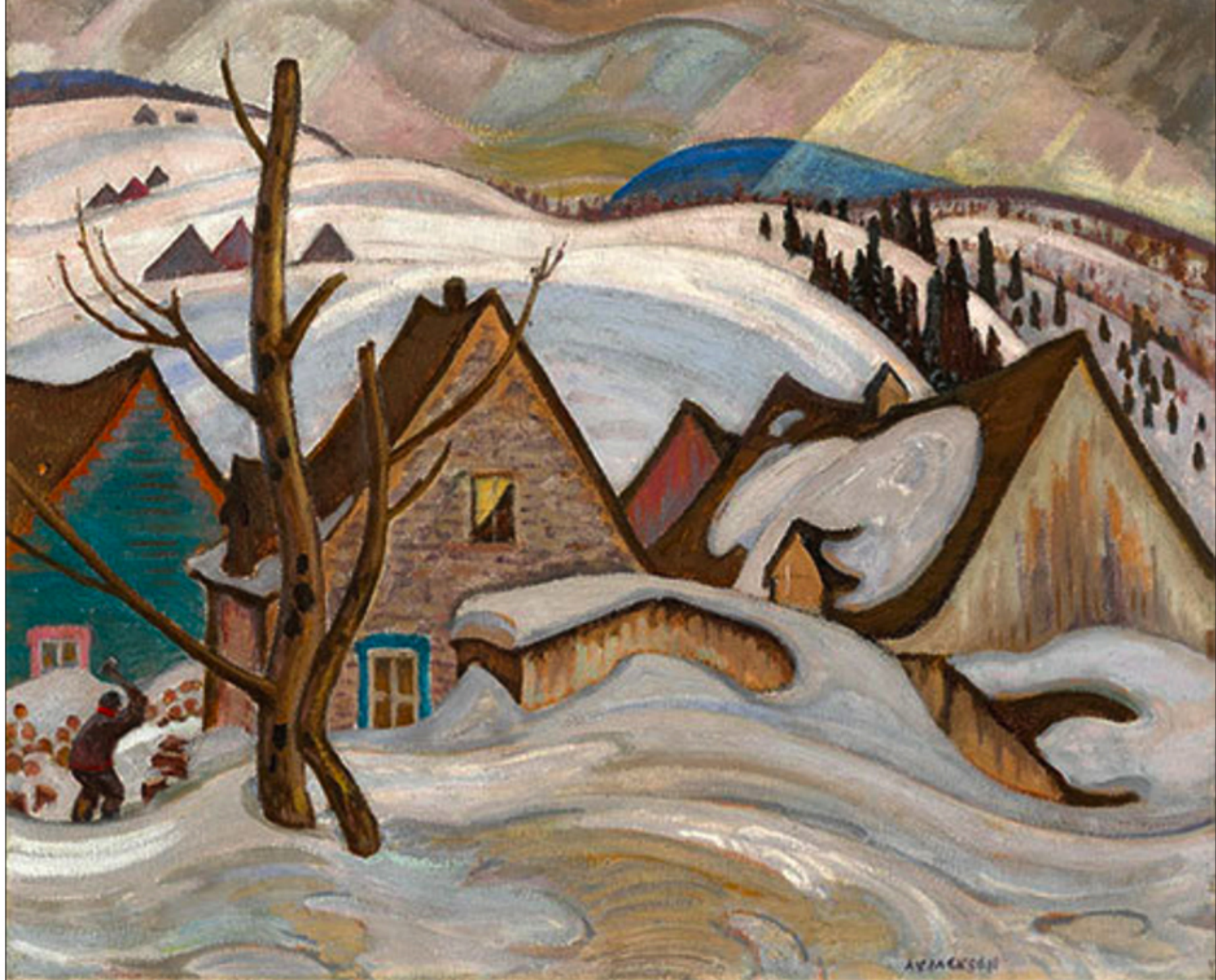
St-Tite-des-Caps par Alexander Young Jackson, 1930