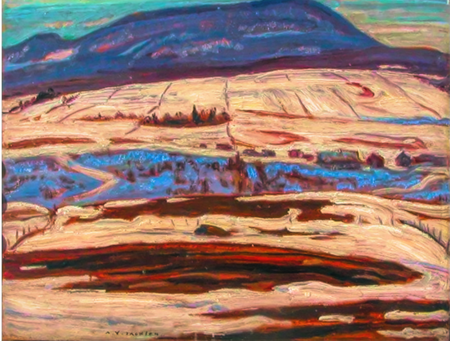
Morning, St-Tite-des-Caps par Alexander Young (A. Y.) Jackson Huile sur toile, 8.5" x 10.5"