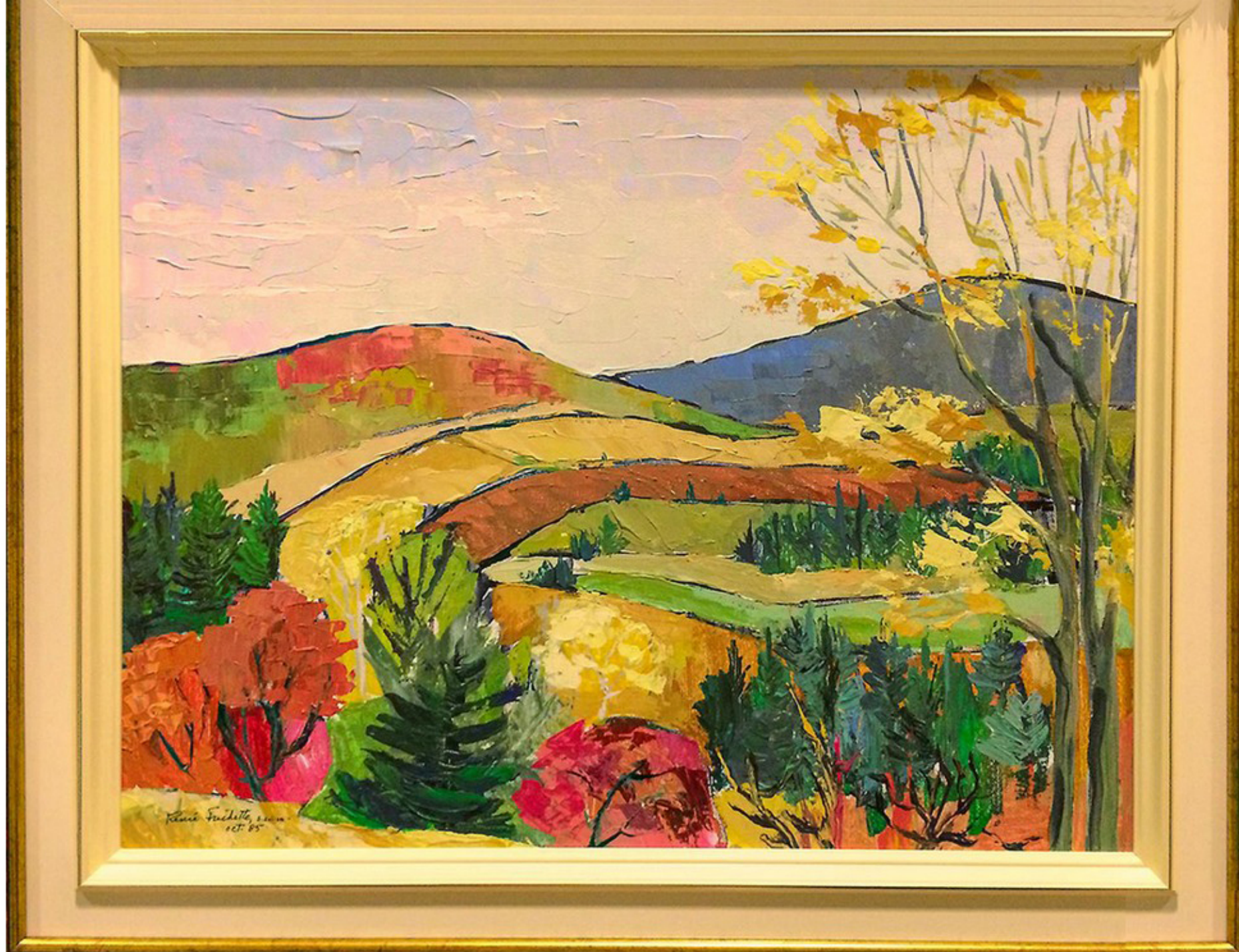
Saint-Tite-des-Caps par soeur Renée Fréchette, s.c.i.m, 1985 Acrylique sur toile cartonnée, peint à la spatule.