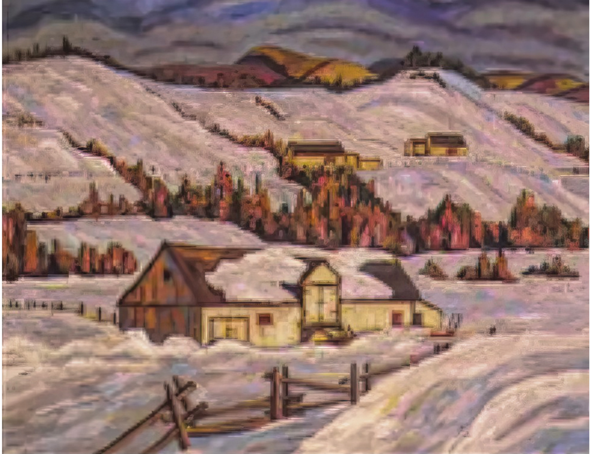
Ferme québécoise, St-Tite-des-Caps Sir Frederic Grant Banting