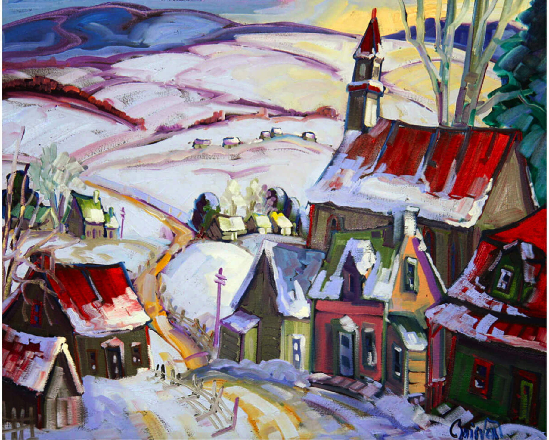
St-Tite-des-Caps par Normand Boisvert, 2014