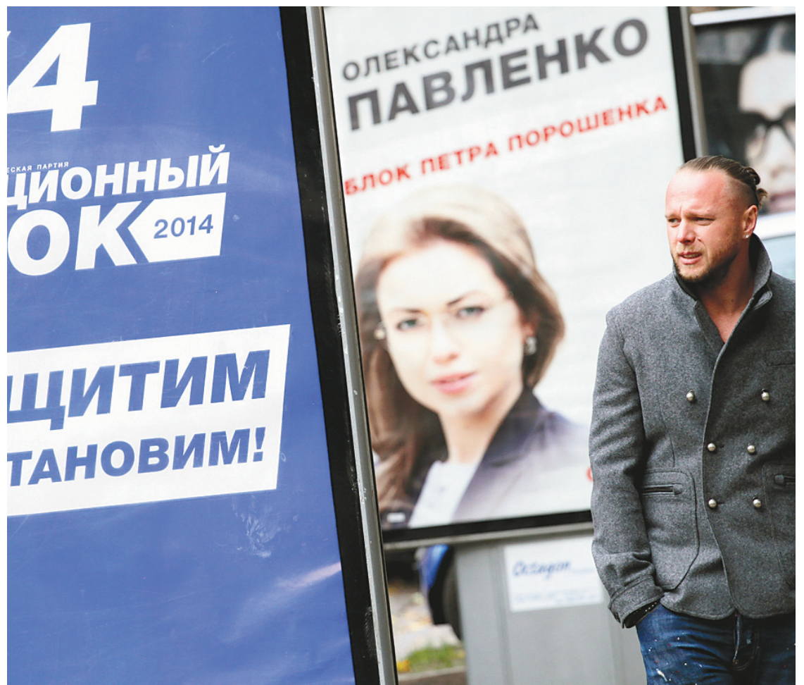
Le centre de Kiev a été placardé d'affiches électorales.

Yves Bolduc préconise donc certains changements dans le système d'éducation mais n'imposera pas de chambardements comme en