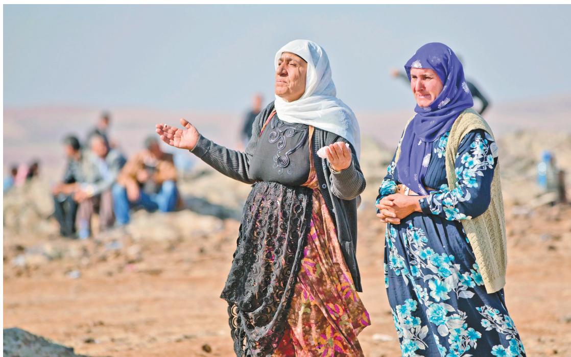
« Le plus noble d'entre vous, auprès d'Allah, est le plus pieux. »

Si Allah traite tout croyant en Lui et qui n'est pas forcément musulman de mécréant, comment peut-Il rassurer les humains dans le verset 69 de la sourate al-Maïda (« La table servie ») en disant : « ceux qui ont cru, ceux qui se sont judai-