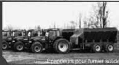
Epancheurs pour fumier solide