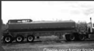
Citerne pour fumier liquide