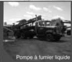
Pompe à fumier liquide