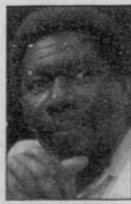
Le pianiste Oliver Jones: «L'occasion de rêver.»

«À 12 ans, se rappelle le réputé musicien de jazz, je ne comprenais rien à l'importance de la présence de Jackie Robinson dans une équipe de baseball professionnel. Je n'étais même pas certain que mon père comprenait quoi que ce soit à ce sport. Mais je n'oublierai jamais le regard qu'il avait ce jour-là: c'était le regard d'un homme fier de sa race. Je suis heureux d'avoir partagé ce moment