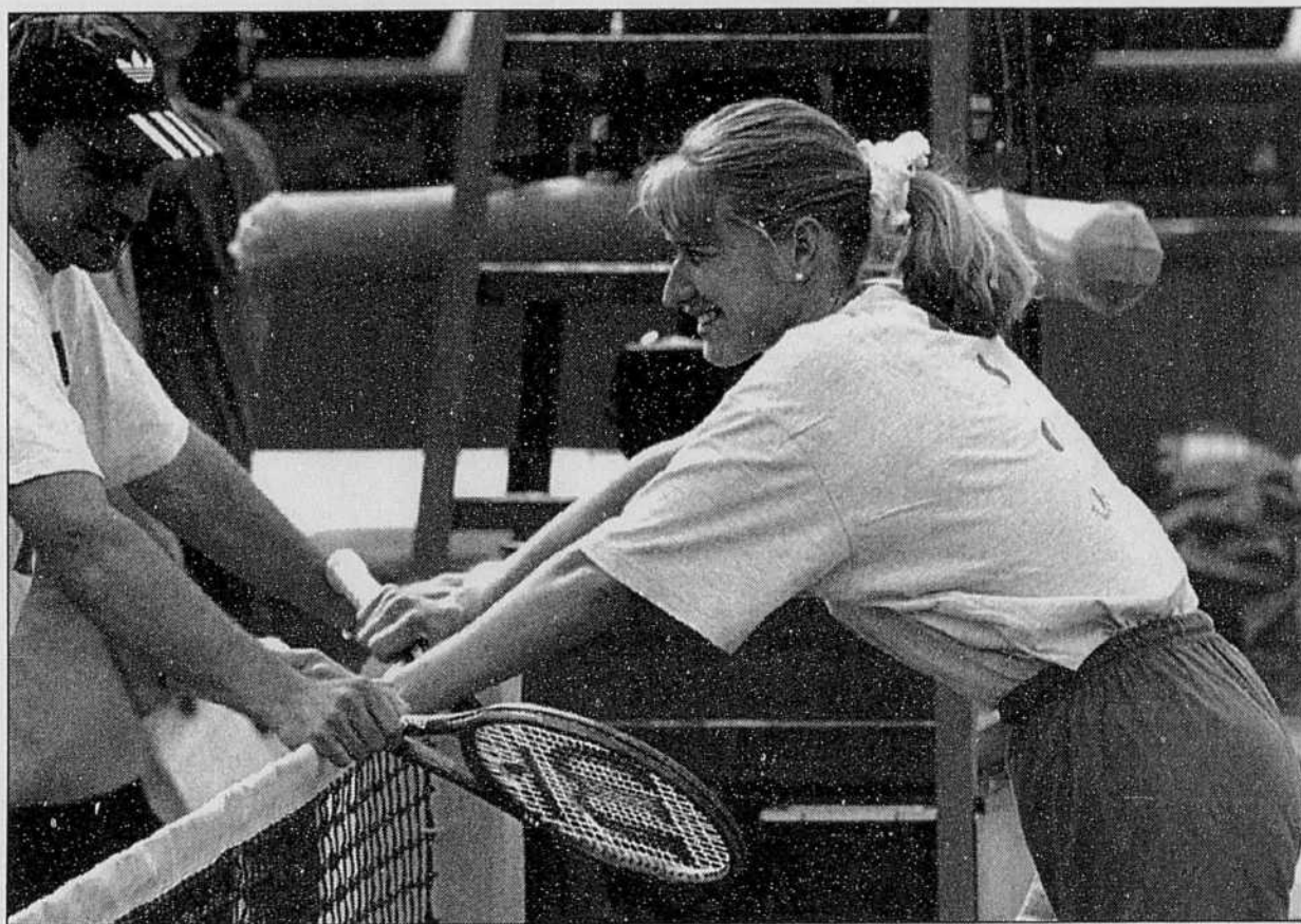
Steffi Graf tentera de conquérir un cinquième fois les courts de Roland-Garros.

«L'inflammation a pratiquement disparu. Muster jouera à 100 % de ses capacités à Paris», a affirmé le médecin.