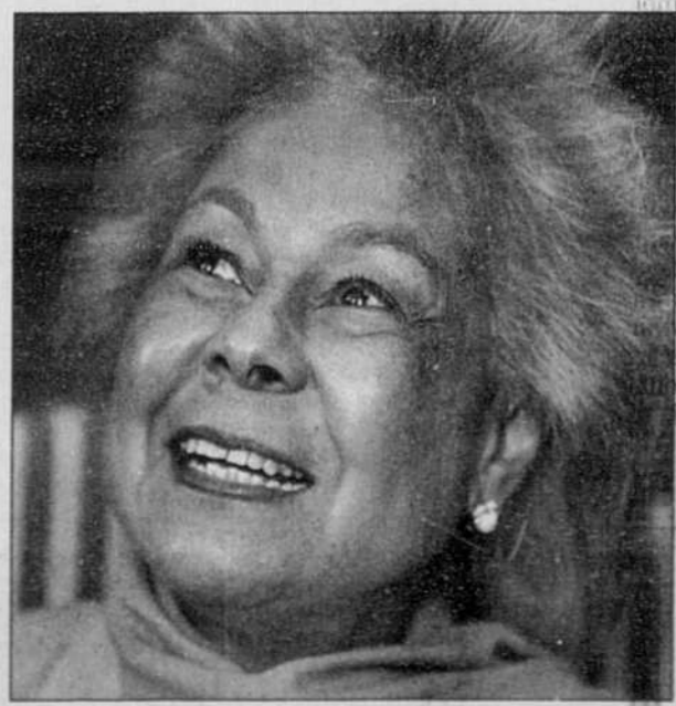
Rachel Robinson, la veuve de Jackie: «Garder l'esprit de Jackie vivant, c'est l'utiliser à bon escient et agir.»

Selon lui, la discrimination à Montréal depuis 1946 s'est déplacée de l'individuel à l'institutionnel. «Les dirigeants ont été dépassés par la venue massive des immigrants. Notre défi, comme société, est maintenant de donner l'exemple, d'établir des programmes et de trouver des leaders politiques représentatifs. En un mot, démontrer le dynamisme de la diversité. Montréal en a besoin.»