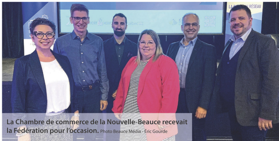
La Chambre de commerce de la Nouvelle-Beauce recevait la Fédération pour l'occasion.

Il était donc satisfait de la fréquentation à ces rencontres, malgré la difficulté de regrouper des gens d'affaires au même endroit. « C'est difficile de sortir ces gens-là parce qu'il y a une pénurie de main d'œuvre, ils sont au bureau tôt le matin et ressortent tard le soir. Les avoir ici ce matin est pour nous un bon moment d'échanges. L'économie forte que l'on a au Québec est possible grâce à ces gens-là. On leur demande énormément avec la transition énergétique, écologique, en plus de leur ajouter de nouvelles responsabilités », résume-t-il en conclusion.