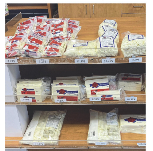
Le fromage en grains ou en bloc de la Fromagerie Gilbert fait partie des finalistes.