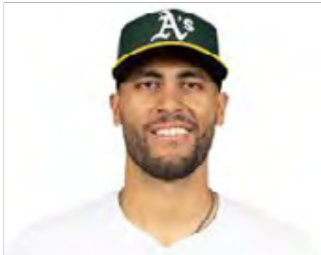
Abraham Toro (M) A's d'Oakland