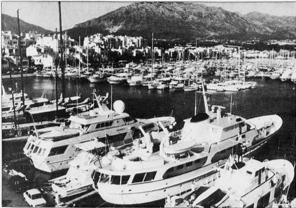
La station balnéaire espagnole Puerto Bances.

Faut-il le dire : l'Ouest aime le fric. Le choc n'est donc pas tant