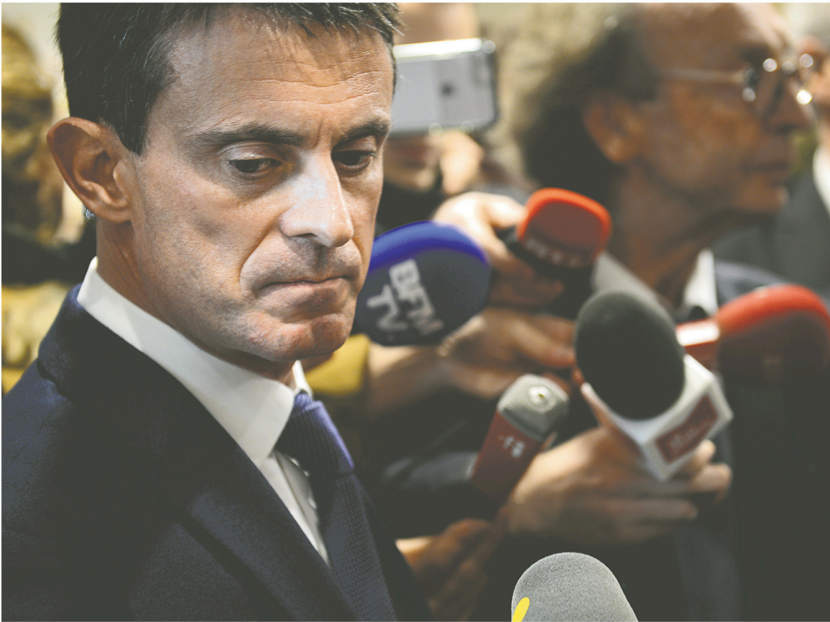
SÉBASTIEN BOZON AGENCE FRANCE-PRESSE

CAHIER B > LE DEVOIR, LES SAMEDI 10 ET DIMANCHE 11 DÉCEMBRE 2016