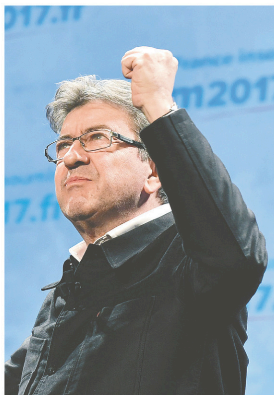
Jean-Luc Mélenchon et Emmanuel Macron ont choisi de boycotter la primaire de la gauche. Ces deux candidats d'extrême gauche et de centre gauche ont fait le choix de se présenter directement à la présidentielle.

L'ennui, c'est que cette envie ne s'est toujours pas manifestée et que l'on assiste même au