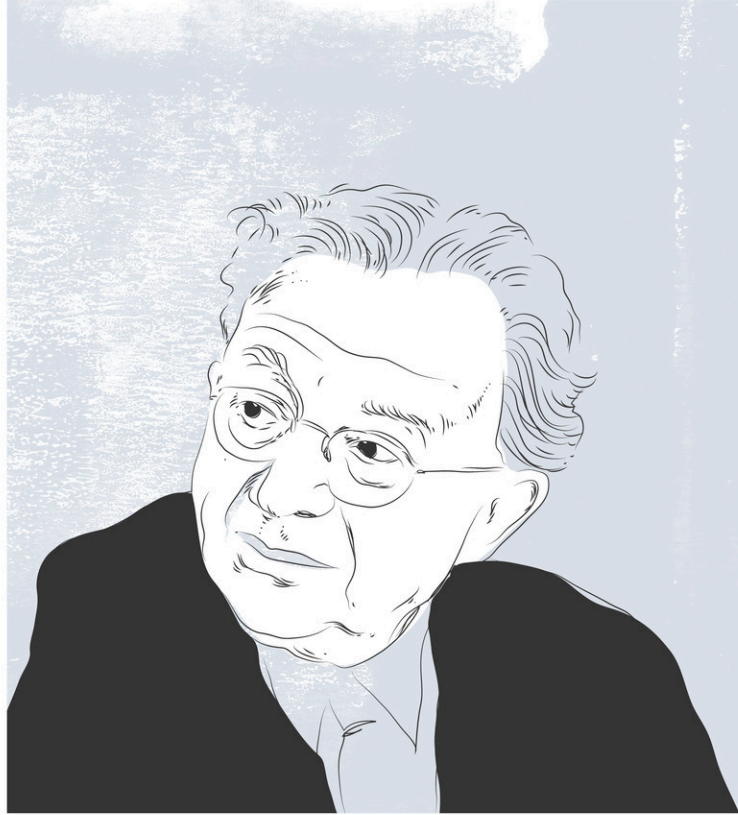
Au cours des années 1930 et 1940, des théoriciens allemands tels qu'Erich Fromm (à gauche), Theodor Adorno et d'autres ont tenté de comprendre les origines et le fonctionnement du fascisme.

Cet échec s'explique simultanément par l'inertie des institutions journalistiques ainsi que par ses récentes évolutions. Les écoles de journalisme, encore aujourd'hui, sont dominées par un enseignement mettant l'accent sur l'objectivité, perspective qui s'impose dans les années 1920, alors que les écoles de journalisme se multiplient et que le journalisme se professionnalise. Dans ces écoles, on n'enseigne pas les travaux de théoriciens politiques des années 1930, dont les perspectives ne sont pas objectives. Néanmoins, tout au long du XX e siècle, différents courants journalistiques ont exploré des perspectives irréductibles à l'objectivité, renouant