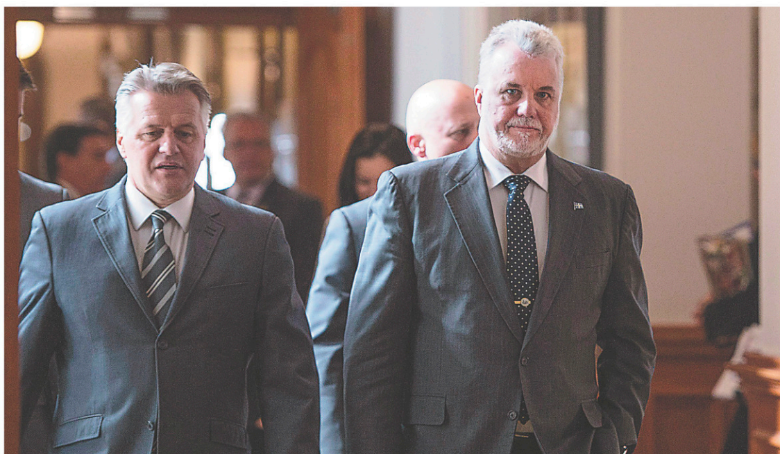
Le ministre des Transports, Laurent Lessard ici, aux côtés du premier ministre, Philippe Couillard, a passé la session avec une épée de Damoclès au-dessus de la tête.

Pour sa part, le ministre des Transports, Laurent Lessard, a passé la session avec une épée de Damoclès au-dessus de la tête. Ses liens