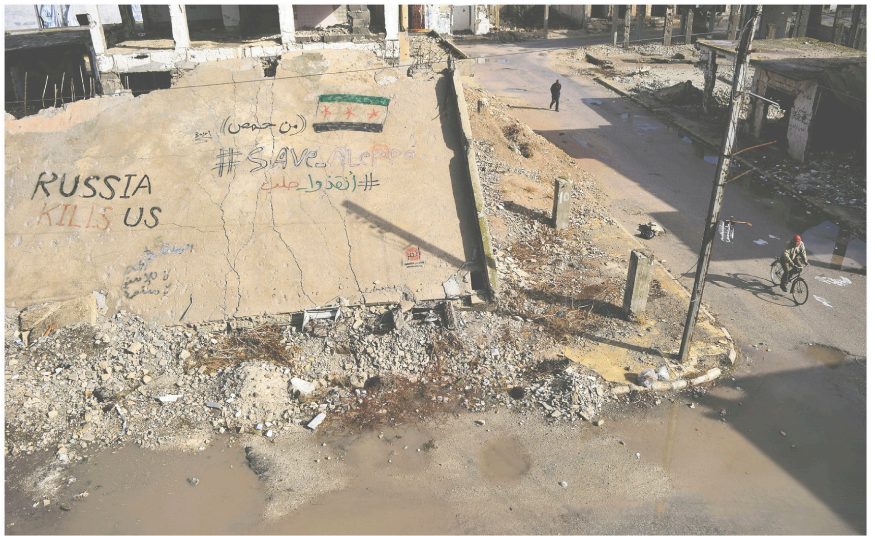
Un Syrien roule à vélo dans les rues de Talbisseh, dans la province de Homs devant les ruines d'un bâtiment détruit sur lequel sont écrits en arabe et en anglais « De Homs, sauvez Alep » et « La Russie nous tue ».

Mais l'impact est plus profond encore. Dix jours après l'élection, le SPLC recensait 867 incidents haineux, d'un bout à l'autre du pays. Les femmes ne représentent qu'une fraction de ces incidents : des actes ou des propos antisémites, antimusulmans, anti-LGBT, anti-Afro-Américain, anti-immigrant. Le discours décomplexé est celui des extrêmes (à droite comme à gauche). Il pourrait avoir des effets durables sur le profil des élites et des politiciens, et accroître plus encore le découplage de la société en castes, tandis que l'ascenseur social du rêve américain se grippe.