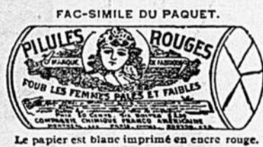
Le papier est blanc imprimé en encres rouges.

Dépt. Méd. No. 274 RUE ST-DENIS, MONTREAL.