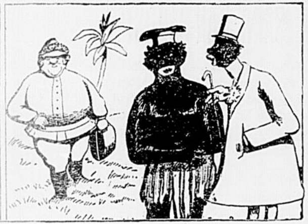
— Papa, je t'amène celui que tu payes si grassement depuis cinq ans! Tu vois, il en a profité; il est à point. nous allons faire un festin de roi