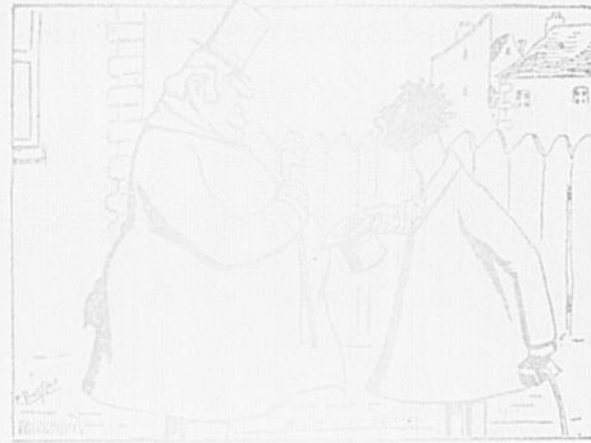
— Depuis cinq ans que je suis en possession de la civilisation, j'espère que vous allez venir à bout de me rendre dans votre foyer? Oh! oui, mais il faut d'abord apprendre à aimer les blancs.