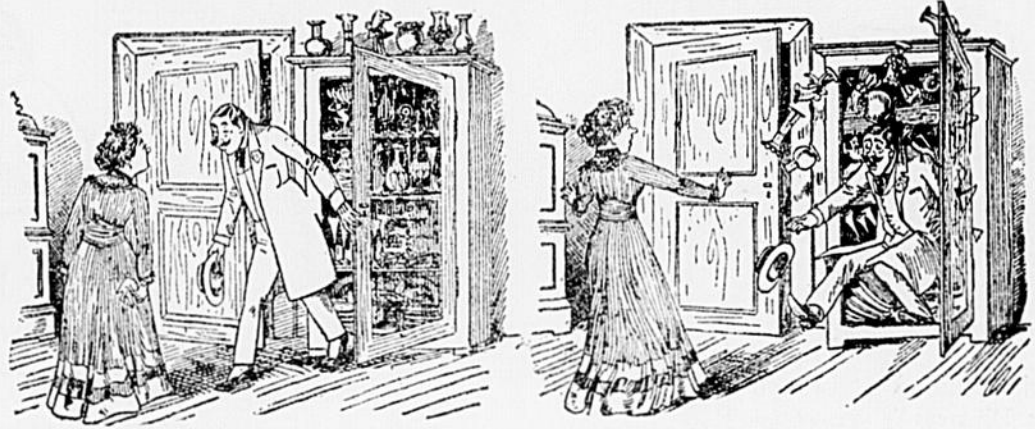
Dans un ménage à trois, quand le mari entre, l'amant se fourre où il peut, hein?