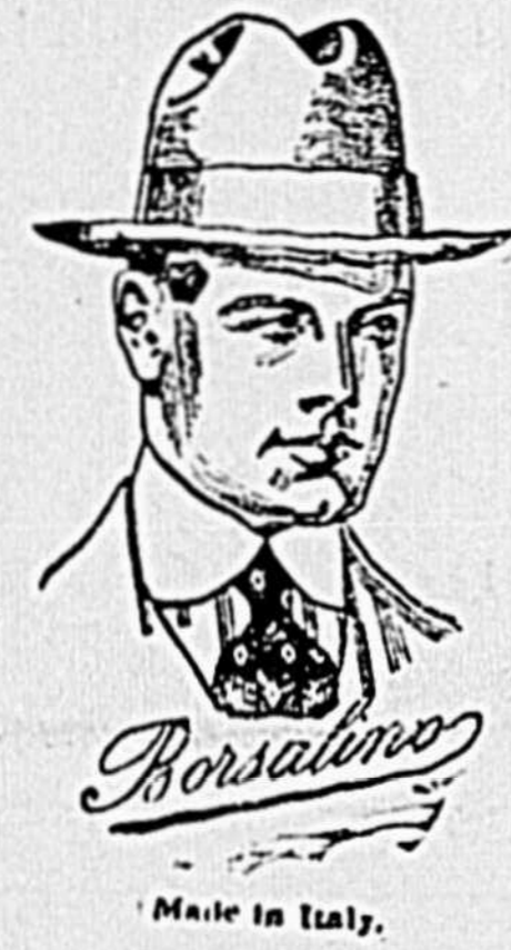
LE CHAPEAU 'BORSALINO'