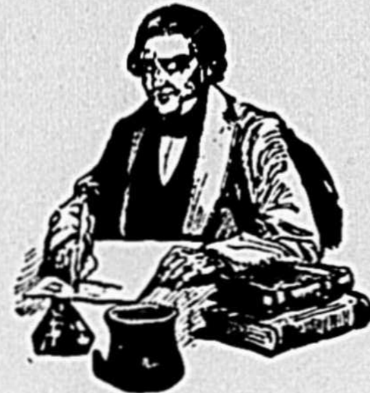
Mieux vaut une activité un peu aventureuse qu'une sagesse sans initiative qui tourne souvent à l'impuissance. SAINT THOMAS

Je ne suis pas encore revenu de ma surprise. Vous connaissez peu ce philosophe qui a vécu il y a bien près de six cents ans, que ses contemporains avaient surnommé le "boeuf muet" et que Léon XIII a salué comme la Lumière de l'Eglise.