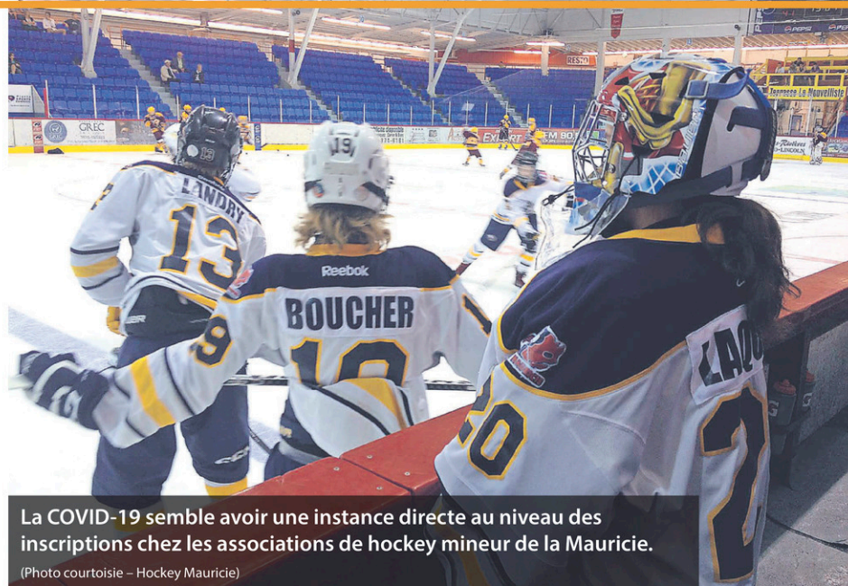
La COVID-19 semble avoir une instance directe au niveau des inscriptions chez les associations de hockey mineur de la Mauricie.

«On ne jouera pas à l'autruche la tête dans le sable, c'est sûr qu'on s'attend à avoir des cas de