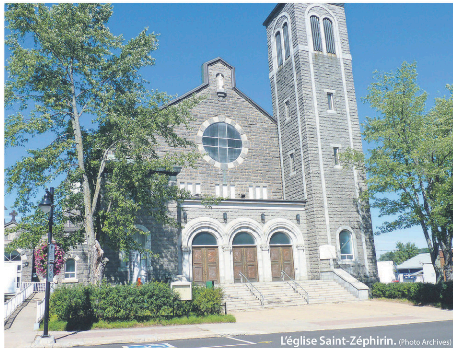
L'église Saint-Zéphirin.

« Il y a beaucoup de conditions. La première serait probablement de devenir propriétaire de la bâtisse et d'y aménager la bibliothèque municipale », avait indiqué d'entrée de jeu le maire, Pierre-David Tremblay, lors de l'assemblée