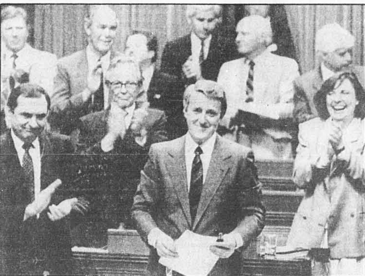
C'est un Brian Mulroney visiblement satisfait qui, en 1987, s'appretait à déposer aux Communes le texte de l'accord.

95C.(1) La déclaration portant qu'un accord visé au paragraphe 95B(1) a force de loi se fait par proclamation du gouverneur général sous le grand sceau du Canada, autorisée par des résolutions du Sénat, de la Chambre des