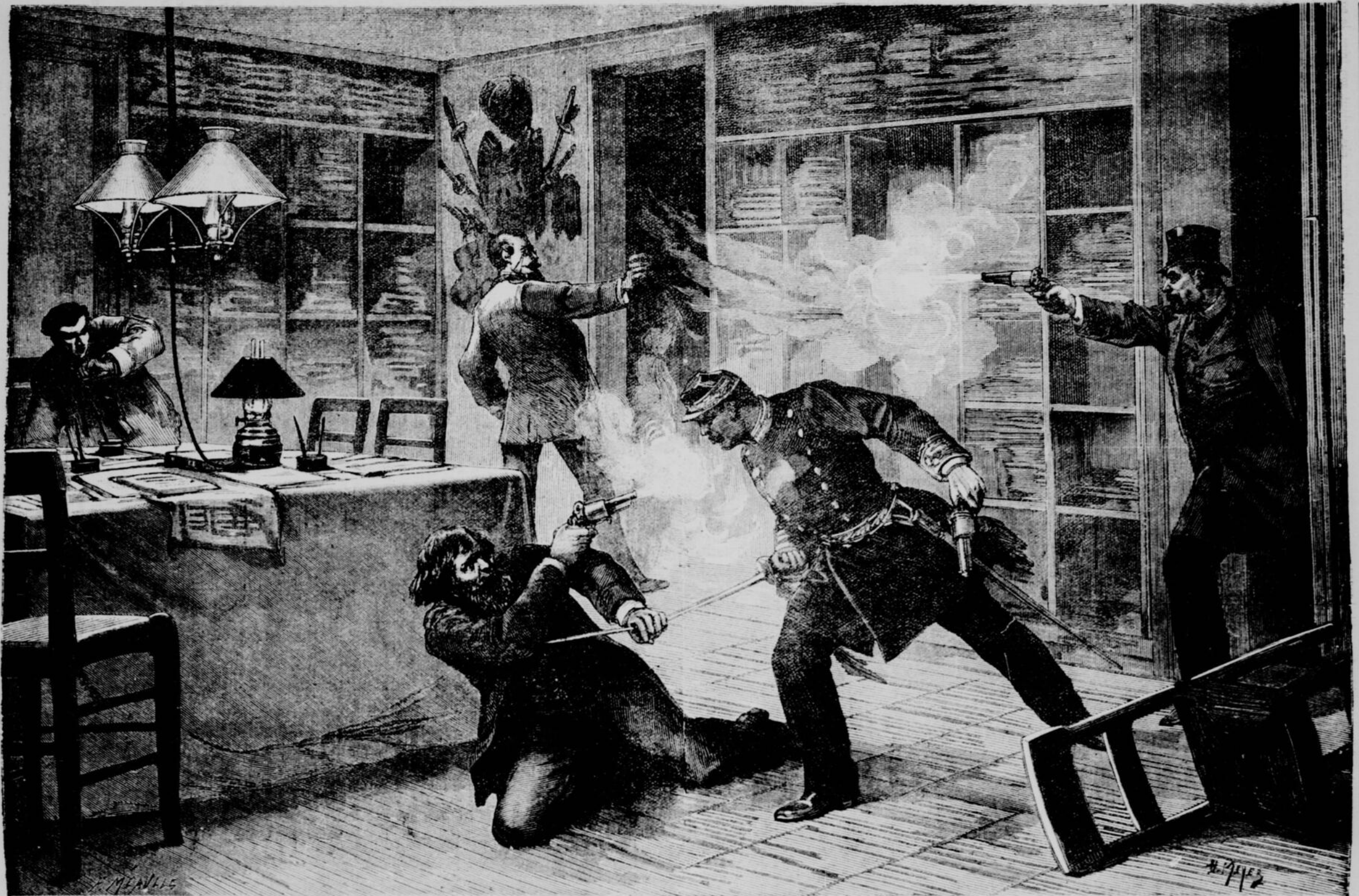
PARIS. — UN DRAME SANGLANT DANS LES BUREAUX DU JOURNAL LE CRI DU PEUPLE