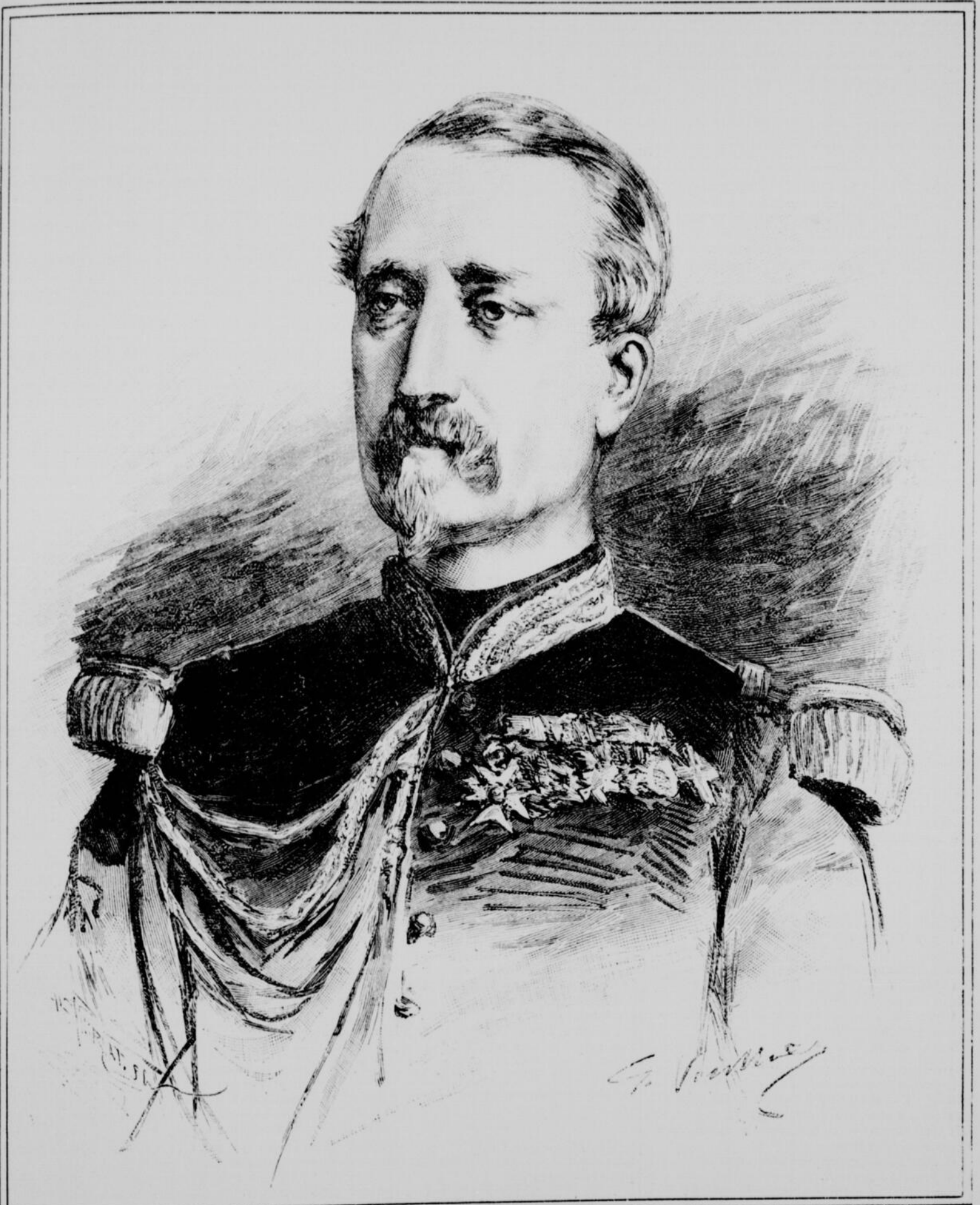
LE GÉNÉRAL LEWAL, LE NOUVEAU MINISTRE DE LA GUERRE EN FRANCE.

ABONNEMENTS : Six mois : $1.50. — Un an : $3.00.