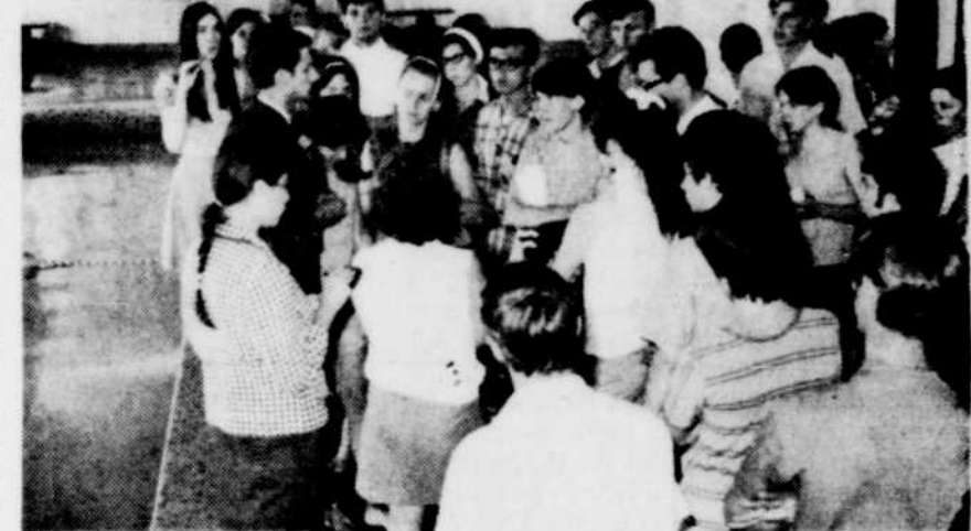
EN VISITE — Les enquêteurs qui se rendront dans les foyers de Drummondville au cours des prochaines semaines ont visité le centre culturel et sportif, hier, pour se renseigner adéquatement sur les services offerts. On voit ici le groupe, alors qu'il visitait la piscine intérieure du centre.

Cette enquête doit théoriquement se financer par la vente de cartes de membres du centre, lesquelles donneront droit, à leur détenteur, à plusieurs avantages particuliers.