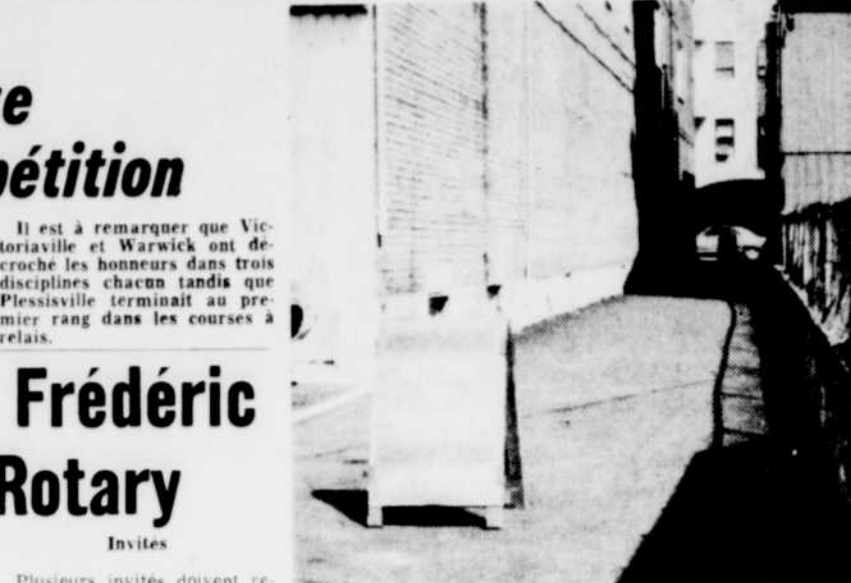
POUR LES PIETONS SEULEMENT — Les piétons sont maintenant en mesure d'atteindre directement la rue Notre-Dame via le stationnement Demers. L'initiative de la ville de Victoriaville sera sans doute accueillie avec grande satisfaction surtout aux heures d'affluence. La voie d'accès longe le magasin Reitman's. Aucun véhicule n'a cependant droit d'y circuler sous peine d'amende.

Cette tâche, selon Me Raymond, est l'une des plus importantes qui soit pour assurer le bien-être des vieillards.