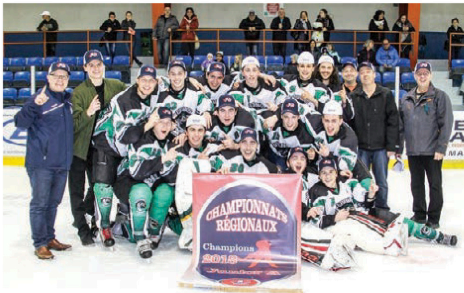
Les Riverains de Bécancour ont atteint la finale aux championnats interrégionaux.

Les Amiraux de Nicolet (Nicolet-Bécancour), dans le Midget BB, ont perdu leur série qui s'est rendue à la limite des trois matchs contre les Sieurs de Mauricie-Ouest. Les Sieurs de Trois-Rivières Ouest, qui comptaient quelques joueurs de la Rive-Sud, ont été balayés en finale Atome BB contre le Boum du Nord.