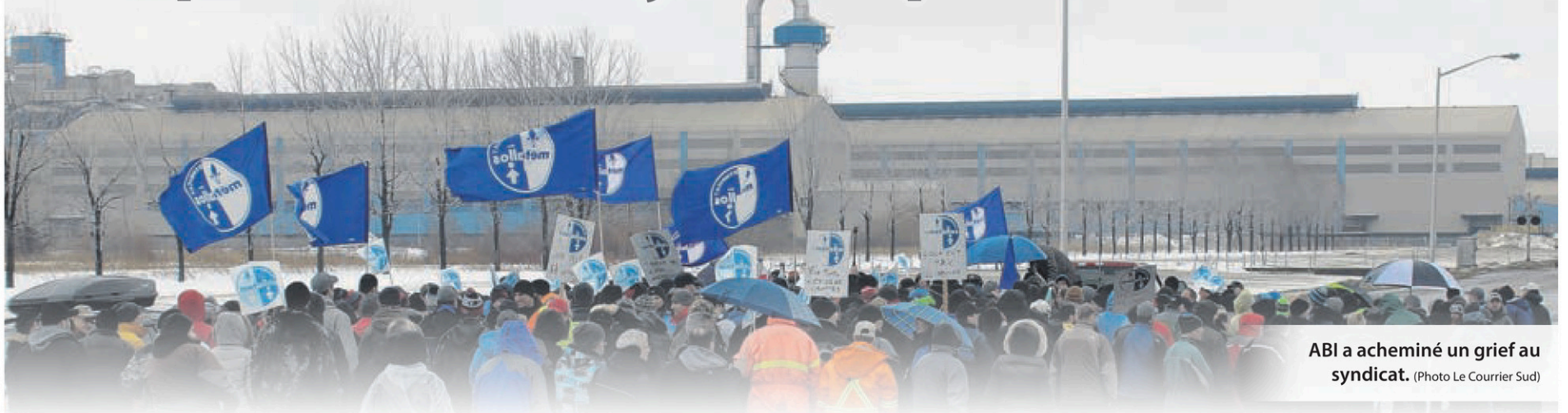
ABI a acheminé un grief au syndicat.