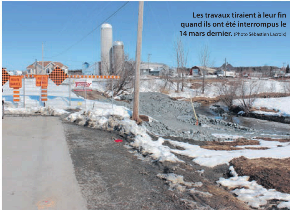
Les travaux tiraient à leur fin quand ils ont été interrompus le 14 mars dernier.

Le MTQ souhaite également que le niveau de l'eau de la rivière Blanche – qui longe le cratère – soit à son plus bas avant de reprendre les travaux d'enrochement des berges. « L'eau était