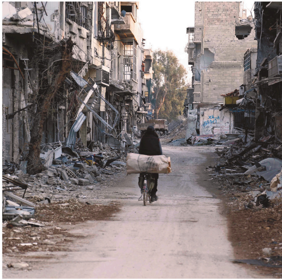
ABDULMONAM EASSA AGENCE FRANCE-PRESSE

« La répartition de la charge et de la responsabilité des réfugiés est restée immensément déséquilibrée et les moyens apportés sont loin d'avoir été à la mesure de l'aggravation rapide de la crise », déplore Amnesty, pour qui l'atti-