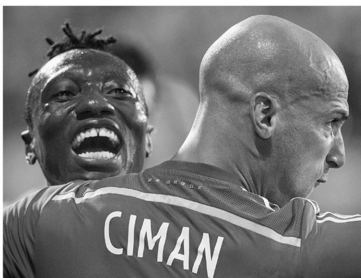
GRAHAM HUGHES LA PRESSE CANADIENNE

Le match de mercredi était le premier entre les deux rivaux depuis que l'Impact a hu-