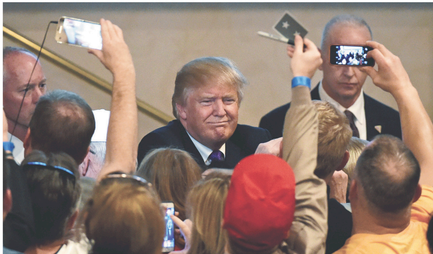
Donald Trump a rencontré ses partisans lundi soir, après les primaires dans le Nevada.