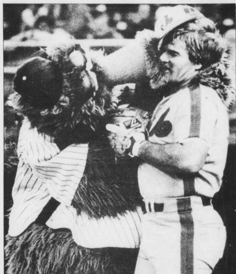
Pete Rose, des Expos, reçoit l'accolade de la mascotte des Phillies de Philadelphie, le Phillie Phanatic, à son retour au Stade des Vétérans. Rose a quitté les Phillies pour se joindre aux Expos, cette saison.

Selon la députée conservatrice, il ne fait aucun doute que le ministre a pris en otage les fédérations sportives du Canada et mis en danger les programmes d'entraînement et la participation de certains athlètes amateurs aux Jeux olympiques de Los Angeles. « Les dirigeants des fédérations sportives, a-t-elle dit, ont demandé à plusieurs reprises de rencontrer le ministre pour discuter de cette question et plusieurs autres sujets, mais il continue de faire la sourde oreille. » Toutefois, le ministre Olivier n'a pas du tout l'intention de modifier ses directives et ses décisions. « Tout ce que je demande à 22 des 70 fédérations qui ont leur siège social dans la région de la capitale, a-t-il confié au cours d'une entrevue téléphonique, c'est d'offrir des services en français lorsque 20 pour cent des athlètes qu'ils doivent servir sont des francophones. »