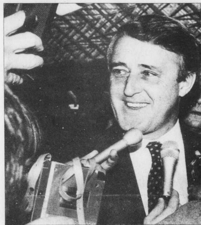
À Montréal, hier, le chef conservateur, M. Brian Mulroney, a dû répondre à la fois aux questions sur le dernier sondage mensuel de Gallup, en même temps qu'aux réactions suscitées par ses propos de la veille sur une éventuelle alliance avec les libéraux provinciaux de Robert Bourassa.