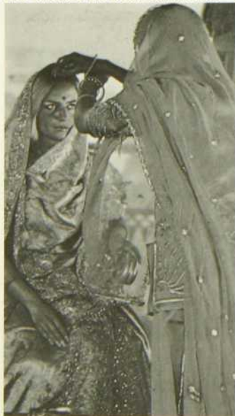
Les Mariés du bout du monde