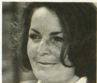
Nouvelles du sport