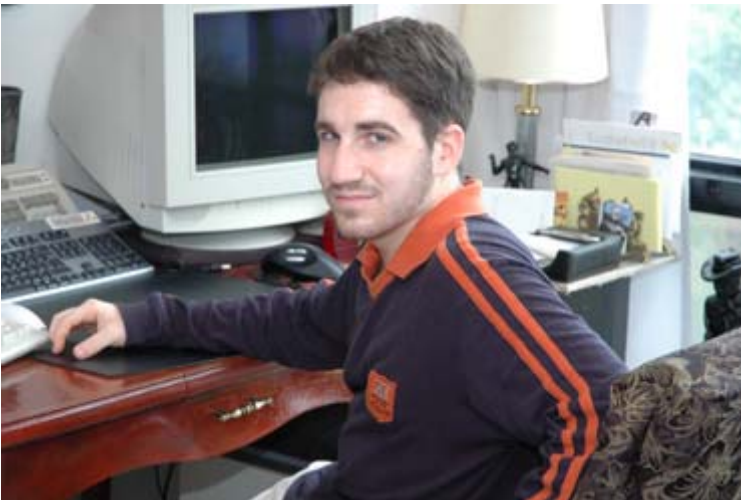
David - LeStudio1

L'amour est la chose la plus importante dans la