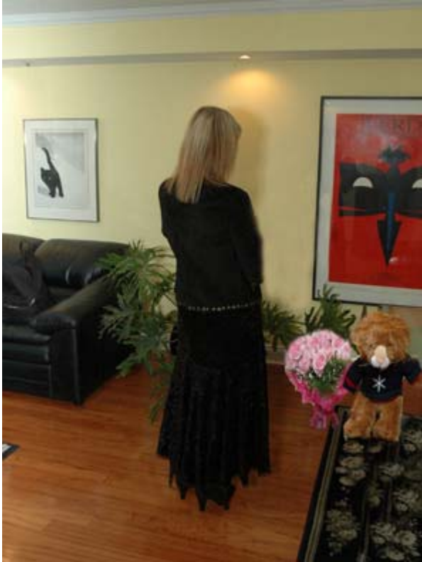
MademoiselleX et la mascote Monsieur X

«Les modèles réduits sont toujours des cadeaux très populaires, sauf ceux des sex-shops...»