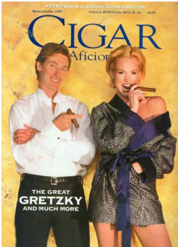
Wayne et Janet Gretzky

Celui que l'on a surnommé «The Lord of the Rink» Wayne Gretzky et sa femme Janet Jones sont au centre d'une controverse qui démontre encore une fois que les apparences extérieures sont bien souvent trompeuses. La vie c'est comme au théâtre. L'avant-scène est un mirage qui ne reflète pas toujours la réalité de l'arrière-scène. Il faut bien sûr donner le bénéfice du doute au célèbre joueur de hockey. Il a d'ailleurs dit devant des journalistes: «The reality is this: I am not involved. I was not involved. I am not going to be involved.» Il a aussi mentionné que Janet est la personne qu'il aime plus que tout au monde.