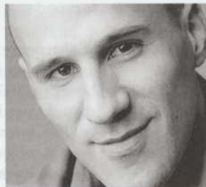
JEAN-MOÏSE MARTIN PRINCE DE VÉRONE