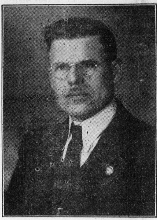
M. J.-Emile PERRON, Député de Beauce au Provincial.