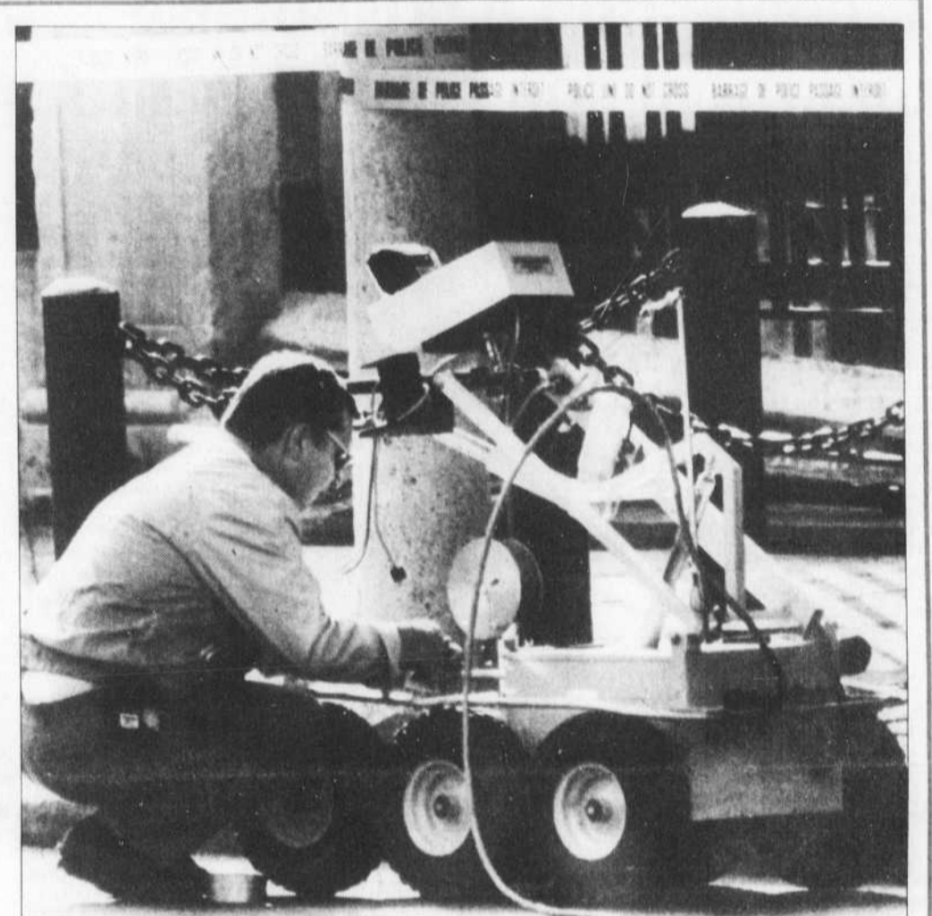
Alerte à la bombe à Ottawa

Un artificier de la Gendarmerie Royale du Canada charge un robot destiné à désarmer un colis suspect qui a été découvert, hier, sur le côté de l'édifice de l'ambassade américaine. Le colis s'est révélé tout à fait inoffensif.