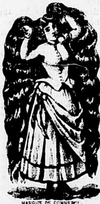
MARQUE DE COMMERCE.